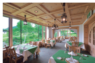
可愛らしい内装のレストラン