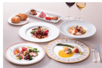
ご夕食・イタリアンのコース(イメージ)