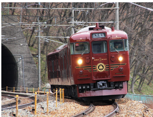
「ななつ星」のデザイナーが手がけた車両

車内では千曲市の和食会席料理店「竹葉亭」の二重膳をご用意しました。可愛らしい二重重の中には信州の旬な食材をふんだんに使用した料理が詰め込まれています。また、「ろくもん」和食コースならではの「お抹茶」も車内で点ててお客様にご提供します。料理長こだわりの創作和食料理をご堪能ください。(写真イメージ)