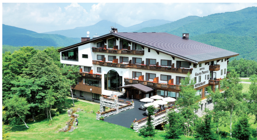
総客室数35室。洗練されたサービスでリピーターも多いホテルグランフェニックス奥志賀