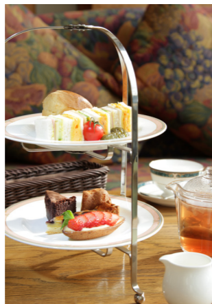
ホテル自慢のスイーツとハーブティーが楽しめるアフタヌーンティー(イメージ)

■最少催行人員：10名様 ■食事：朝食3回、昼食1回、夕食3回 ■添乗員：東京駅、名古屋駅ご出発時から東京駅、名古屋駅ご到着時まで同行します。 ■ホテル：奥志賀・ホテルグランフェニックス奥志賀(洋室) ■利用予定バス会社：アルピコ交通または同等クラス ■利用交通機関：新幹線(普通車指定席)、JR特急(普通車指定席)、しなの鉄道ろくもん(全席指定)