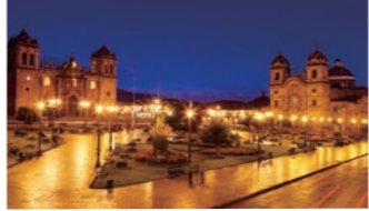
クスコの中心アルマス広場まではホテルから約5分

世界遺産クスコでは「酸素供給ホテル」のアランワクスコ・プティックホテルにご宿泊いただけます。客室に絶えず酸素が供給され、高山病になりやすい睡眠中も安心してお休みいただけます。クスコの魅力は日中もさることながら夜景の美しさにあります。ほのかに灯りが点る夕刻から夜のクスコの旧市街、さらにアルマス