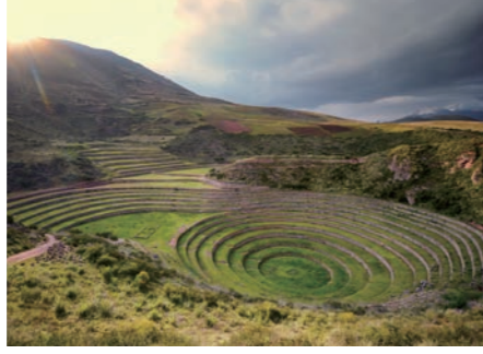
かつての農業試験場であったとされるミステリーサークルのような遺跡モライ