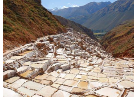
アンデスの段々畑のような塩田マラス