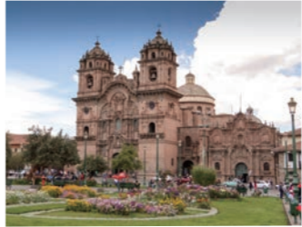
夜の美しさとはまた違う魅力を放つ日中の世界遺産クスコの町

ナスカの地上絵、マチュピチュ遺跡、世界遺産クスコと毎日がハイライトと言えるのがペルーの旅の魅力でしょう。一方でこの地を訪れる際に心配なのが高山病です。弊社ではお身体への負担を極力少なくする行程でご案内します。イグアス大瀑布を訪ねてから、まずは標高の低いリマで3連泊。その後、標高2,000メートル台のマチュピチュ村での2泊で身体を高地に慣らしてから、ク