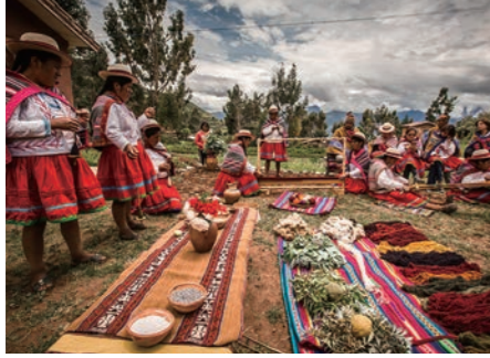
ミスミナイ村では伝統的な生活様式を見学します(イメージ)