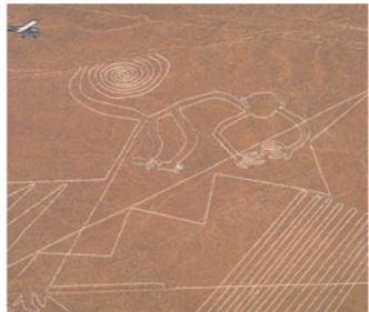
ナスカの地上絵を上空から楽しむ遊覧飛行(イメージ)

リマから南へ約400キロメートルのナスカ地域はアンデス山脈と太平洋との間の地面に「ナスカの地上絵」と呼ばれる幾何学的な動植物の絵が石や砂利を用いて描かれています。未だに何の為に絵が描かれたか不明な点も多い作品群ですが、近年、日本の山形大学の研究チームによってさらに別の場所から地上絵が発見され、注目を集めています。