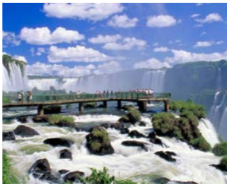
ブラジル側では滝を見上げる遊歩道散策へ(イメージ)

ブラジルとアルゼンチンにまたがるイグアスの滝。滝幅は4000メートル、1秒あたりの水量は約6万5000トンでこれはナイアガラ瀑布の約8倍に当たり、三大瀑布のなかでは最大規模です。大小無数の滝がカーテンのように連なり、水煙を立てて流れゆく美景や、最大落差80メートルを誇る「悪魔の喉笛」の吸い込まれるかのような迫力は他にはないもの。このイグアスの滝を連泊で、ブラジル・アルゼンチンの双方からご案内します。5月はちょうど乾季を迎えたり