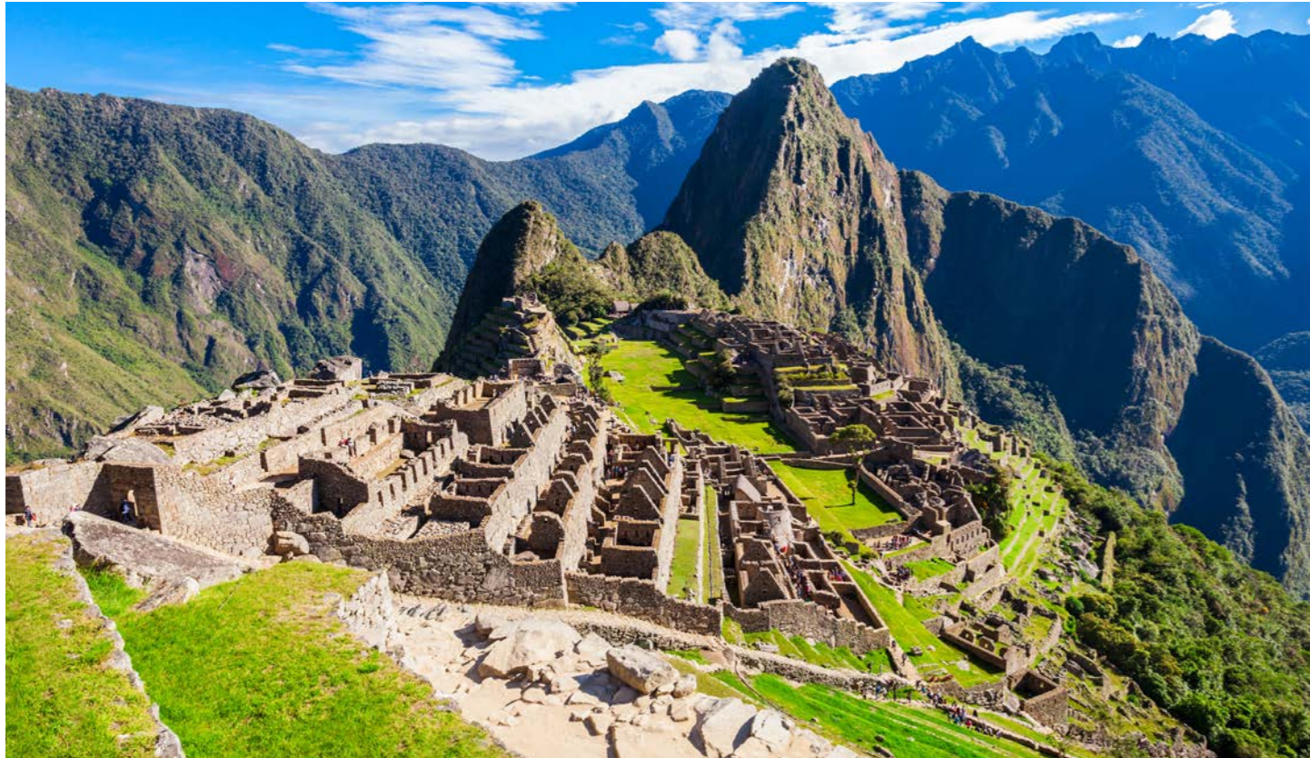
世界遺産マチュピチュ遺跡を午前と午後に分けてご案内します