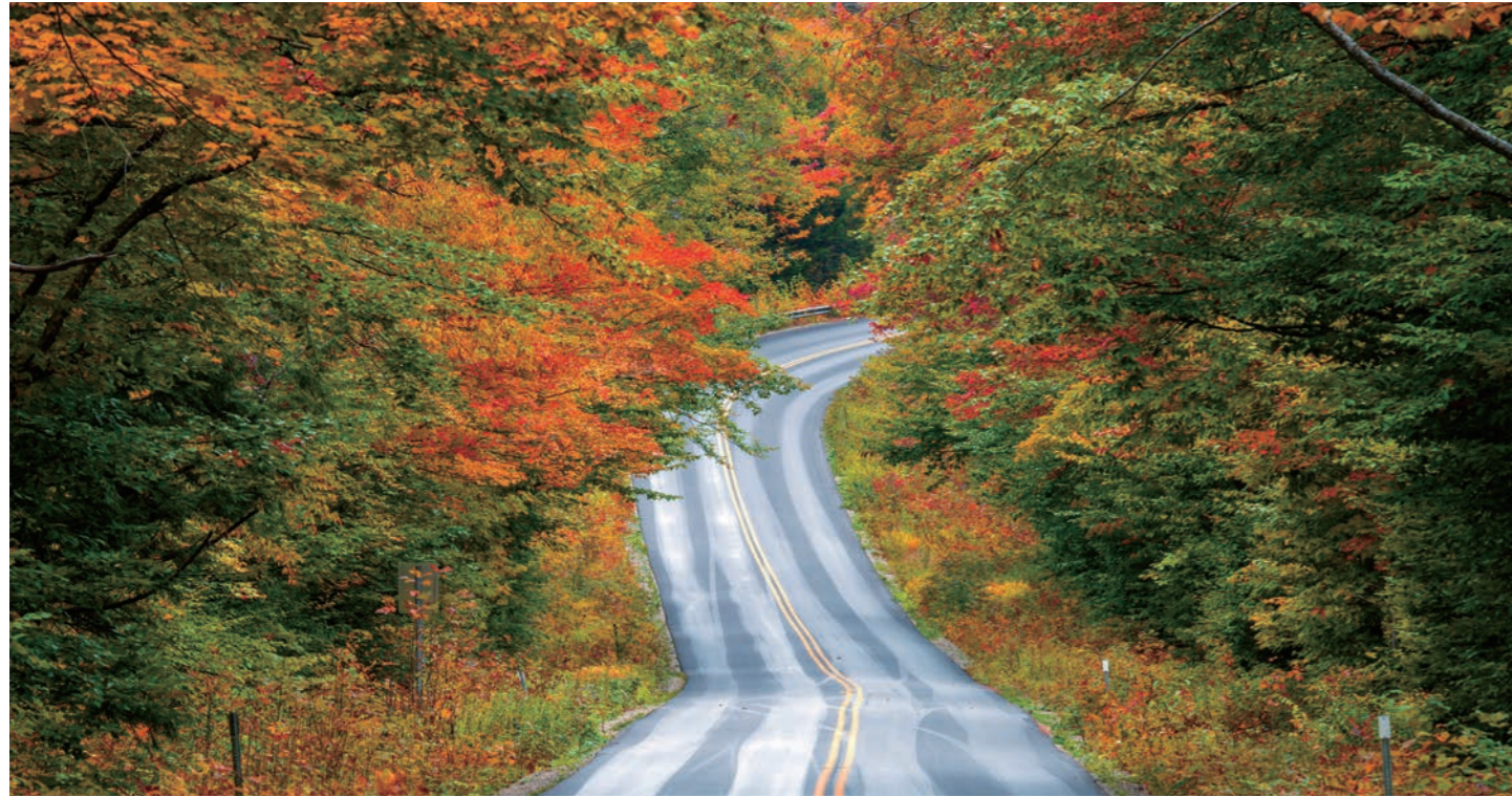
秋ならではの景色を眺めながらカンカマグス・ハイウェイをドライブ（イメージ）