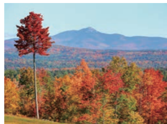
時期が合うと赤と黄色のグラデーションが美しいホワイトマウンテン周辺（イメージ）

（注）例年の紅葉の見頃にあわせて設定しておりますが、年によって見頃は前後します。あらかじめご了承ください。