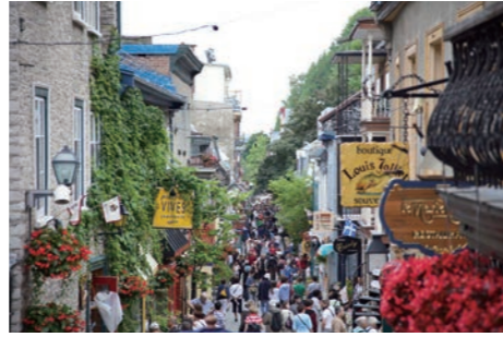
ロウワータウンはフランスの小さな田舎町のような 雰囲気です(イメージ)