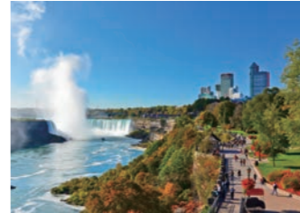
世界三大瀑布のひとつナイアガラの滝（イメージ）

ティフルーズではこのダイナミックな滝の滝壺を遊覧。瀑布の轟音や激しい水しぶきにスリルを味わいながら、滝壺付近の渦巻きまで近づきます。