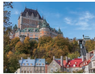
ロウワータウンから秋色に色づくケベック・シティをご覧ください（イメージ）

北米の都市の中で唯一の城郭都市ケベック・シティ。1608年、先住民が「ケベック（川の狭い場所）」と呼んでいた岬にフランス人探検家が上陸したのに始まり、フランス文化が色濃く残る町です。崖上の城壁に囲まれたアッパータウンと、崖下のロウワータウンそれぞれのエリアをしっかりとご案内します。