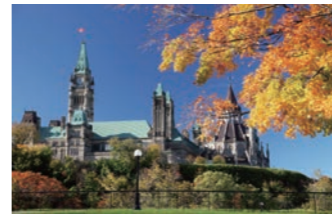
国会議事堂はリドー運河のほとりに建つオタワの町のシンボルです

おいて重要な役割を果たしました。キングストンからオタワまではリドー運河沿いをドライブし、英国的な風情を称える町々や「カナダで最も美しい町」と称されるメリックヴィルなどにもご案内します。