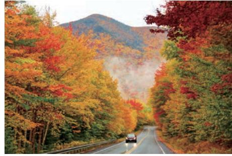
秋ならではの景色を眺めながら カンカマグス・ハイウェイをドライブ(イメージ)