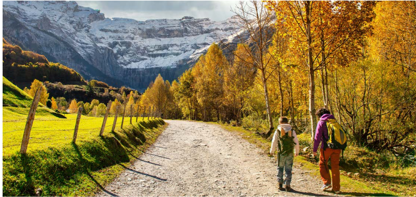
「ガヴァルニー渓谷」のハイキング (片道約2時間、イメージ)