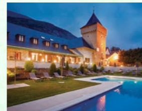
スレート屋根の伝統建築で建てられたアルティエスのパラドール

旅の締めくくりはピレネー山中のアラン渓谷に位置するアルティエス。スペイン国営ホテルの「パラドール」にてご用意しました。