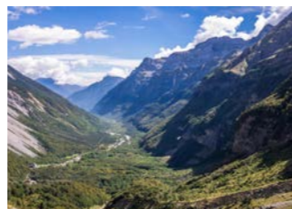
ピネタ渓谷(イメージ)

何千年もの長い年月をかけて形成されたユニークなカルスト質の圏谷。ビエルサのパラドールからピネタ渓谷の山頂約2000mまで四駆でひと上りし、モンテ・ペルディード山(3355m)をはじめとする、ピレネーの名峰を望む眺望ポイントへご案内します(※ミニバンのご案内となります)。