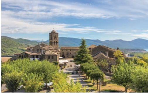
スペインの美しい村「アインサ」の全景

「ヨーロッパの美しい村」にも選ばれたアインサは、中世の雰囲気漂う路地歩きが楽しめる村です。端正な石造りの建物が印象的で、高台にある展望台からは山々を望むことができます。ピレネー山脈の自然だけではなく、大自然の麓に息づいた小さな美しい村をぜひご覧ください。