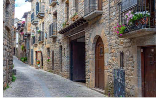
中世の趣をそのままに残した細い裏路地歩きをお楽しみください(イメージ)