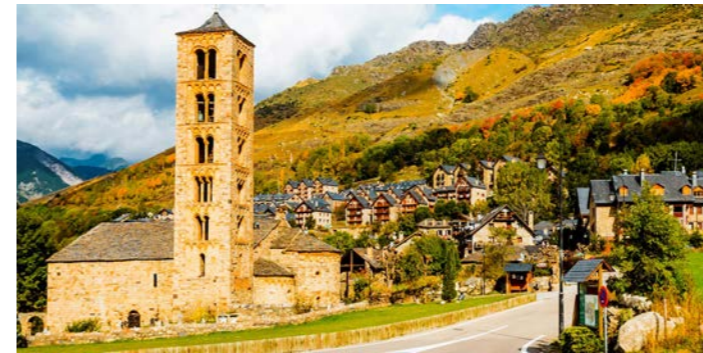
スペイン・ボイ谷 世界遺産のロマネスク教会、サン・クレメント教会

ピレネーの山間にひっそりと佇むロマネスク教会。その代表格がボイ谷であり、その里ごとに鐘楼を備えたロマネスク教会が残ります。一説ではその数2000以上ともいわれ、数と密度はヨーロッパでも屈指です。周囲から隔離された地理条件にあって、イスラムの占領を免れて伝統を守り続けた素朴な教会は、背後にそびえるピレネーの雄姿に溶け込み、一幅の絵画のような美しさです。