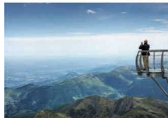
ピック・デュ・ミディ展望台から望むピレネー山脈(イメージ)

聖地ルルドを離れてからは、ピレネー山脈の峠をドライブで越えていきます。途中、ロープウェイに乗り換えてオート・ピレネー最高峰の海拔2,877mに位置するピック・デュ・ミディ展望台へ。まるで果てしなく続くかのようなピレネーの美しい山並みが眼下に広がります。