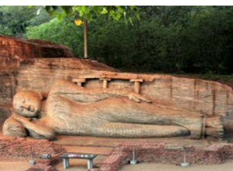
仏塔ポロンナルワのガル・ヴィハーラでは仏様の巨大な涅槃像が見られます