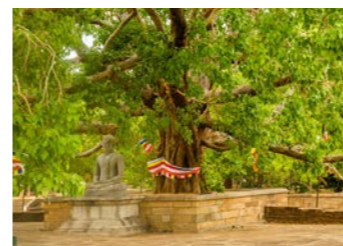
アヌラーダプラのスリーマハー菩提樹