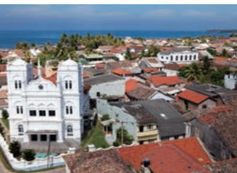
インド洋に突き出すようにして築かれた異国情緒溢れるゴール