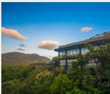
スリランカのパワのホテルのなかで唯一山と湖に包まれたヘリタンス・カンダラマ

スリランカ最良の保存状態を保つ世界遺産の石窟寺院ダンブッラ。その郊外の森に横たわるカンダラマ湖畔に築かれた、パワ建築唯一のマウンテン・リゾート。岩山を背景に湖を見下ろし、森の中に建物が包みこまれるように建てられています。またロビーや廊下にもむき出しの岩があるなど、自然との一体感を目指したパワ建築の真髄と言ってもいい代表作です。