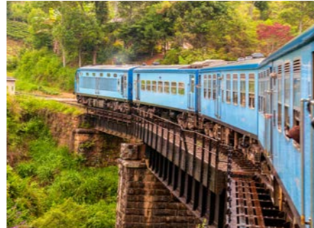
ヌワラエリヤでは鉄道の小旅行もご体験いただけます