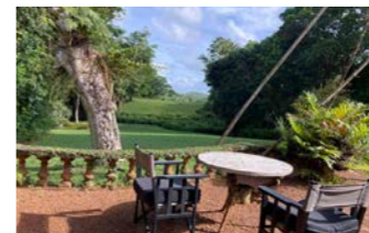
ルヌガンガ パワの理想が詰まった“楽園”でのひとときをお過ごしください