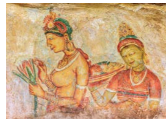
スリランカを代表する芸術 岩壁に描かれた天女シギリヤ・レディ