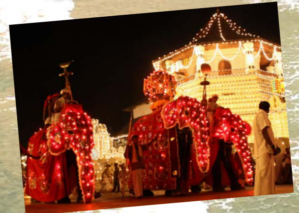
アジア三大祭り「ペラペラ祭り」(イメージ)