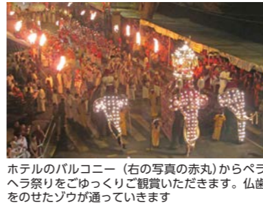
ホテルのバルコニー(右の写真の赤丸)からペラヘラ祭りをごゆっくり観賞いただけます。仏歯をのせたゾウが通っていきます

はじまりは紀元前3世紀に遡るともいわれるペラヘラ祭り。スリランカ最古の祭りは、時代の流れとともに次第に仏教的な意味合いを強め、人口のおよそ7割が上座部仏教徒であるスリランカにとって、とても重要な祭事です。毎月各地で仏教関連の祭りが催されますが、最も規模が大きなのがキャンディのペラヘラ祭り。ペラヘラとは、行列、行進を指し、全土から各地の民族衣装を身に着けた人々が集い、踊りながら行進していきます。また神聖な動物とされるおよそ100頭ものゾウが電飾の衣装をまとい、パレードするのが大きな見ものです。キャンディのペラヘラでは、人々の信仰の拠りどころである仏歯を乗せたゾウをはじめ国の四大守護神をまつる神殿のゾウが列をなして、辺りは神聖な雰囲気になります。ツアーではホテル・バルコニーの観覧席をしっかりと押さえ、アジア三大祭りのひとつともいわれる、このペラヘラ祭りをご覧ください。