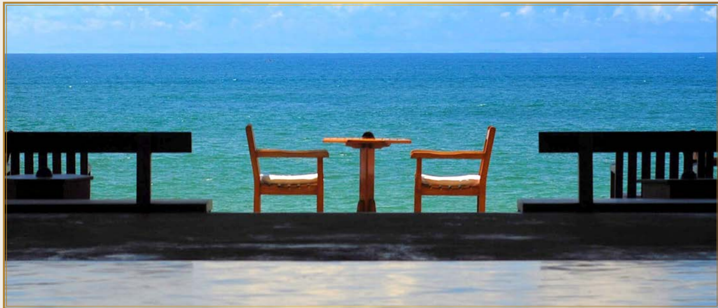
自然とホテルが見事に溶け込んでいます(ライトハウス)

ジェフリー・パワ(1919年～2003年)はスリランカ・コロンボ出身。イギリスで法律を学び、弁護士としてキャリアをスタートしましたが、世界旅行に出かけた際、建築に目覚めて転身した異色の天才建築家。その特徴は、母国の文化をスリランカの風土・自然に融合させたことです。解放感溢れるホテル・レストランからラグーンの波音を聞きながら食事を楽しむ、180度広がる青く美しきインド洋をカクテル片手に眺める、そんな贅沢な時間を演出してくれます。このツアーでは、スリランカの山と海、それぞれに溶け込むようにして造られた、パワの3つの名作ホテルにお泊まりいただけます。