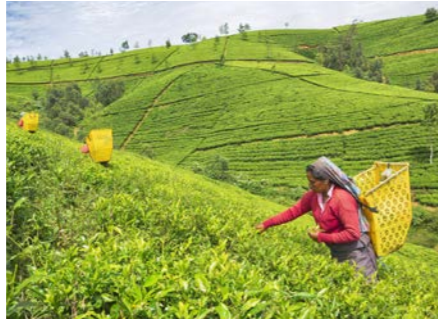
スリランカの茶の名産地ヌワラエリヤ (イメージ)

スリランカに茶の栽培をもたらしたのは、19世紀に宗主国となったイギリスでした。現在も茶はスリランカを代表する農産物で、7つの主要な産地があります。そのうちのひとつ、高地産の茶葉で知られるのが、ヌワラエリヤです。深いコクと香り高い茶葉を産みます。ツアーでは高原の避暑地でもあるこのヌワラエリヤに宿泊。茶畑を訪ねるとともにティータイムのひとつも。高原を走る列車の旅もお楽しみいただけます。