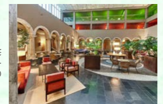
パラドール・デ・ラ・セオ・デ・ウルヘル

※バスタブ付き客室をご用意するよう努めておりますが、各地域の特性や施設の事情及び今後の世界的な「シャワーのみ客室」増加により、シャワーのみとなる場合がございます。