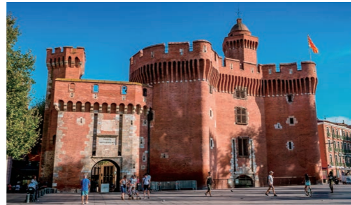
ペルピニャンのカスティエ門

期を築きました。長年にわたりカタルーニャとの関係が深く、食文化をはじめ様々な面でスペイン・カタルーニャの雰囲気味わえます。融合文化が花開いた町並みは緑と花に彩られ、明るく絵になります。