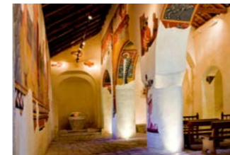
サン・ホアン教会の内部

山間にひっそりと佇むロマネスク教会。その代表格がボイ谷であり、里ごとに鐘楼を備えたロマネスク教会が残ります。周囲から隔絶された地理条件に守り続けられ、現在もピレネーの峰々に調和しています。