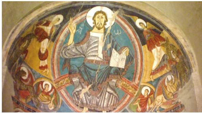
バルセロナのカタルーニャ美術館でロマネスク・コレクションを堪能します