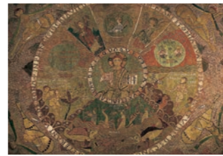
ジローナ 天地創造のタペストリー