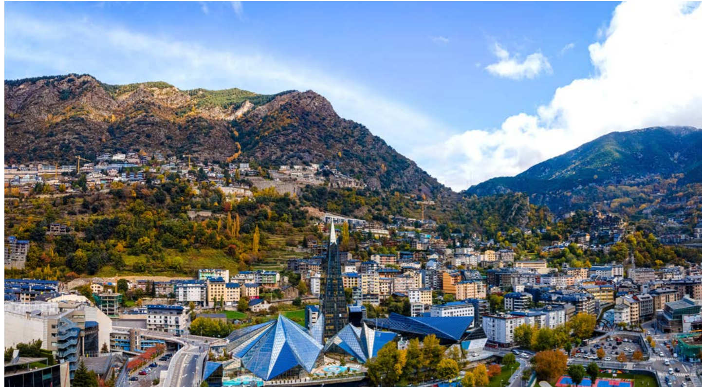
ピレネー山中の小国の首都アンドラ・ラ・ベリャ