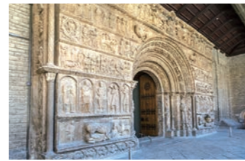
リポイ サンタ・マリア修道院に残る「石の聖書」

バルセロナのカタルーニャ美術館にア修道院の「石の聖書」、そしてジローナの「天地創造のタペストリー」。ロマネスクの真髄をご覧ください。