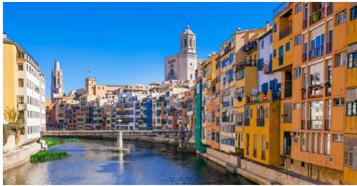
川沿いの街並みが絵になるジローナ