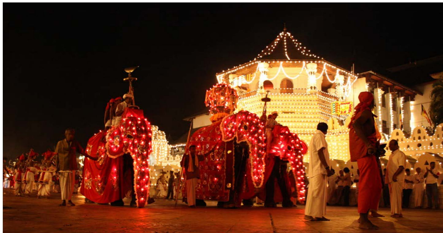
2000年以上も続く伝統のペラヘラ祭り（イメージ）