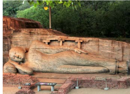
ポロンナルワのガル・ヴィハーラでは仏様の巨大な涅槃像が見られます