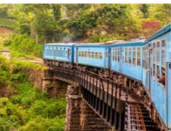
ヌワラエリヤでは鉄道の小旅行もご体験いただけます