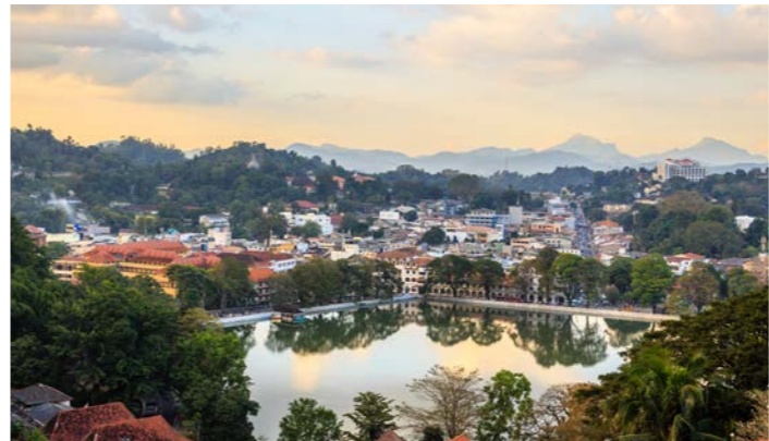
スリランカ最後の王朝の都が置かれた古都キャンディ 今回訪ねるペラヘラ祭りの舞台です

ンハラ建築の白い「八角堂」の外観が有名ですが、壁や天井の仏画や装飾も美しく、レリーフにはインドから仏歯が運ばれた様子が描かれています。滞在時には、この仏歯寺はもちろん、キャンディ・マーケットや、スリランカの紅茶栽培発祥の地でもあるペラデニア植物園にご案内します。