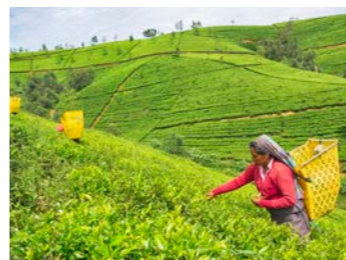
スリランカの茶の名産地ヌワラエリヤ（イメージ）

れるのが、ヌワラエリヤです。深いコクと香り高い茶葉を産します。ツアーでは高原の避暑地でもあるこのヌワラエリヤに宿泊。茶畑を訪ねるとともにティータイムのひとつも、高原を走る列車の旅もお楽しみいただけます。