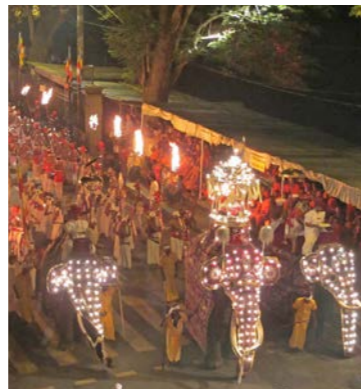
ホテルのバルコニー（右の写真の赤丸）からペラヘラ祭りをごゆっくりご観覧いただけます。仏歯をのせたゾウが通っていきます

きます。また神聖な動物とされるおよそ100頭ものゾウが電飾の衣装をまとい、パレードするのが大きな見ものです。キャンディのペラヘラでは、人々の信仰の拠りどころである仏歯を乗せたゾウをはじめ国の四大守護神をまつる神殿のゾウが列をなして、辺りは神聖な雰囲気にも包まれます。ツアーではホテル・バルコニーの観覧席をしっかりと押さえ、アジア三大祭りのひとつともいわれる、このペラヘラ祭りをご観覧いただけます。