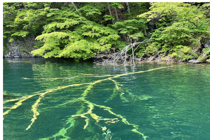
イトムカは十和田湖の特別保護区です(イメージ)