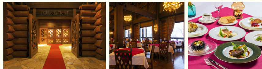
八甲田を代表する高級リゾートホテル「八甲田ホテル」。山小屋の雰囲気を出しつつダイニングでの食事もお楽しみいただけます(イメージ)

「八甲田ホテル」は、日本最大級の「洋風ログ(丸太)建築」のホテルです。その佇まいは、「森のクラシックリゾート」と呼ぶにふさわしいもの。大浴場の大きな窓からは、ブナの原生林の森が輝く風景が広がり、温泉からその景色を眺めることができます。木のぬくもりが感じられるレストランでは地ものを使った料理を堪能していただけます。