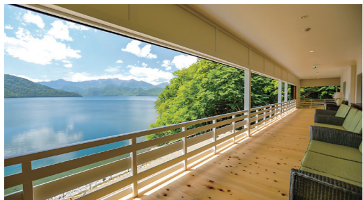
英国大使館別荘より中禅寺湖を望む