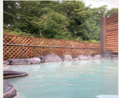
ホテル自慢のかけ流し温泉は、本家の日光金谷ホテルにはない楽しみのひとつ

天然湖として日本一の標高(1269メートル)にある中禅寺湖そばに佇む中禅寺金谷ホテルに連泊します。1940年に開業し、日光金谷ホテルと共にリゾートとしての日光を支えてきました。全客室バルコニーを備え、奥日光の雄大な自然を居ながらにして満喫できます。宿自慢の温泉は12キロ離れた日光湯元温泉から引いており、かけ流しの硫黄泉のにごり湯が堪能できます。夏でも冷涼な奥日光で、連泊にてゆっくりお過ごしください。