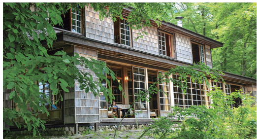
日光杉の樹皮と薄板で構成された市松模様の外壁が美しいイタリア大使館別荘