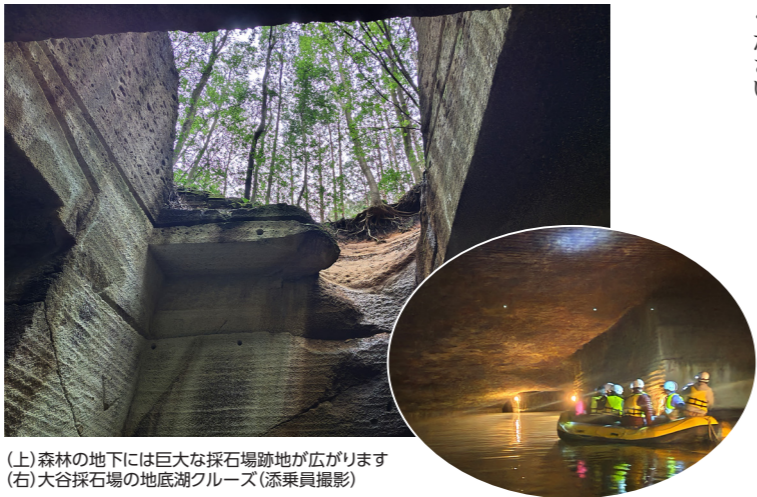
(上)森林の地下には巨大な採石場跡地が広がります(右)大谷採石場の地底湖クルーズ

リア人はコモ湖を、英国人は湖水地方をその景色に重ねたのでしょう。今回は、湖の遊覧をしながら大使館別荘にアクセスすることで、湖と山が織りなす自然景観もお楽しみいただけます。