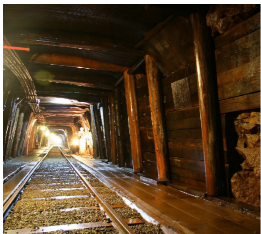
足尾銅山坑内はトロッコで見学します。

辛口で知られる旅行家イザベラ・バードが褒め称えた奥日光・中禅寺湖畔には明治中頃から各国大使館や外国人別荘が建てられ、夏は外務省が日光に移ると言われた華やかな国際的避暑地として発展してきました。イタ