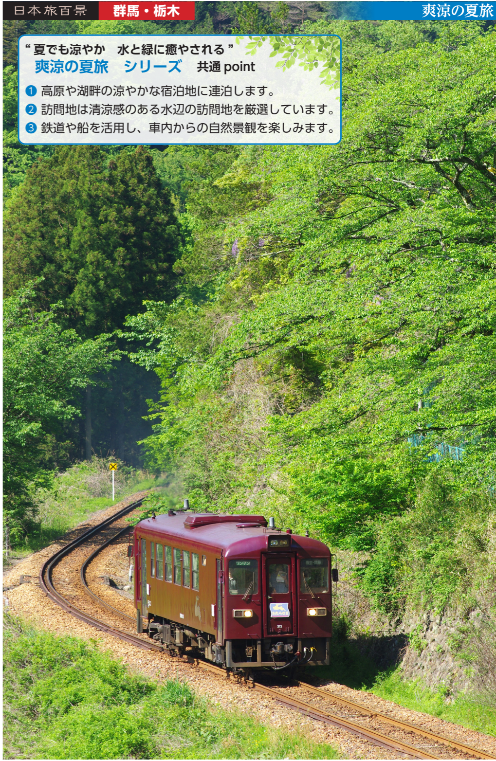
緑豊かな渓谷を走るわたらせ渓谷鉄道(イメージ)

“夏でも涼やか 水と緑に癒やされる” 爽涼の夏旅 シリーズ 共通 point 1 高原や湖畔の涼やかな宿泊地に連泊します。 2 訪問地は清涼感のある水辺の訪問地を厳選しています。 3 鉄道や船を活用し、車内からの自然景観を楽しみます。