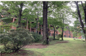
ホテル敷地の散策もお楽しみください