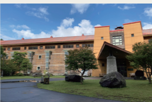
カナダ産の銘木を利用した外観