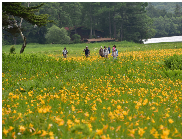
大江湿原のニッコウキスゲ(イメージ)

大湯温泉のもう一つの見どころが、枝折峠(しおりとうげ)の滝雲です。滝雲とは、雲がまるで滝のように流れ落ちる現象です。奥只見・銀山平で発生した霧が、山の谷間を覆いつくし、やがて雲の滝をつくる自然現象で、6月下旬から11月上旬の早朝、日の出前後に発生することが多いです。枝折峠の周辺には、滝雲を見る絶景展望台がいくつかありますので、当日の状況を見てご案内します。夏の早朝だけの雄大な絶景をご覧ください。 ※自然現象であるため、ご覧いただけない場合があります。