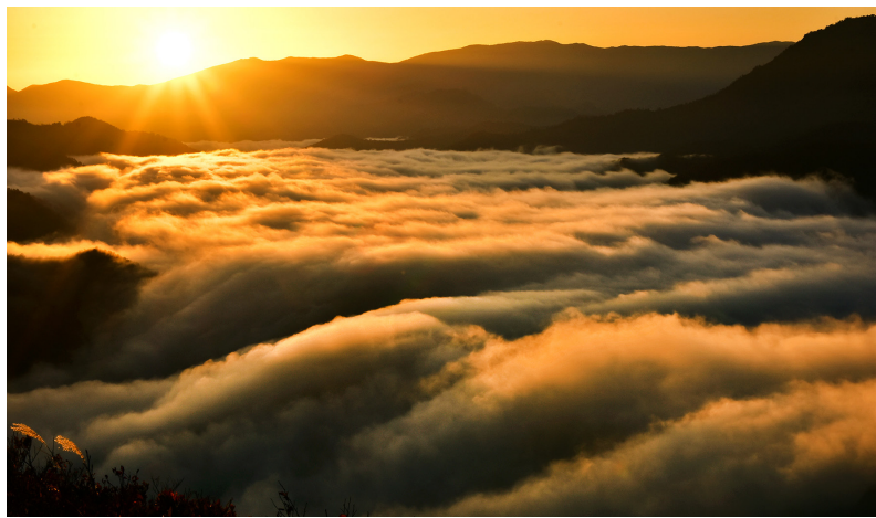
幻想的な枝折峠の滝雲(イメージ)