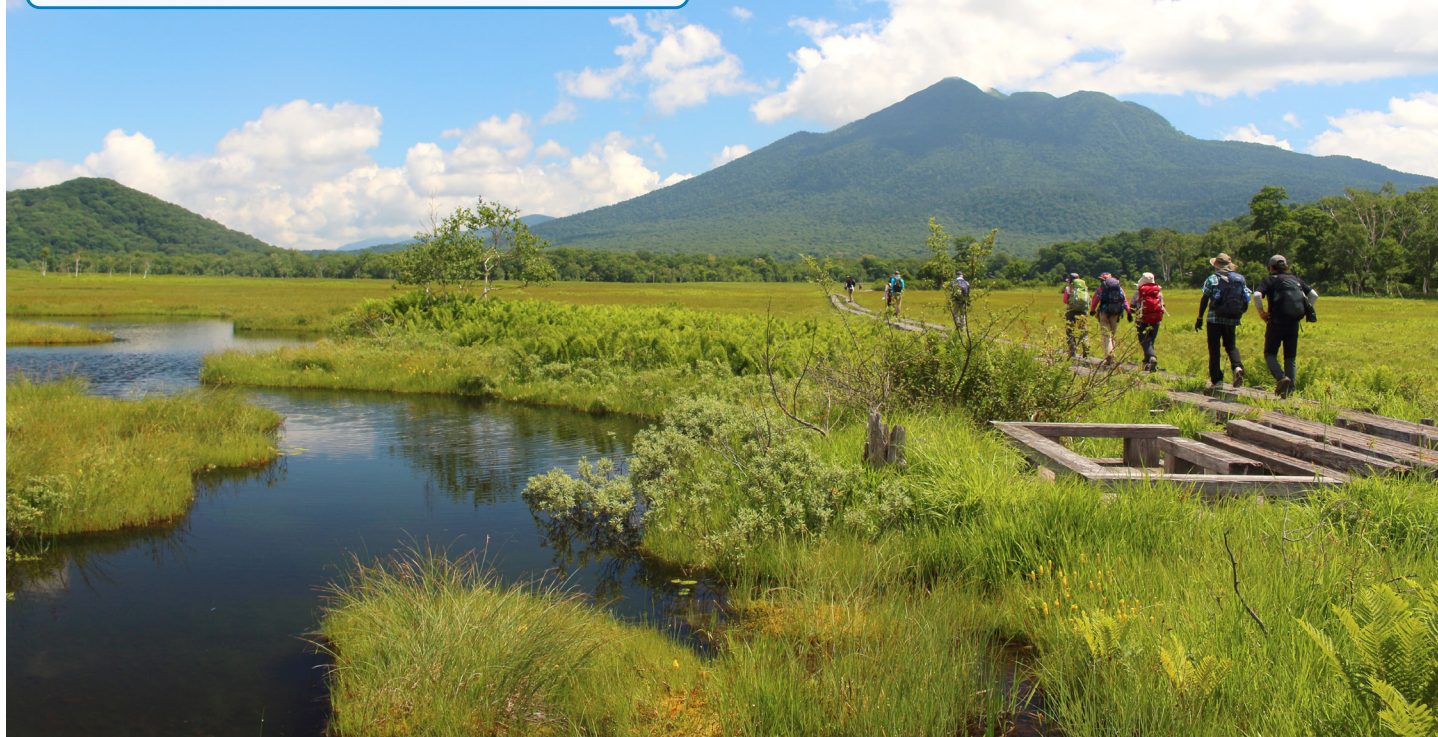
夏の尾瀬をハイキング(イメージ)