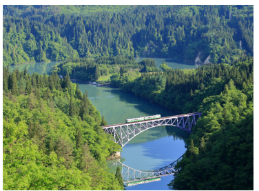
絶景を行く只見線 第一只見川橋梁(イメージ)

日本を代表する秘境路線として名高い只見線。只見川の渓谷に沿って走る絶景路線で、2011年7月の新潟・福島豪雨で甚大な被害を受け、2022年10月に11年ぶりに全線で運転を再開しました。一時は、そのまま廃止という声もありましたが、その沿線風景の美しさから、地元や多くのファンからの要望と共に復活を遂げた路線です。今回は会津川口駅から会津柳津駅までの絶景区間(約1時間)を乗車します。貸し切りバスが並走しますので、大きな荷物やバスに残し気軽に絶景鉄道の旅をお楽しみいただけよういたしました。