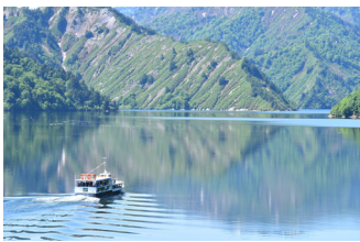
奥只見湖クルーズ(イメージ)