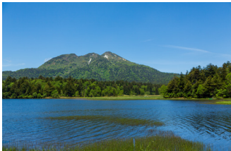
緑あふれる夏の尾瀬沼(イメージ)