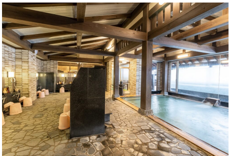
宿泊は越後大湯温泉でゆっくり2泊です(イメージ)

奥只見湖観光の拠点、魚沼の山間部に位置する越後大湯温泉に連泊します。奈良時代の僧、行基によって開湯され、1300年の歴史を持つと言われる古湯で、江戸時代には奥只見の銀山へと続く銀山街道で唯一豊富な湯量を持つ宿場町として栄えました。風情ある露天風呂を持つホテル湯元に連泊。山小屋に泊まることなく、尾瀬を楽しめます。