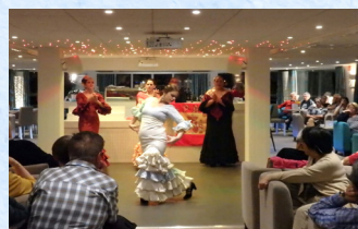
フラメンコショーも楽しめます(イメージ)

ヨーロッパのリバークルーズ会社として定評のあるフランス・クロワジ社の中でも、ワンランク上の「プレミアムシップ」のクルーズ船を利用します。20世紀のポルトガルを代表する国民的ファド歌手の名前を冠した船で、世界遺産のドウロ渓谷を7泊8日のクルージングを楽しみます。2018年に就航したこの船は3層構造ですが、このたびは、アッパー・デッキとミドル・デッキのいずれかをお選びいただけます。いずれも、フレンチバルコニー（出窓）付きのキャビンで、大きな窓から眺めを楽しむことができます。