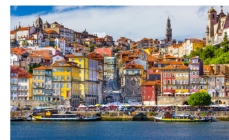
カラフルな家並みも美しいポルトの旧市街(イメージ)