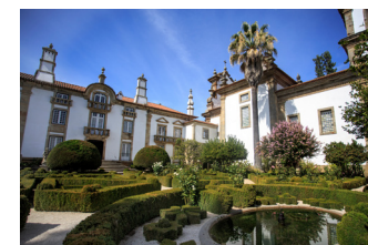
「マテウスロゼ」の産地としても有名なマテウス城館庭園

光で訪れるラメーゴは、ポルトガルを代表する巡礼地のひとつ。最も美しいバロック教会ともいわれるノッサ・セニョーラ・ドス・レメディオス教会があることでも知られています。