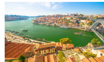
世界遺産の港町ポルトからクルーズは始まり、小さな町々をめぐり、再びポルトへ戻ってきます。

出発してレグアに向かう関門は落差36メートルという、ヨーロッパ最大級のもの。迫りくる左右の壁から、水位が徐々に高くなるにつれて風景が広がっていく様子は、最初に現れるハイライトシーンです。