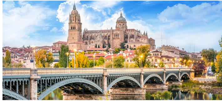
下船観光で国境を越えて、スペインのサラマンカへ。街のシンボルは大聖堂です

スペイン西部の大学町サラマンカは、古代ローマ人によって築かれた歴史ある町で、「銀の道」の中継地として栄えました。また、1218年創立のスペイン最古の大学を擁します。これはヨーロッパでも、ポローニャ、パリに次ぐ3番目の歴史を誇ります。都心から離れていることもあってのどかな雰囲気もあり、そのなかで若い学生たちのはつらつとしたエネルギーに溢れています。他方、学問の街らしく世界遺産の旧市街からは威厳も感じられます。旧市街の建物はハチミツ色の砂岩でできていたことから、日射しを浴びると黄金に輝き、サラマンカのマヨール広場はスペイン一美しいとも紹介されます。