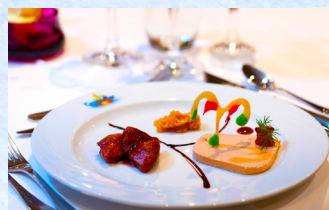
お食事も好評です(イメージ)