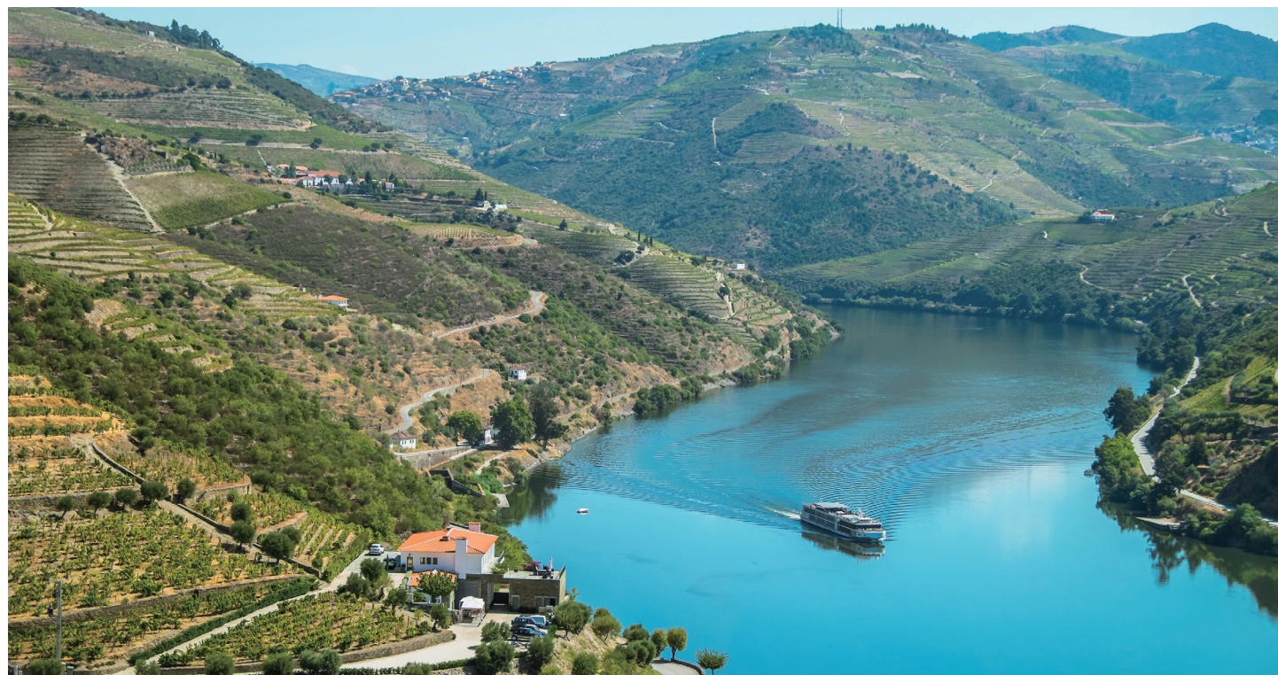
蛇行する川と急斜面につくられた葡萄の段々畑の織り成す風景が美しいドウロ渓谷（イメージ）