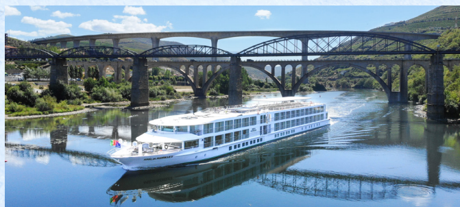
アマリア・ロドリゲス号 croisiEurope

ヨーロッパのリバークルーズ会社として定評のあるフランス・クロワジ社の中でも、ワンランク上の「プレミアムシップ」のクルーズ船を利用します。20世紀のポルトガルを代表する国民的ファド歌手の名前を冠した船で、世界遺産のドウロ渓谷を7泊8日のクルージングを楽しみます。2018年に就航したこの船は3層構造ですが、このたびは、アッパー・デッキとミドル・デッキのいずれかをお選びいただけます。いずれも、フレンチバルコニー（出窓）付きのキャビンで、大きな窓から眺めを楽しむことができます。