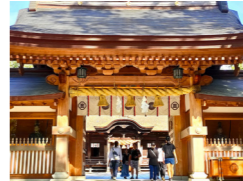
日本総鎮守大山祇神社

れ、戦勝を祈願する者たちが奉納した刀剣や武具類が宝物庫に保存展示されています。甲冑の保存は全国一で源頼朝、義仲、義経などの鎧が展示されています。平山郁夫美術館では瀬戸田で生まれ育った平山氏の芸術の原風景を発見してください。