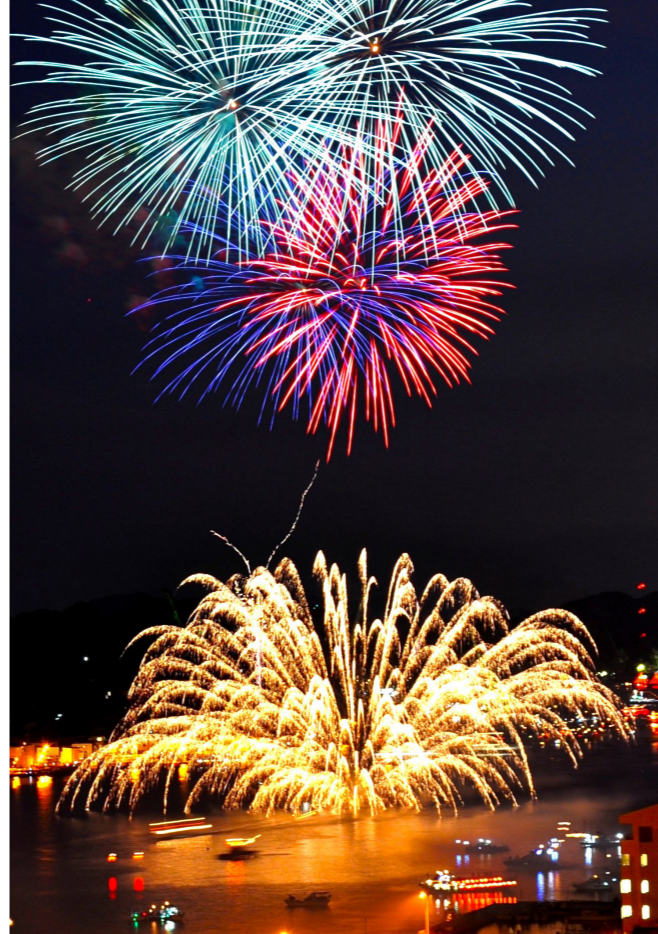
海の上で炸裂する水中花火(イメージ)