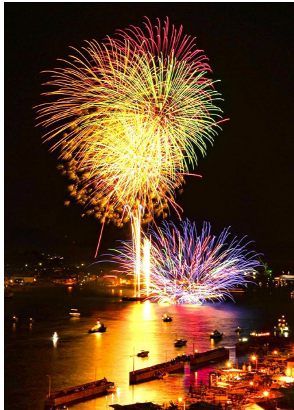
船から見上げる花火はなかなか経験できません(イメージ)

海上交通の安全と商売繁盛を願い、江戸時代から続く「おのみち住吉花火まつり」、この祭りを海上の船から見上げる特別な体験をご用意しました。この花火を見ようと尾道市内はもとより広島県内外から多くの人たちが、海と山に挟まれた狭い尾道に詰めかけ尾道市内は混雑します。そこでこのたびは、しまなみクルーズで人気のサイクルシップ・ラズリをチャーター