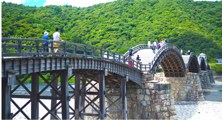
五つの反り橋が美しい錦帯橋