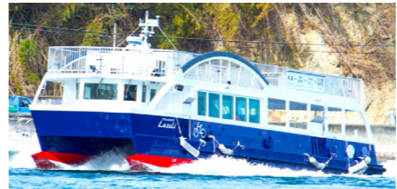
今回チャーターする「サイクルシップ・ラズリ」

このたびチャーターするのは、しまなみ海道の海や島をつなぐ青い船「サイクルシップ・ラズリ」、サイクリストの聖地と呼ばれるしまなみ海道で人気を博してきた観光船です。夕刻、三原港を出港したラズリは瀬戸内海の島々を見ながら陽が西に傾くころ因島大橋の元へ。感動的なサンセットをご覧いただき皆様で乾杯！あたりが暗くなる頃合いを見計らい尾道水道に入ると、海上花火の開幕です。目の前で打ち上げられる花火の音が対岸の山に反響し心を震わせます。しばしの間、夏の夜の芸術をお愉しみください。