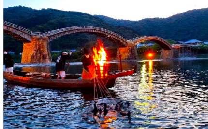
錦川の鶺鴒いを観賞(イメージ)

周防岩国は、関ヶ原の戦い以後毛利一門の吉川氏の領地となり幕末まで続きました。3代当主の吉川広嘉のときに有名な錦帯橋が完成、錦川にかかる五連の木造アーチ橋は日本三名橋や三奇橋に数えられます。このたびは錦帯橋と城山の麓に点在する吉川家ゆかりの史跡を、地元の研究家の方の解説でご覧いただけます。また、このたびは柏原美術館が所蔵する国宝の名刀「稲葉江」も特別に見学します。そして夜には岩国の夏の風物詩「錦川の鶺鴒い」をご覧ください。