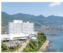
3連泊するグランドメルキュール別府湾リゾート&スパ

九州を代表する温泉の町、別府近郊の「グランドメルキュール別府湾リゾート&スパ」を拠点として3連泊。人気の海側客室をご用意しました。温泉大浴場からは、豊後水道の大パノラマが望めます。