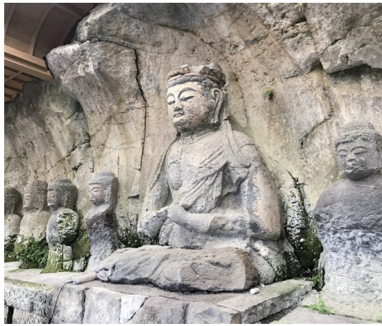
(左)国宝の白杵石仏群 端正な表情が特徴的な大日如来像／(右)熊野磨崖仏群(重文)の不動明王像