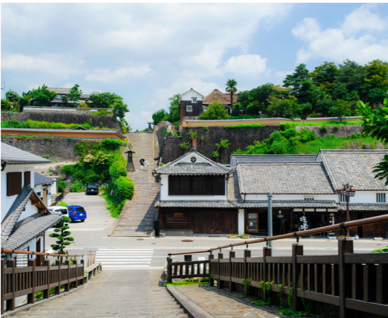
杵築 塩屋の坂から眺める許屋の坂

の磨崖仏が点在しています。大分県には、全国の磨崖仏のうち約7割が現存し、約90か所に400体もの磨崖仏が存在するのだとか。