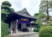
的山荘(てきざんそう)

皇族をはじめ多くの著名人をもてなしてきた料亭「的山荘」。豊後水道の新鮮な海産物など地元食材の料亭料理の味はもちろんのこと、別府湾を一望する約3000坪もの敷地に建つ伝統的手法を残した近代和風建築の日本家屋も見ごたえがあります。玄関の式台や床、書院などの座敷飾り、欄間彫刻などの江戸時代以降の伝統手法は必見です。