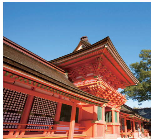
学業と縁結びの神 八幡様の総本山 富貴寺大堂

天台宗の山岳仏教に、全国の八幡神社の総本山である宇佐神宮が溶け込んだのが国東半島です。歴史好きならずとも、日本人なら一度は訪れておきたいエリアです。