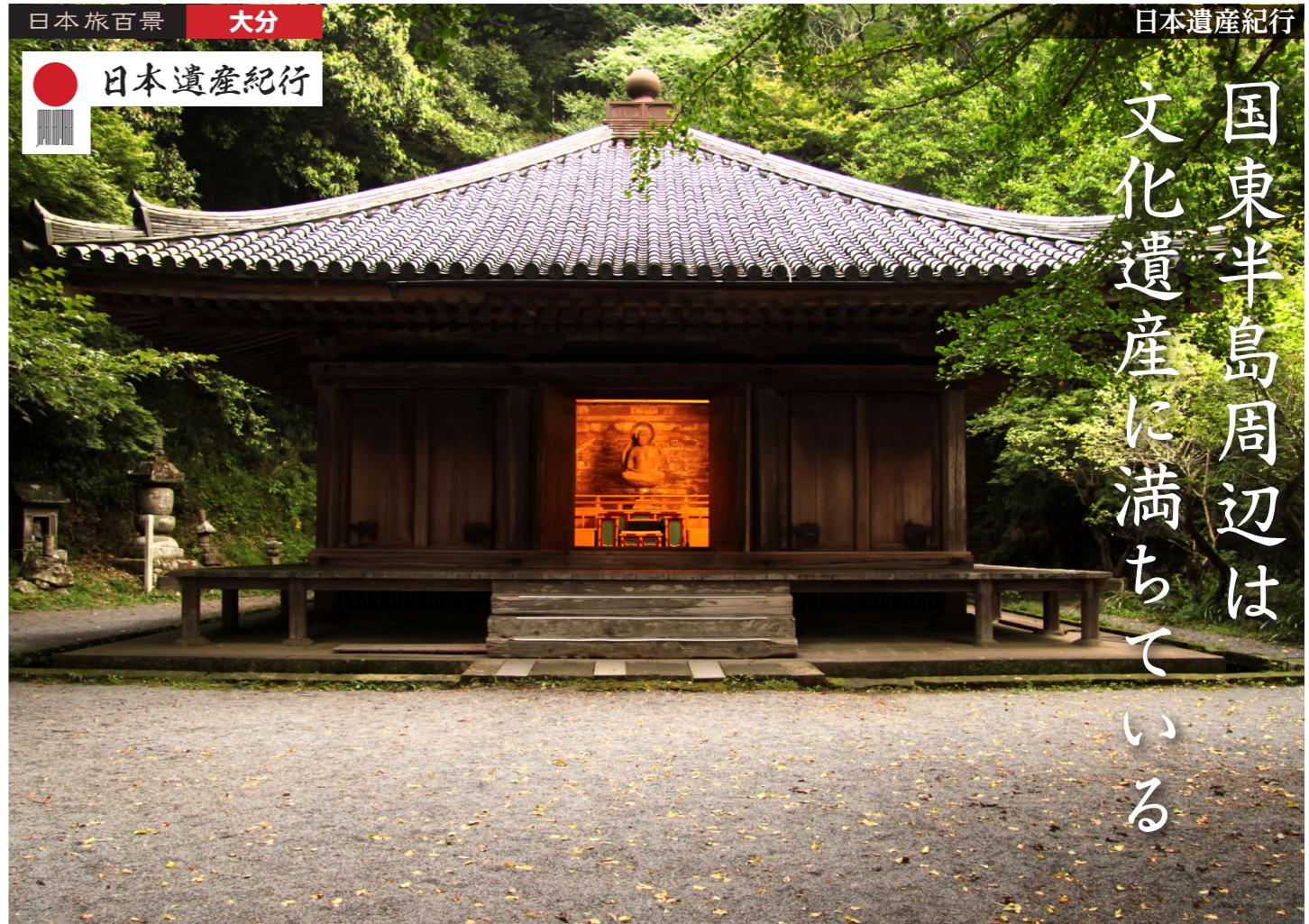
富貴寺は、平安時代に宇佐神宮大宮司の氏寺として開かれた由緒ある寺院。中でも国宝に指定されている富貴寺大堂は、現存する九州最古の木造建築物です