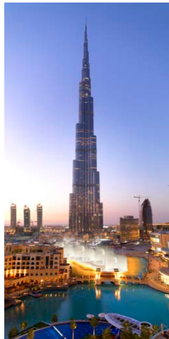
828mの世界最高の人口建造物、ブルジュ・ハリファ（ドバイ・モールにあります）