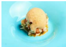
素材の味を活かした料理が好評です (イメージ)

2022年の6月、世界的に有名なレストランガイドブックが初のドバイ版のレストランガイドを発表しました。国際都市ドバイらしく、アラブ料理だけでなく、21種類の料理を提供する、69のレストランが発表されました。このたびのツアーではその中から注目のイタリアンレストラン「トルノ・スピト」にご案内します。指揮を執るのは2016年と2018年に世界のベストレストラン50で1位に輝いた、イタリア・モデナ近郊の「オステリア・フランチェスカーナ」のマッシモ・ポットウーラシェフ。素材の味を活かしたシンプルなイタリアンが美味しいと評判で、イタリアン・リビエラをイメージしたカラフルでカジュアルな内装は肩肘張らずに1つ星のイタリアンを楽しめます。