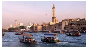
ドバイの伝統的な水上タクシー「アブラ」に乗船

今や世界の最先端都市のイメージが強いドバイですが、オールド・ドバイの中心バスタキヤ地区には、冷房完備の現代建築とはまるで違う、家々に涼をもたらす風の塔を備えた伝統建築の町並みが保存され、かつての雰囲気を与えています。すぐ近くには昔ながらのスークが残り、スパイスや絨毯を商う店がずらり。伝統的な舟を使った庶民の足アブラの乗船など、これぞアラブという旅情をお楽しみください。