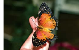
ドバイに生まれた新しい蝶々の楽園、バタフライガーデン

ドーム内には50種以上の蝶が優雅に舞っています。館内をゆっくりと散策してみましょう。