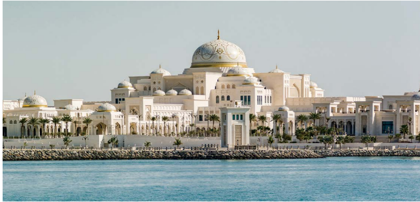
近年入場ができるようになった大統領官邸「カスル・アル・ワタン」