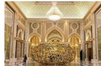
絢爛豪華な装飾が印象的なカスル・アル・ワタンの内部