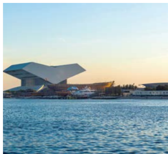
伝統的なコーランの朗読台の形を模したムハンマド・ビン・ラシッド図書館

今やドバイの象徴となった206階建てのブルジュ・ハリファ、まるで帆船のようなブルジュ・アル・アラブ、そして世界最大面積の人工島パーム・ジュメイラなど、最先端都市ドバイを訪ねれば、科学技術の進歩と人間のあくなき挑戦を目のあたりにします。また、同時に砂漠だった地に勢いよくほとばしる噴水に、砂の国の人々が憧れてやまなかった自然への思いを感じます。このたびのツアーではドバイが誇る建築物やスポットへご案内。高さが150mと世界最大の額縁でもあり、展望台でもあるドバイ・フレーム、コーランの朗読台を模したムハンマド・ビン・ラシッド図書館など圧巻の建築群をお楽しみください。