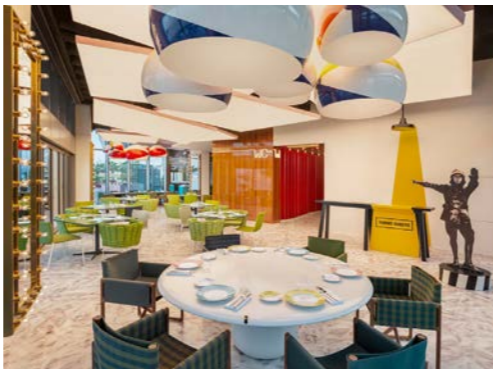
「トルノ・スピト」の店内(イメージ)