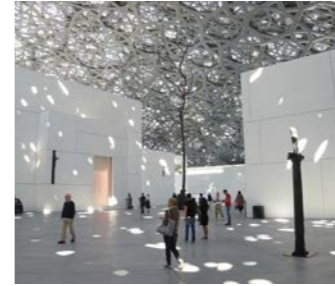
展示品だけでなく、建物自体も特徴的なルーブル・アブダビ

ルーブル美術館やオルセー美術館、ギメ東洋美術館から貸与された珠玉の作品が、現代的な建築美を誇る空間で新しい価値を見せてくれています。レオナルド・ダ・ヴィンチの「ミラノの貴婦人」やモネ、ゴッホなどの有名作品、日本の美術品もかなりレベルが高く、さらに世界史を俯瞰できる出土品なども興味深いものです。