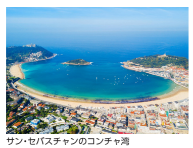
サン・セバスチャンのコンチャ湾