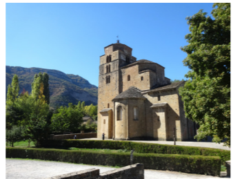
サンタ・クルス・デ・ラ・セロス村のサンタ・マリア教会

います。もう一つはサン・ファン・デ・ラ・ペーニャ修道院。自然の崖下の窪みを利用して造られた修道院は、岩山に守られるように行んでおり、回廊と周囲の緑のコントラストも絶妙な一体感を成しています。スペインを代表するロマネスク建築をじっくりと鑑賞します。