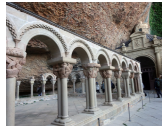
サン・ファン・デ・ラ・ペーニャ修道院の回廊