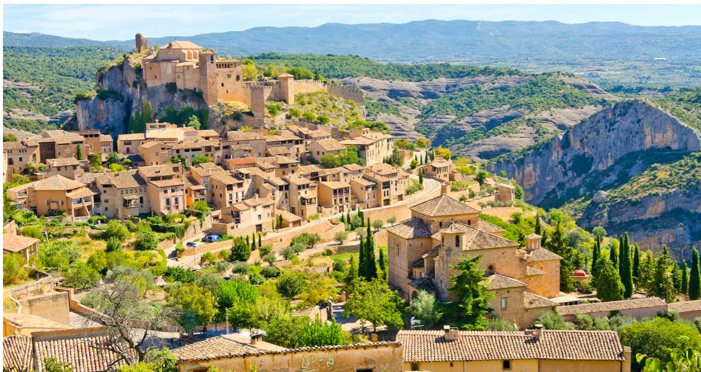
イスラム教徒の岩として造られた町アルケサル