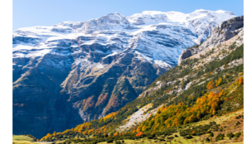
ララリ平原へはハイキングで、大自然の中へ入っていきます

じ道を歩きます) ※午後は絶景パドールでのんびりとお過ごしいただくことも可能です。ご気分に合わせてお選びください。