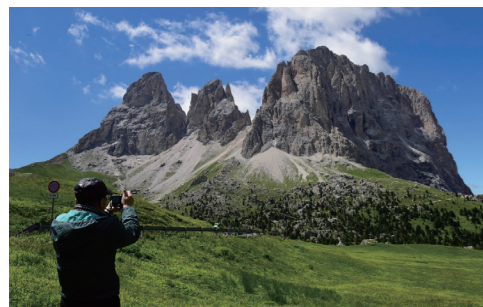
セッラ峠よりサツ・ルンゴ山群を望む (イメージ)

スイスのアルプスとは趣を異にする、垂直に切り立った荒々しく男性的な景観が魅力の北イタリア・ドロミテ山群。代表的な岩山群トレ・チーメやドロミテ街道のドライブはもちろん、このたびはサツ・ルンゴの麓にある絶景の山岳ホテル「パツ・セッラ・ドロミテ・マウンテン・リゾート」での連泊も組み込みました。カラフルな家々がチロルのような雰囲気を持つガルディーナ渓谷のオルティセイ、まだまだ訪れる観光客も少ないドロミテの奥座敷フネスの谷、白砂の広がるブライエス湖など知られざるドロミテの魅力を東西に渡りじっくりと巡ります。