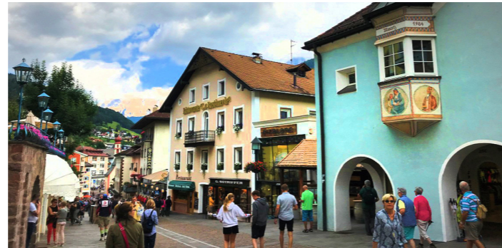
パステルカラーの街並みが美しいオルティセイ

ドロミテの観光といえば、西のボルツァーノから東のボルチーナへ至る「ドロミテ街道」が有名ですが、この旅ではドロミテ街道本道からセッラ峠を越えてオルティセイまで足を伸ばします。このルートは、セッラ山群とサツ・ルンゴ山群の合間を縫って走る、迫力満点のルートです。宿泊は峠に位置する絶景ホテルをご用意しました。