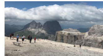
ボルドイ峠ではロープウェイで崖上の展望台を訪れます (イメージ)

3,000メートルを超える峰が18座あり、切り立った岩山がまるで天に突き刺さるかのような迫力の景観が特徴のドロミテ山群。ドロミテ街道沿いの絶景スポットやトレチーメなど、様々な角度からその絶景をお楽しみください。