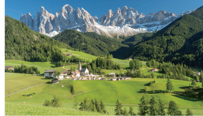
フネスの谷 サンマッダレーナ村の景観 (イメージ)