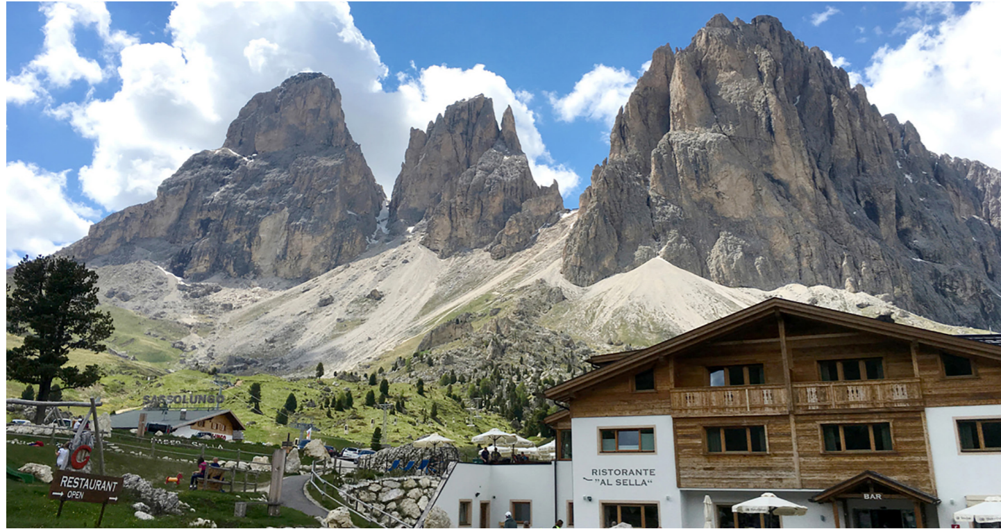
ホテルの裏手にはサツ・ルンゴの山塊が間近に迫ります (イメージ)