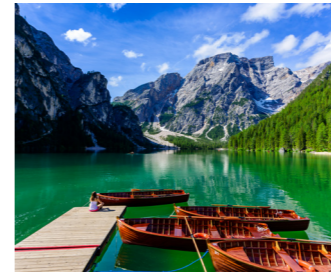
神秘的な風景が広がるブライエス湖 (イメージ)

ドロミテの中でも、訪れる観光客がまだまだ少ないフネスの谷では、なだらかな丘に緑豊かな牧草地とドロミテのガイスラー山群がご覧いただける絶景の展望スポットにご案内します。午後の順光時間帯に訪れるのがツアーのこだわりです。また、神秘的な風景が楽しめるドロミテ北部のブライエス湖へも足を伸ばします。