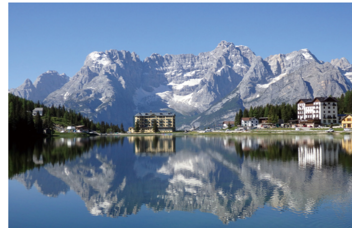
ミズリーナ湖 (イメージ)