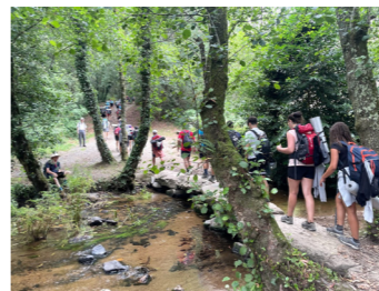
サンチャゴ巡礼路を歩く(イメージ)