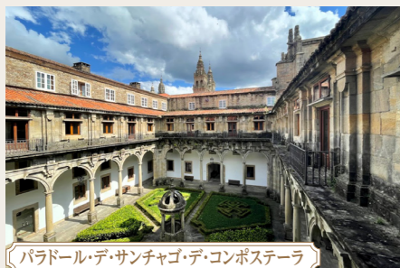
パラドール・デ・サンチャゴ・デ・コンポステーラ

スペイン国内の歴史的建造物を改装した国営の宿泊施設のパラドール。現在、90以上のパラドールがありますが、中でも人気が高く、高級感と歴史を感じることができるのがレオンとサンチャゴ・デ・コンポステーラのパラドールです。近年パラドールはとても人気が高く、グループで一定数の部屋数を押さえるのが非常に難しい状況になってきています。このたびは、レオン、サンチャゴ、そしてフェンテ・デの3つのパラドールを確保し、皆様をご案内いたします。