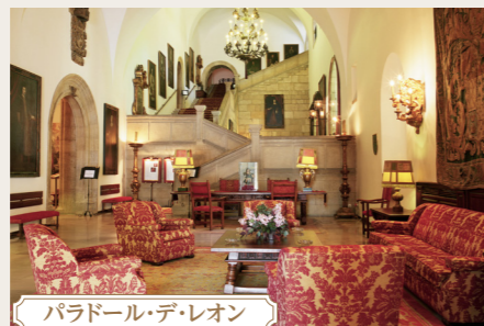
パラドール・デ・レオン

スペイン国内の全パラドールの中でも屈指の人気を誇ります。サンチャゴ大聖堂のそば、オブライロ広場に面して建ち、石造りで重厚感があり、豪華に装飾された館内はまるで芸術品のような様子です。