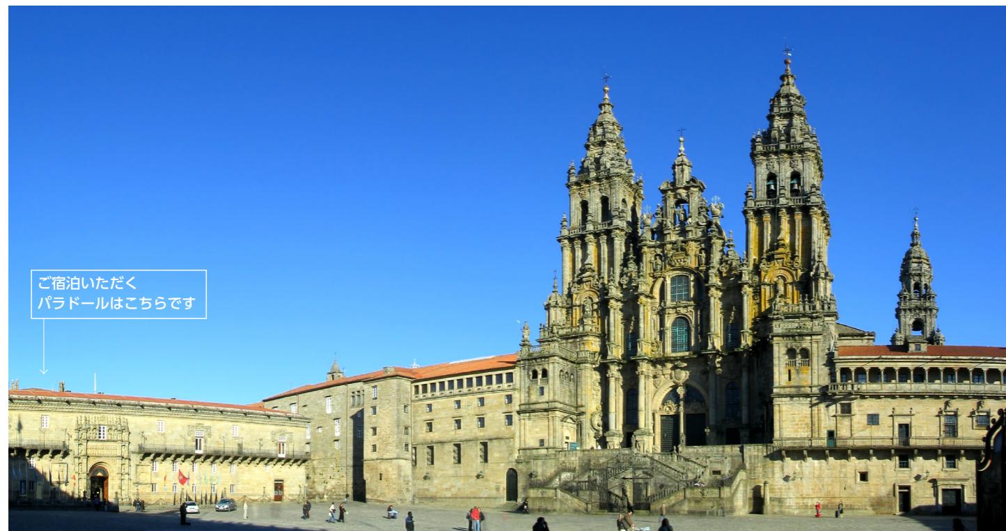
サンチャゴ・デ・コンポステーラの大聖堂とオブライロ広場