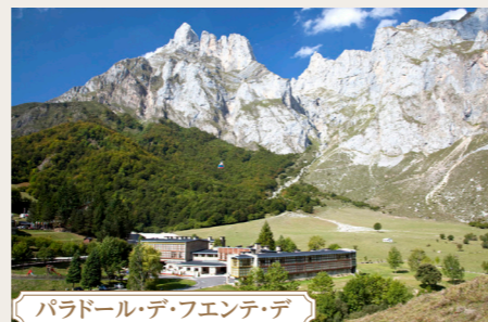
パラドール・デ・フェンテ・デ

歴史ある修道院を改装。ゴシック様式の建物にルネサンス装飾を施したスペイン独特のプラテレスコ様式が特徴です。2019年には大規模な改修工事を終え、中世の雰囲気と現代の快適性を併せ持つパラドールとなりました。