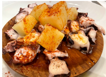
パラドールの夕食、タコのガリシア風 (添乗員撮影・イメージ)