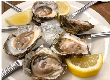
海沿いでは新鮮なシーフード、山間部では野菜や牛肉など質が高く日本人の口に合うものばかりなのがうれしい。パルでは様々なシーフードを楽しみました。