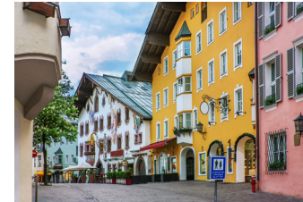
かわいらしい街並みが続くキッツビュール

で飾られた家々が軒を連ねる旧市街は、歴史の重みを感じさせる見事な佇まいで、散策が実に楽しい街です。