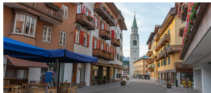
コルチナ・ダンペッツォの目抜き通り、コルソ・イタリア

び、途中にある教会やアルプスの姿が町の雰囲気よりいっそう盛り上げています。周辺のミズリーナ湖やドライチンネンが間近に迫るほぼ平坦なハイキングルートにご案内します。