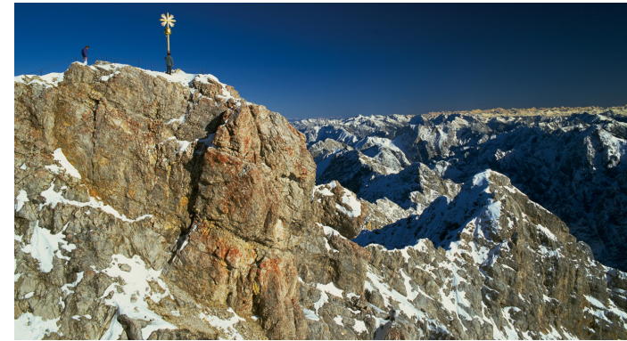
ドイツ最高峰、ツークシュピツェの山頂(イメージ)

としました。国内最高峰、標高2962メートルの山頂を目指し、登山鉄道とロープウェイを利用します。中腹にあるアイブ湖もご覧いただけます。