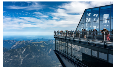
ツークシュピツェ展望台 ドイツ最高所にあります

ドイツ最高峰のツークシュピツェ、オーストリア最高峰のグロスグロックナー、そして岩肌が露出した峻険な北イタリアのドロミテ山塊。バイエルンアルプスから国境を越え、ヨーロッパでも屈指の眺望を誇るグロスグロックナー山岳道路のドライブや、北イタリアのコルチナ・ダンペッツォを起点に風光明媚なドロミテ山群を終日かけて巡り、三国に跨る山岳風景を満喫する行程としました。途中山麓の町ガルミッシュ・パルテン・キルヒェンやハイリゲンブルート、チロル地方の歴史ある村キッツビュールにて宿泊し、旅の後半はドロミテ観光の拠点コルチナ・ダンペッツォに連泊。エメラルド色に輝くカレツァ湖を訪ねたり、ポルダイ峠のロープウェイで展望台に登ったりと、変化に富んだプログラムでドロミテの魅力も楽しめます。