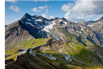
1935年に完成したグロスグロックナー山岳道路(イメージ)

ヨーゼフス・ヘー工展望台からの景色をお楽しみください。ドライブ後は谷間の村、ハイリゲンブルートに宿泊します。