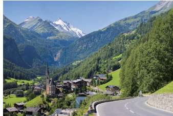
山間の美しい村ハイリゲンブルートに宿泊します