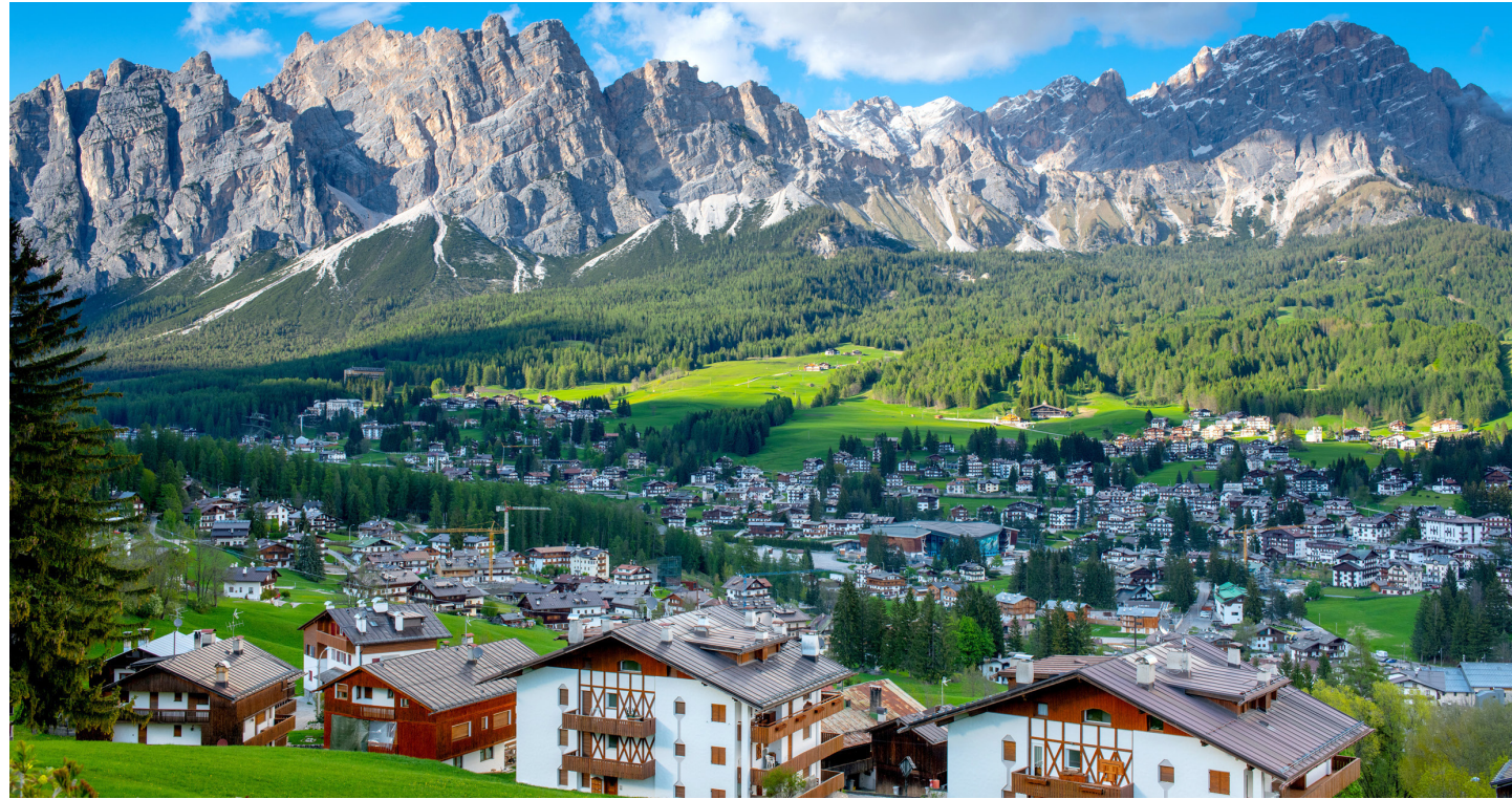
ドロミテ観光の拠点、コルチナ・ダンペッツォに2連泊