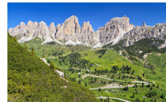
ドロミテの絶景とポルダイ峠

れます。「ドロミテの女王」と称えられる、この地域では珍しい氷河をまとった美しい姿をご覧ください。