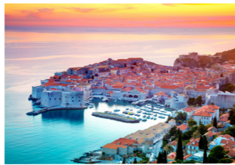
かつてヴェネチアやジェノヴァなどの海洋国家と肩を並べたその街並みが今に残る（イメージ）

たく自由時間を設けており、徒歩10分の好立地なホテルをご用意しているのも当社のこだわりです。