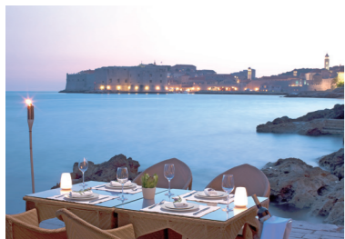
ホテルから海越しに眺めるドブロヴニクの旧市街も風情があります（イメージ）

「旧ユーゴスラビア」と呼ばれていた時代から、多くのお客様にご好評をいただいていたクロアチアとスロベニアの旅。高速道路の開通などインフラが整備されたことで無駄なくスムーズにご案内することができるようになってきました。このたびは、3カ所の連泊を設け、ドブロヴニクをはじめとするアドリア海沿いの世界遺産の町々やプリトヴィツェ国立公園、「アルプスの瞳」と称えられるブレッド湖など、主要な見どころをじっくりとご案内します。プリトヴィツェ国立公園の観光では、公園入口まで徒歩圏の立地のよいホテルをご用意しましたので、赤や黄に色づく絶景をお楽しみください。ドブロヴニクでは観光や散策をたっぷりとお楽しみいただけるよう、旧市街まで徒歩10分程度に位置するホテルを確保しました。イストラ半島や、モンテネグロの世界遺産コトルにも足を延ばす行程です。