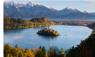
ユリアンアルプスを背に横たわるブレッド湖

アンアルプスの麓にある一周6キロほどのかわいらしい湖とその周辺には、まるで絵画のように美しい景観が広がります。湖畔のドライブや船で小島に渡るなど、様々な角度からその美しさをお楽しみいただけます。