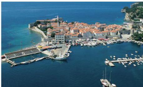
ベネチア統治時代の面影を残すブドヴァ

アドリア海沿岸は、変化に富んだ複雑な海岸線に入り江と美しい小島が点在し、世界でも屈指の美しさを誇っています。港町コトルもその一つ。フィヨルドの最奥に位置するモンテネグロの世界遺産です。歴史は古く、起源は2500年前まで遡るといい、特に中世にはアドリア海南部の政治、文化の中心地でした。城壁に囲まれた旧市街には、ローマカトリック、東方正教会、またイスラム教のモスクもあり、ベネチアと東方を結び「海のシルクロード」であった時代を今に伝えてくれます。一方のブドヴァは400年もの間、ベネチア共和国によって支配されていた古都。ドアーや窓、そしてバルコニーなど旧市街の建造物は数百年前のベネチア共和国時代の様式で街並みが統一されています。