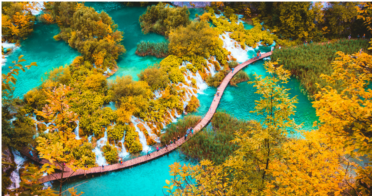
水と緑の間を縫うように整備された木道を歩きます（イメージ）