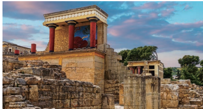
古代の歴史ロマンに誘うクレタ島のクノッソス宮殿跡

エーゲ海に浮かぶ島々で必ず名前が挙がる、ミコノス島、クレタ島、サントリーニ島、そしてロードス島もめぐる4泊5日のクルーズにご案内します。屋根から壁まで真っ白な家々が並び、ターコイズブルーの空や海とのコントラストが眩しいミコノス島。島の中心ミコノスタウンでは迷路のような路地の散策が楽しめます。サントリーニ島は断崖絶壁の上に張り付くように白い街並みが続きます。クレタ島はエーゲ海最大の島。遙か昔、紀元前に栄えたクレタ文明の遺跡が残され、ギリシャ神話でも知られる、クノッソス宮殿遺跡にご案内します。