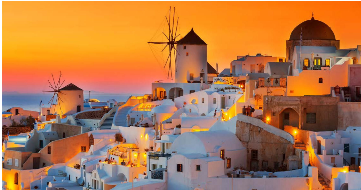
サントリーニ島寄港時には、イアの夕日鑑賞へご案内します(注2)