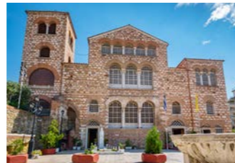
ギリシャ最大級のアギオス・ディミトリオス聖堂

街に残る「テッサロニキの初期キリスト教とビザンティン様式の建造物群」は世界遺産に登録されており、とくにアギオス・ディミトリオス聖堂は、内部のモザイク画が見事なギリシャ最大の正教のバシリカとして知られています。