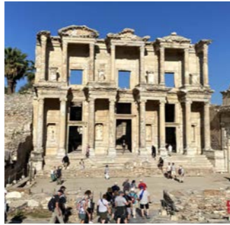
エフェソスの大図書館

古代の世界七不思議のひとつアルテミス神殿を擁し、古代ギリシャの哲学者ヘラクレイトスを輩出、クレオパトラがアントニウスとともに新婚のひとときを過ごした街としても歴史に名を残すエフェソス。街の南を走るメインストリート、クレテス通りには、怪物メデューサやアルテミス女神などのレリーフが施されたハドリアヌス神殿などが並びます。