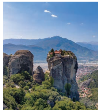
奇岩の上に立つメテオラの修道院(イメージ)

塔のようにそびえ立つ奇岩の上にひっそりと佇む世界遺産、メテオラの修道院群。14～15世紀頃に創建され、今もイコンが壁一面に描かれた聖堂で修道士たちが祈りを捧げながら暮らしています。ギリシャの東方キリスト教文化の粋が脈々と息づくメテオラ。麓の街、カランパカを訪ね、中世の頃と変わらぬ時間の流れを感じていただけます。