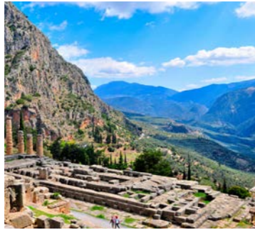
デルフィではアポロン神殿を見学

古代ギリシャにおいて世界の中心と考えられていたデルフィ遺跡。全盛期にはギリシャ国内のみならず、遠く黒海沿岸やイベリア半島からも巡礼者が訪れ、大繁栄しました。38本の見事なドーリア式円柱が残るアポロン神殿を中心とした神域と都市遺構をご覧いただくと、古代の人々の神託にかける熱い思いが伝わってきます。