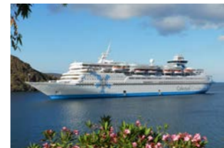
写真は姉妹船のセレスティアル・オリンピア号(イメージ)

今回、ご乗船いただくのは、セレスティアル・クルーズ社によるカジュアルな客船「セレスティアル・ディスカバリー号」です。豪華客船ではございませんが、4泊5日で効率よく島々を巡ります。船室は、海側の13㎡のお部屋をご用意しております。(シャワー・トイレ付き)