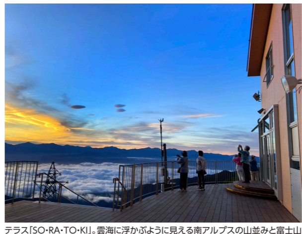
テラス「SO-RA-TO-KI」。雲海に浮かぶように見える南アルプスの山並みと富士山(添乗員撮影)

2023年4月下旬にリニューアルした、千畳敷ロープウェイの終着駅に隣接するホテル千畳敷。中央アルプスの絶景の地、千畳敷カールに位置する日本で唯一無二のホテルです。富士山や南アルプス連峰を望むラウンジや中央アルプスを望む広々としたウッドテラスやレストランなど、千畳敷の滞在がぐっと快適になりました。