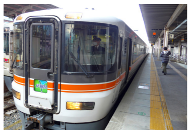
秘境鉄道飯田線は、1日に2本のワイドビュー伊那路に乗車します

鉄道愛好家を選ぶ「日本の秘境駅ランキング」トップ100に、常に10駅程度がノミネートされる秘境駅の多い鉄道、飯田線。天竜川の渓谷を背景に、ポツンポツンと昔ながらの小さな駅舎が現れる様子は、昭和の時代のノスタルジックな鉄道風景を思い出させてくれます。天竜川の渓谷も美しく、乗車中、カメラから手を離すことができないほどです。今回はより車窓から美しい風景がご覧いただけるよう、天竜渓谷側の風景が順光となる午前中の乗車といたしました。車窓から流れゆく絶景をお楽しみください。