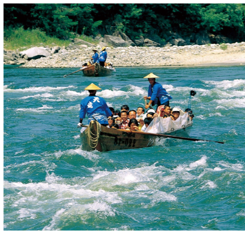
天竜峡の川下りも楽しめます(イメージ)

中央アルプスと南アルプスに囲まれた伊那谷。その中心に位置するのが飯田の町です。この度はこの飯田に宿泊。飯田に古くから伝わる黒田人形浄瑠璃伝承館などを訪問します。また、天竜川の川下りもお楽しみください。