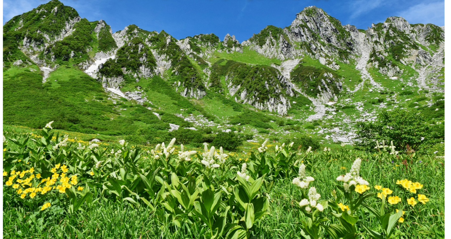
花咲く千畳敷を観光客が訪れる前に散策(イメージ) ※訪れる時期により見られる花は異なります。また自然現象のため、花が咲いていないこともございます。