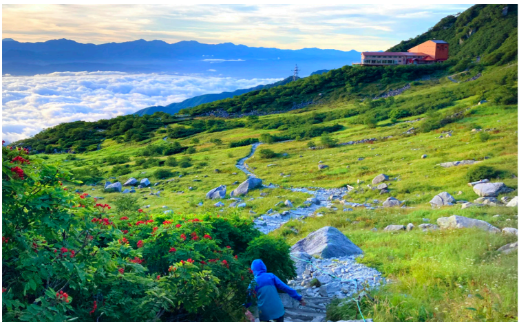
千畳敷カールを早朝散歩。私たち以外に誰もいませんでした。右側奥の建物がホテル千畳敷