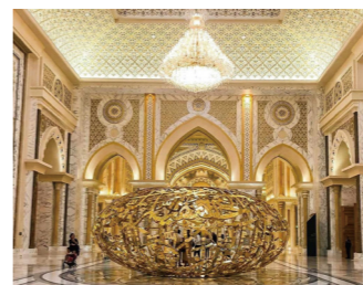
絢爛豪華な装飾が印象的なカスル・アル・ワタンの内部

アラブ首長国連邦の首都アブダビでは、2019年より一般公開が始まった大統領官邸のカスル・アル・ワタンへ。現職の大統領が執務を行う大統領官邸内部を見学できるのは世界にも類を見ない体験でしょう。絢爛豪華な宮殿の内部にはイスラム芸術の粋を集めた装飾の数々があり、特に世界一美しいと称される図書館は必見です。