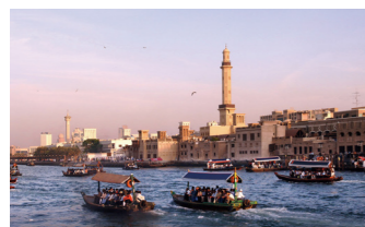
ドバイの伝統的な水上タクシー「アブラ」に乗船

今や世界の最先端都市のイメージが強いドバイですが、オールドドバイの中心バスタキヤ地区には、冷房完備の現代建築とはまるで違う、家々に涼をもたらす風の塔を備えた伝統建築の町並みが保存され、かつての雰囲気を感じています。すぐ近くには昔ながらのスークが残り、スパイスや絨毯を商う店がずらり。伝統的な舟を使った庶民の足アブラの乗船など、これぞアラブという旅情をお楽しみください。