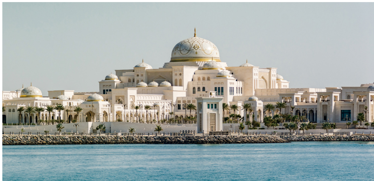
近年入場ができるようになった大統領官邸「カスル・アル・ワタン」