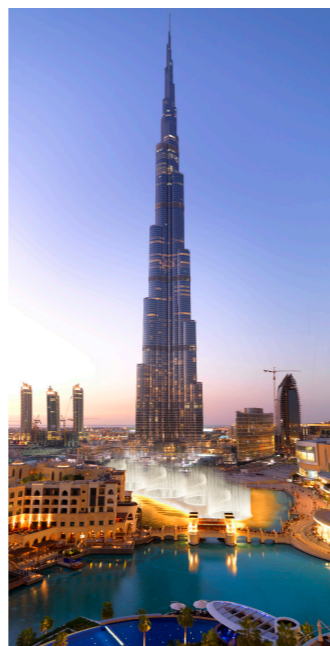
828mの世界最高の人口建造物、ブルジュ・ハリファ（ドバイ・モールにあります）