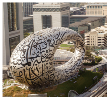
アラビア文字が刻まれた近未来的なデザインの未来博物館