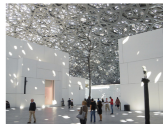
展示品だけではなく、建物自体も特徴的なルーブル・アブダビ

ルーブル美術館やオルセー美術館、ギメ東洋美術館から貸与された珠玉の作品が、現代的な建築美を誇る空間で新しい価値を見せてくれています。ダ・ヴィンチの『ミラノの貴婦人』やモネ、ゴッホなどの有名作品、日本の美術品もかなりレベルが高く、さらに世界史を俯瞰できる出土品なども興味深いものです。