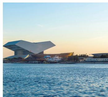
伝統的なコーランの朗読台の形を模したムハンマド・ビン・ラシード図書館

今やドバイの象徴となった206階建てのブルジュ・ハリファ、まるで帆船のようなブルジュ・アル・アラブ、そして世界最大面積の人工島パーム・ジュメイラなど、最先端都市ドバイを訪ねれば、科学技術の進歩と人間のあくなき挑戦を目のあたりします。また、同時に砂漠だった地に勢いよくほとばしる噴水に、砂の国の人々が憧れてやまなかった自然への思いを感じます。このたびのツアーではドバイが誇る建築物やスポットへご案内。高さが150mと世界最大の額縁でもあり、展望台でもあるドバイ・フレーム、コーランの朗読台を模したムハンマド・ビン・ラシード図書館など圧巻の建築群をお楽しみください。