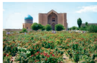
イスラム教の聖地のひとつ、ホージャ・アフメッド・ヤサウイ廟

ホージャ・アフメッド・ヤサウイ廟も訪問。また、唐とアッバース朝が中央アジアの覇権を争った決戦の舞台・タラス河畔や、カラ・ハン朝の王と商人の娘アイシャ・ビビの悲恋伝説が残るアイシャ・ビビ廟なども見どころです。