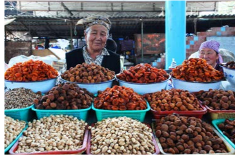
ドライフルーツなどが並び、賑やかなビシュケクのパザール