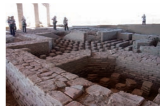
オトラルはティムール終焉の地としても歴史に名を残します