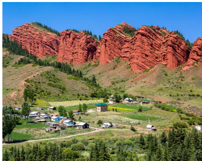
赤茶けた奇岩群がそびえるジェティ・オグスにも足を延ばします

キルギス語で「熱い湖」を意味するイシククル湖は、玄奘三蔵がインドを目指しこの湖畔を通った際、大清水と呼ばれた湖です。南米のチチカカ湖に次ぐ世界第2位の高原湖(1600メートル)で、琵琶湖の約9倍の広さを誇る、10万年以上存在する古代湖でもあります。万年雪を頂いた天山山脈と湖の青、草原の緑のコントラストが美しい季節に、湖畔のリゾート・ホテルに宿泊します。数々の伝説にも彩られる湖畔での滞在をお楽しみください。