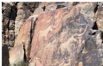
中央アジアで初めて岩絵として世界遺産に登録されたタムガリも訪問。時代ごとに異なる岩絵をご覧いただけます