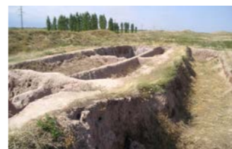
アク・ベシム遺跡