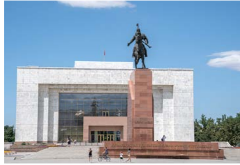
リニューアルしたばかりのビシュケク国立歴史博物館

町の中心アラ・トー広場には千年の昔から語り継がれる勇者マナスの像がそびえます。広場にある国立歴史博物館はソ連時代の1925年に設立、2022年にリニューアルオープンしたばかりです。サカ族の装飾品、突厥の石人など考古学的価値を持つ資料や、民族衣装、遊牧民の移動式住居ユルタ、社会主義時代の遺物などが展示され、キルギスの歴史・文化にふれることができます。