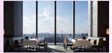
アマン東京のレストラン「アルヴァ」(イメージ)

2024年、創立110周年のアニバーサリーイヤーを迎える宝塚歌劇団。花組の最初の公演は戦時下のパリを舞台とした本物のミュージカル『アルカンシェル』～パリに架かる虹～です。本公演は、2019年から花組トップスターを務める柚香光さんが千秋楽の5月26日をもって退団するという点でも注目を集めています。公演と共に、大手町タワーの最上階に位置する「アマン東京」でのランチもご用意いたしました。優雅なひとときをお楽しみください。