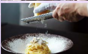
イタリアンレストラン「アルヴァ」(イメージ)