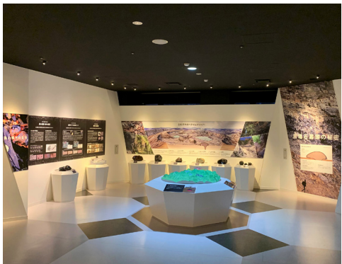
黒や赤茶色に輝く黒曜石が展示されています

年以上前の遺跡から、黒曜石で作られた石器が発見されており、動物を狩るための道具として使用されたり、食器としての役目を果たしていました。また石器やその研磨の技術は北日本各地のみならず、中国やシベリアでも見つかっており、貴重な産地である白滝への人々の往来をうかがわせています。この度、遠軽町埋蔵文化財センターにて、同館職員の解説とともに、新国宝である白滝遺跡の出土品を見学します。