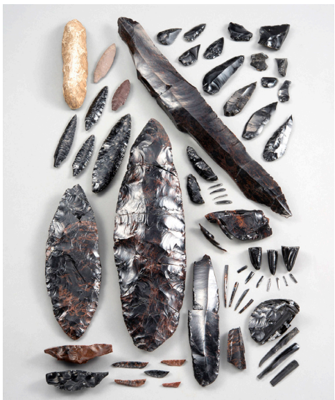
国宝「北海道白滝遺跡出土品」の代表的な石器

黒曜石は、火山の噴火で誕生した天然のガラス。北海道遠軽町白滝地域は、日本で最大規模とされる黒曜石産地で、2023年には白滝遺跡群の出土品が旧石器時代の資料として初の国宝として認定されました。北海道にマンモスゾウが暮らしていた2万