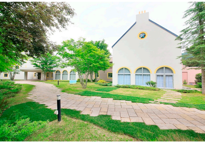
(上)静寂の森に包まれる癒しのリゾートマウレ山荘 (下右)木目を多用した客室(イメージ) (左)マウレ山荘のロビー

遠軽町・丸瀬布(まるせつぷ)は木材が豊富な森の町。幹線道路を離れ山道を上った先に現れるのが北欧の城館を連想させる佇まいのマウレ山荘です。白壁に青色の三角屋根が印象的で、周囲の森に溶け込み、ロビーは優雅なロジのような。全28室の客室は「エゾ・モダン」をコンセプトに快適な設備が整い、地元道東の食材を生かした料理も好評。泉質の良い温泉にゆったり浸かり、湯上りラウンジでくつろぎのひと時をお過ごしください。朝夕に周囲の森の中の散策もお楽しみいただけます。