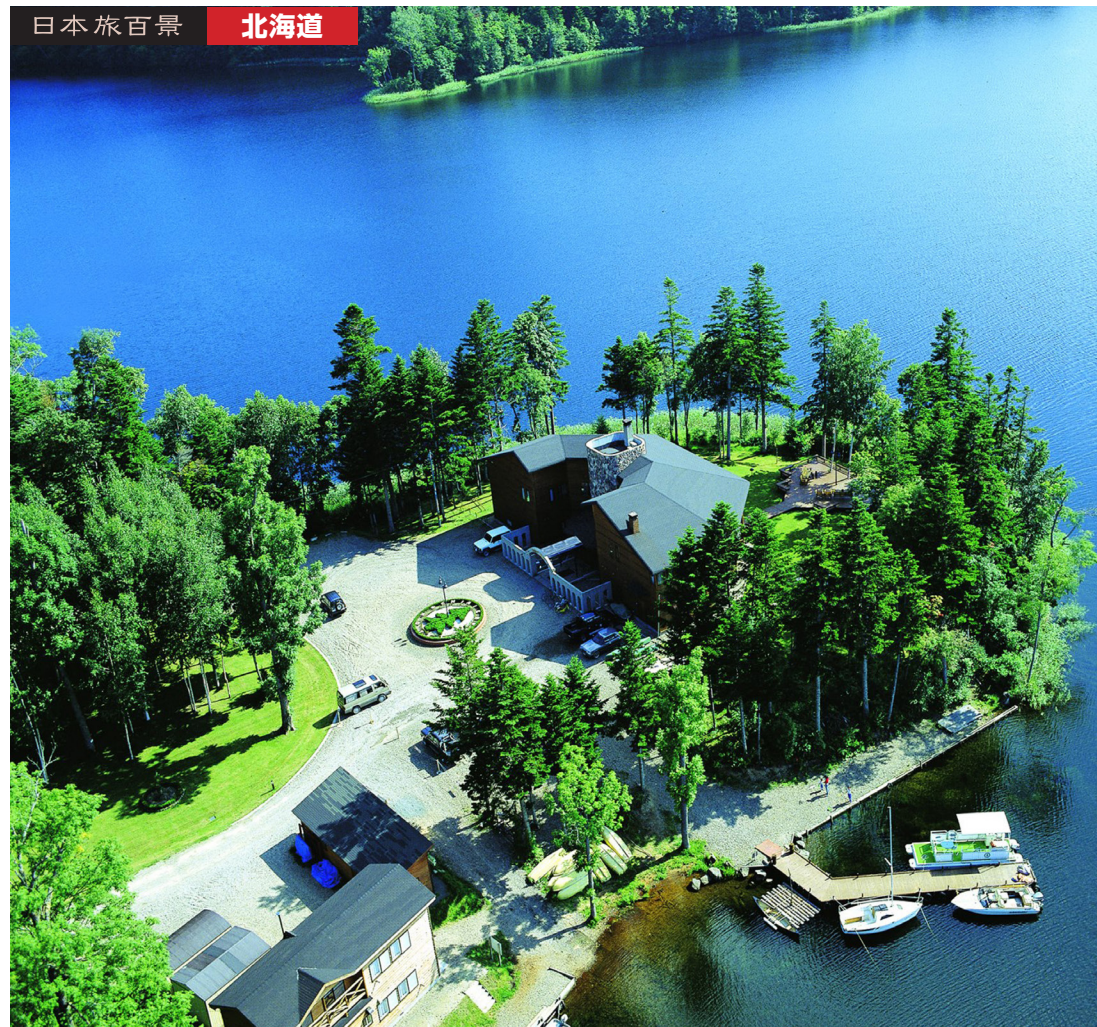
湖畔に佇むチミケップホテル(イメージ)