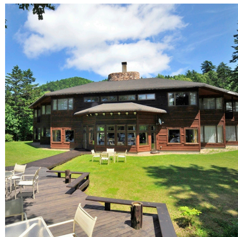
全7室のチミケップホテルを貸切でご案内