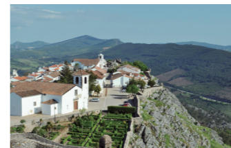
天空の村ともいわれる断崖の上に佇む村マルヴァオン

らしい町」といわれています。また、ポルトガルで最も美しい村にも選ばれた絵になる町モンサラージュも訪ねます。