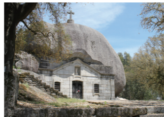
岩を利用した不思議な教会や住宅が残るソウテロ村

た巨大な岩山の麓に建つ、巨岩をまるで帽子のように被った聖母マリア教会などをご案内いただけます。