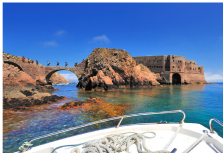
ベルレング島(イメージ)

「絶景の塞」、サン・ジョアン・バプティスタ要塞(上の大きな写真)をご覧ください。 (1日限定340名まで)