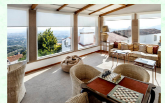
ロビーラウンジからの眺望がおすすめです

天空の村と呼ばれるマルヴァオンの村の中心にあるポサダ。一歩外に出ると中世の佇まいが残る村を気軽に散策することができます。そして最大の魅力はラウンジやレストランからの絶景。アレンテージョ平野の眺望をゆっくり満喫ください。