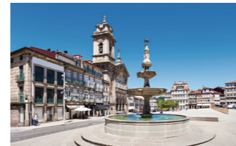
建国当時の面影を残す世界遺産都市ギマランイス