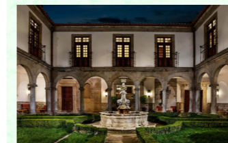
ポサダの趣ある中庭

12世紀の修道院を改修したポサダで、歴史ある雰囲気を残しながらも快適さも重視して、国の建築賞を受賞しています。旧市街を見下ろす丘の上に建っているため、ポサダの敷地内から朝夕の景色もお楽しみいただけます。