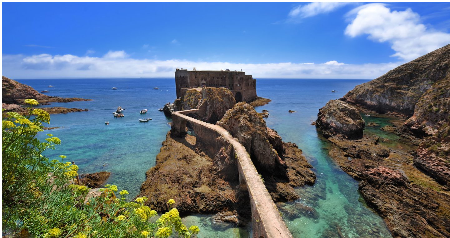
入り江から岩までアーチ状の橋がかかり、島の風景と美しく溶け込むサン・ジョアン・バプティスタ要塞（イメージ）