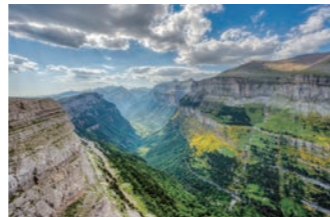
氷河によって造られたオルデサ国立公園。雄大な景観をお楽しみください（イメージ）

標高700メートルから3000メートルにも及び大渓谷には何千年もの長い年月をかけて形成された氷河谷が広がり、迫力ある大絶景がご覧いただけます。このオルデサ渓谷の谷底を歩くハイキングへご案内します（往復3時間弱）。