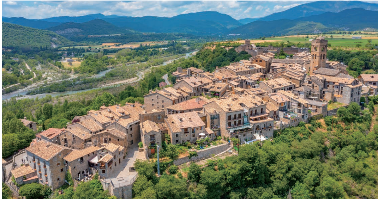
【山麓の村を探訪】ピレネー山麓に点在する美しい村々をつぶさに訪ねます 中世そのままの街並みを残すアインサは、「スペインの最も美しい村」認定の町（イメージ）