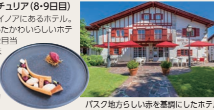
バスク地方らしい赤を基調にしたホテル