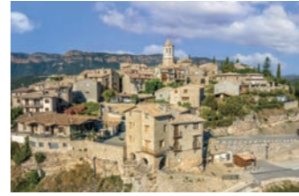
ロダ・デイサベナ 大聖堂を中心としてスペイン一小さな村とも紹介されます

えた歴史を持ちます。「スペインの最も美しい村」のひとつで、この大聖堂をひと目見ようと観光客がやってきます。