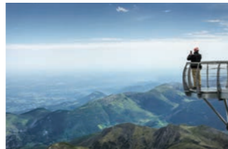
ピック・デュ・ミディ展望台から望むピレネー山脈（イメージ）

スペイン側からピレネー山脈の峠を越え、ロープウェイに乗って、ピレネー最高峰の海拔2877メートルに位置するピック・デュ・ミディ展望台へ。まるで果てしなく続くかのようなピレネーの美しい山並みが眼下に広がります。