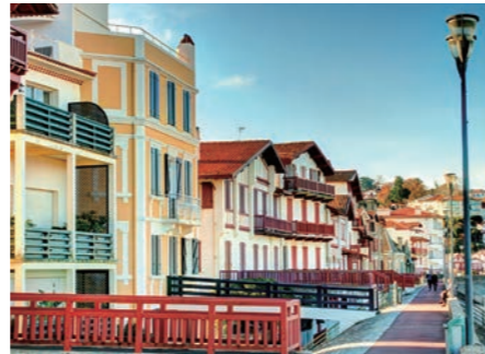
カラフルな家並みが可愛いサンジャンドリユス