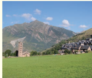
ボイ谷にある世界遺産登録のロマネスク教会サン・クレメント教会とタウル村