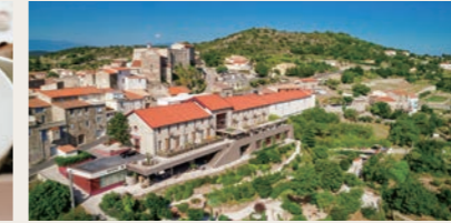
地元産食材にこだわったメニュー（左・イメージ）、景観も美しい人気のワイナリーホテル

■カンフランク：カンフランク・エスタシオン・ロイヤル・ハイダウェイ・ホテル（7日目） 今シーズン新たにツアーに取り入れた、2022年にオープンした山間のホテル。写真からその前身をご想像いただけるかもしれませんが、なんと鉄道駅が豪華ホテルに生まれ変わりました。1928年に鉄道駅は落成を見ましたが、フランコ体制の下、10年余りで路線は閉鎖され、放置されたままでした。2013年にアラゴ州政府が買い取り、4年の改修工事を経て見事に蘇りました。（※シャワーのみの客室となります。）