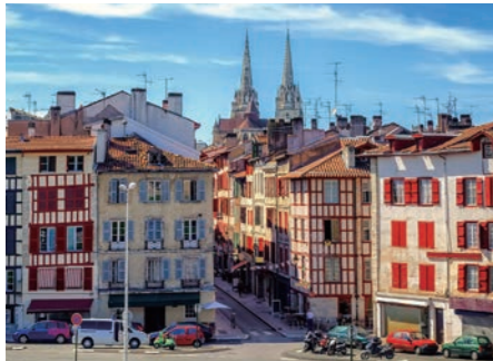
フレンチバスクの町バイオンヌ。チョコレートが有名な町でお土産にぜひどうぞ