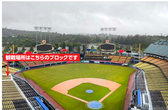
観戦場所はこちらのブロックです

あの「二刀流」選手と野球日本代表のエースが今シーズンからそろって移籍し、話題のロサンゼルス・D。この目で見たい!と思う皆様へ、朗報です。本拠地「ドジャー・スタジアム」での2試合観戦を組み込んだ、野球ファン垂涎のツアーを発表します。本場でしか味わうことの出来ない臨場感と興奮をお楽しみください。またスタジアムまでの往復移動は、ミニバスをご用意しました。試合開始前に写真を撮ったり、チームストアでお買い物を楽しんだり、時間に余裕をもってスタジアムへご案内します。