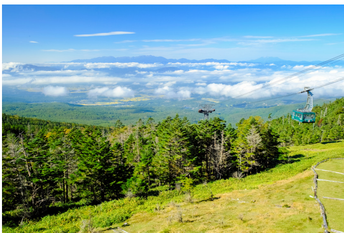
北八ヶ岳ロープウェイ山頂駅からの展望(イメージ)

設された展望デッキ・スカイアイ2237からの日本アルプスの絶景をお楽しみください。もう一つは、「車山高原展望リフト」。2本の4人乗りリフトを乗り継ぐと、標高