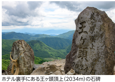
ホテル裏手にある王ヶ頭頂上(2034m)の石碑

美ヶ原の最高峰、標高2034メートルの王ヶ頭に建つ王ヶ頭ホテルは、ホテル立山や千畳敷ホテルに並ぶ山岳ホテルとして絶大な人気を誇ります。特筆すべきはその眺望で、美ヶ原の最高峰に位置するため、北アルプス、南アルプス、八ヶ岳から富士山まで、四方の山々を望むことができます。また、天候によっては眼下に雲海も楽しむため「雲上のリゾート」とも呼ばれています。八ヶ岳方面からのぼるご来光、北アルプスに沈む夕日、朝夕は山々が赤く染まる風景など、滞在中は時間ごとに刻々と変化する絶景に飽きることがありません。美しい山並みを楽しみながら展望風呂にゆっくりと浸かるのもホテル滞在の醍醐味です。(ホテルからの眺望は天候により左右されますので予めご了承ください)