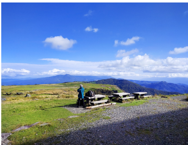
ホテルの玄関前には美しい美ヶ原の風景が広がります(イメージ)

王ヶ頭とは山の名称で、美ヶ原高原の最高峰、標高2034mです。ホテルの裏手の小高い丘には、「美ヶ原頂上 王ヶ頭」の石碑があり、夕日のスポットとなっています