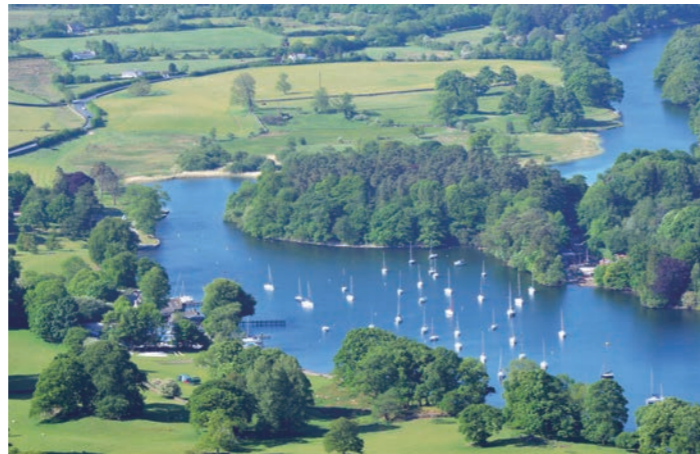
ウィングミア 湖水地方の眺望 英国人に愛される水辺の景色が広がります(イメージ)

過ごしいたできます。さらにゆとりの日程をいかし、通常のコースではなかなか訪れない、湖水地方北部の珠玉の町ケズィックも訪問。700年以上の歴史を持つ町の中心、マーケットスクエアを訪ね、湖上に浮かぶ島々が風景にアクセントを添えるダーウエント湖畔を散策。湖水地方の自然美やキャッスルリッグ・ストーンサークルといった古代遺跡もご覧いただけます。