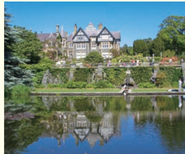
広大な敷地を誇るボドナント・ガーデン