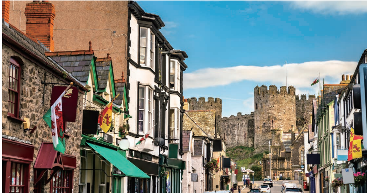
かわいらしい家並みの先にランドマークのコンウィ城がどっしりとかまえます