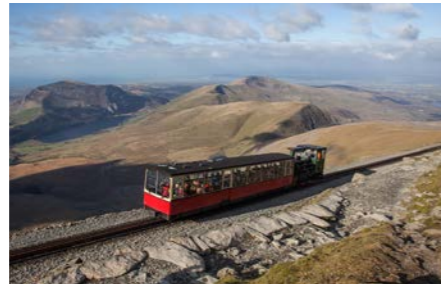
レトロなスノードニア登山鉄道に乗って雄大なウェールズの風景をご覧ください(イメージ)

丘陵地帯が広がるイギリスの中で、ウェールズは大部分が山地です。スノードニア国立公園にはウェールズの豊かな自然が広がり、スノードン山がそびえています。このウェールズ最高峰へは登山鉄道が走っています。1894年に歴史を遡る英国の保存鉄道のひとつです。ツアーではこの鉄道に乗って1085メートルの山頂駅を目指し、ウェールズのパノラマを一望いただけます。