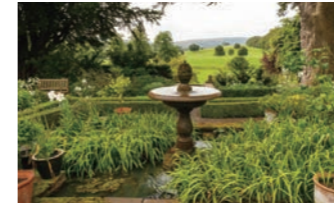
ダルメイン庭園を訪ねます