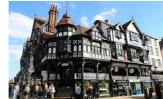
ハーフティンバーの建物が残るチェスター