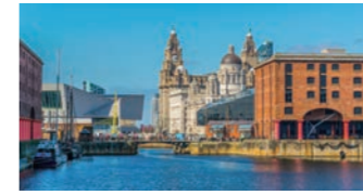
リバプールのアルバートドック

昔の輝きを取り戻し、新たな見どころも生まれております。宗派の異なる2つの大聖堂や港の散策など、歴史ある街並みをお楽しみください。