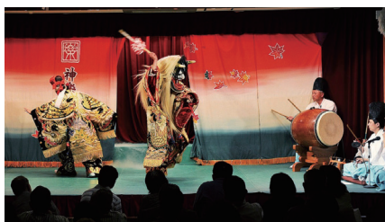
スピード感のある演出と圧倒的な演劇性が人気 (イメージ)

広島県の中央に位置する安芸高田市には江戸時代に出雲流の神楽が石見を経て伝わったとされる、ひろしま安芸高田神楽の伝統が残ります。日本各地に様々な神楽が伝えられている中で、ひろしま安芸高田神楽は演劇性が強いという点が特徴です。素早いアクションや華麗な演出で見る者を魅了します。