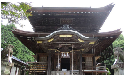
花岡八幡宮

歴史を物語る貴重な文化財が残っています。大分県の宇佐八幡宮の分霊を祀る花岡八幡宮は、709年から続く由緒ある神社です。日本一の長さを誇る大太刀「破邪の御太刀(はじゃのおんたち)」が奉納されています。普段は非公開となっていますが、今回は特別にご覧いただけます。