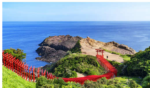
元乃隅神社(イメージ)

日本海に臨む元乃隅神社は、2015年にアメリカのCNNの「日本の最も美しいスポット31選」に選ばれ、世界中から観光客を集める新しい名所になりました。123基の鳥居がずらりと並び、鳥居の朱と日本海の澄んだ青のコントラストが見事です。