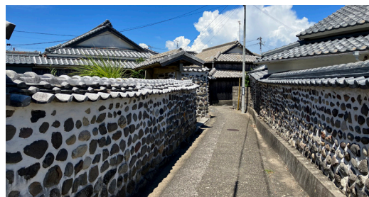
祝島独特の練堀