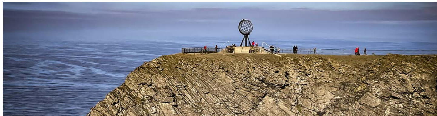
ヨーロッパ最北端の岬ノールカップ 地の果てを実感してください(イメージ)