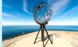
ヨーロッパ最北端。北極海にせり出す大迫力のノールカップ岬