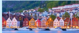
白夜の時期の真夜中はこの明るさ(イメージ)

6月上旬から7月下旬までの北極圏は、白夜の季節を迎えます。見渡す限り続く水平線の上を太陽がなぞるように進み、深夜でも太陽が沈むことはありません。真夜中の太陽が照らす北極圏ならではの景色は幻想的で、長い間朝焼けや夕暮れのような時間が続きます。この季節に合わせて設定した沿岸急行船の旅で、神秘的な自然現象をお楽しみください。※8月13日出発は、22～23時頃に日没を迎えます。