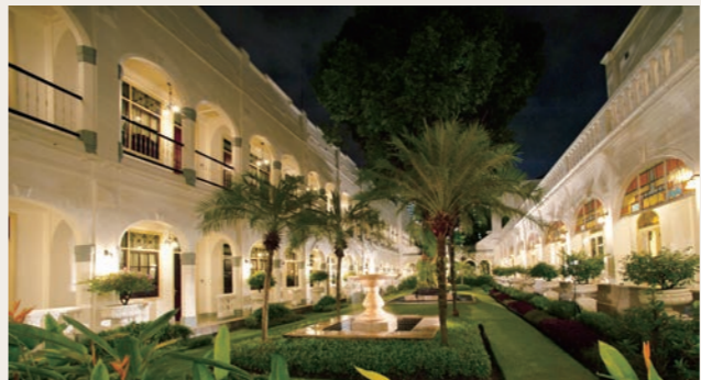
マジャパヒト・スラバヤの美しい中庭

1910年創業、ジャワ島を代表する名門コロニアルホテルです。かつて日本統治時代は大和ホテルと呼ばれていました。市内中心部にありながら、芝生の美しい中庭があり、クラシックな洋館風の白い建物は歴史を感じさせます。客室は品のあるインテリアが据え付けられ、高級感の漂うデザインです。スラバヤの町の喧噪をしばし忘れ、優雅で歴史のあるコロニアルホテルの雰囲気浸っていただけることでしょう。