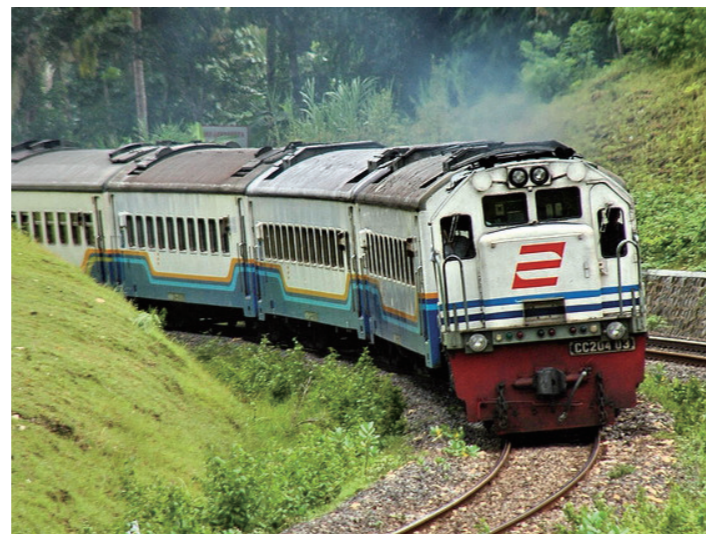
ジャワ鉄道。新緑のシーズンの棚田、ジャングルなどのジャワ島らしい景色をお楽しみください