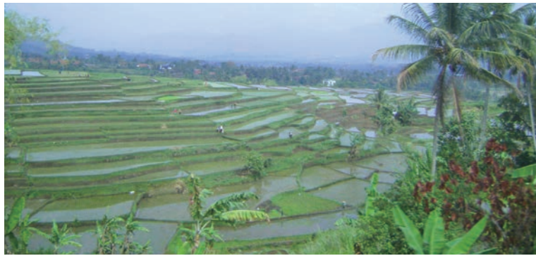
車窓からはインドネシアの様々な風景をご覧いただけます(添乗員撮影・イメージ)