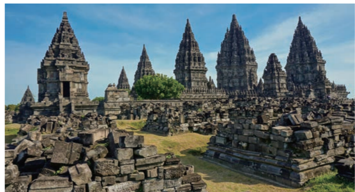
プランバナン遺跡 高さ47メートルのシヴァ聖堂や、ヴィシュヌ聖堂、ブラフマー聖堂が並びます