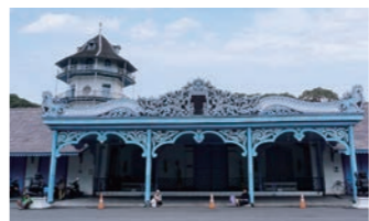
古都ソロにあるカスナナン王宮

ヌの3神が祭られた神殿からは、ヒンドゥー教の世界観を見ることができ、ラーマヤナをかたどったレリーフにもご注目ください。