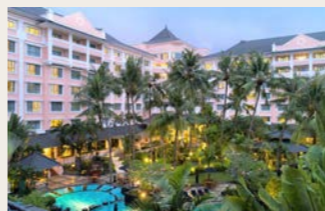
メリヤ・プロサニ・ホテル外観