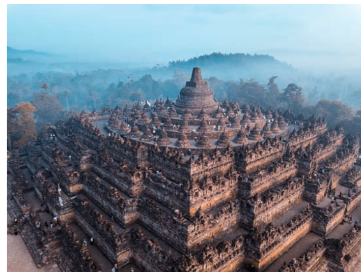
世界遺産、ポロブドゥール遺跡

ジョグジャカルタからは、世界遺産としたストウパ(仏塔)は、それ自体ポロブドゥール遺跡も訪ねます。8が仏教の宇宙観を体現したものと云世後半から9世紀半ばにかけて建わられています。設されたと考えられ、独特の形状を