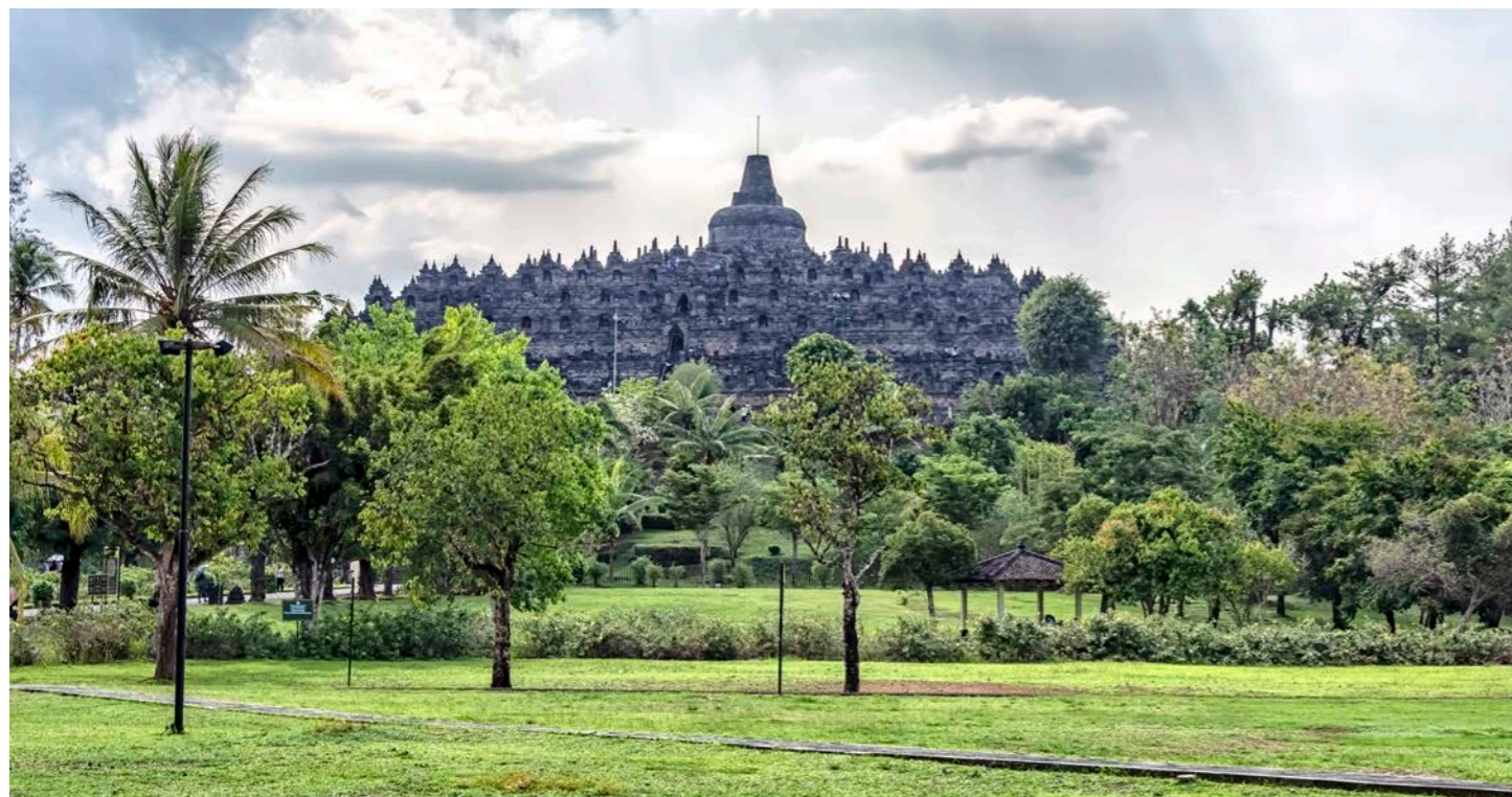
アジア3大遺跡のひとつ、ポロブドゥール