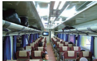
特急の一等車 車内