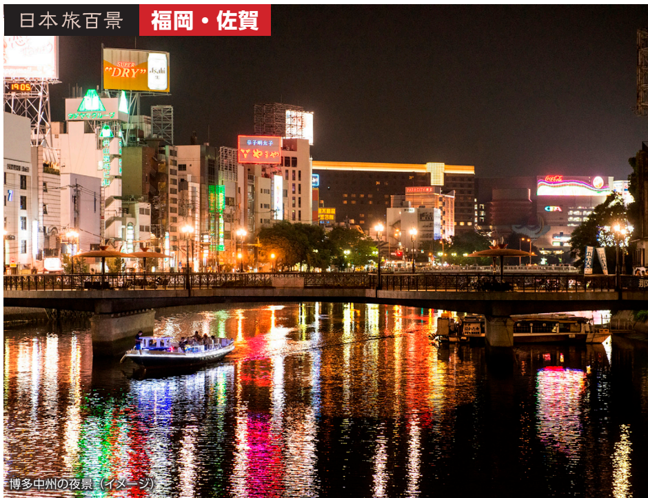
博多中州の夜景（イメージ）