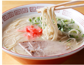
「博多ラーメン」(イメージ)

玄界灘の新鮮なネタで握った寿司やぶりっぷりのもつ鍋、コラーゲンたっぷりの水炊き、酒の肴に胡麻鯖といった定番料理から、とんこつラーメンや鉄鍋餃子といったB級グルメに至るまで、福岡・博多には魅力的な食事処が目白押しです。もちろん、博多グルメを取り入れたお食事ツアーに組み込んでいますが、昼1回・夕2回の自由食を設け、お好みの食事を楽しむ機会といたしました。ご希望のお客様は、添乗員がご案内します。