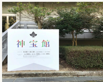
宗像大社辺津宮 神宝館