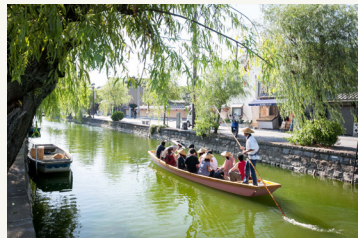
船上からのんびりと柳川の景色を楽しみます ©九州観光推進機構（イメージ）

三方を山に囲まれた秋月は、秋月氏が16代、近世になって黒田氏が12代と城下町として治めた歴史を持ちます。町全体が国の重要伝統的建造物群保存地区に指定されています。また、柳川藩の城下町として栄えた柳川ではのんびりと川下りをお楽しみください。柳川ゆかりの詩人・北原白秋ゆかりの地へもご案内いたします。