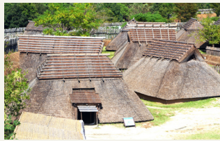
吉野ヶ里遺跡 (イメージ)

紀元前5世紀から紀元後3世紀までの弥生時代、日本では稲作文化が始まり、定住生活が根付きました。その時代の都市遺跡が吉野ヶ里です。弥生時代における「クニ」の中心的な集落であり、邪馬台国をはじめとする日本の古代史を解き明かす上で貴重な遺跡です。