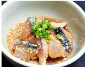
博多の胡麻鯖(イメージ)