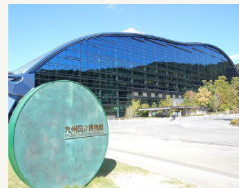
九州国立博物館