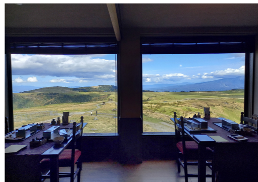
王ヶ頭ホテル、レストランからの眺望(イメージ)

美ヶ原の最高峰、標高2034メートルの王ヶ頭に建つ王ヶ頭ホテルは、ホテル立山や千畳敷ホテルに並ぶ山岳ホテルとして絶大な人気を誇ります。1951年に避難小屋を兼ねた「王ヶ頭ヒュッテ」としてオープン。現在は山上にあって設備の整った客室、質の高い料理、展望風呂やスパと、ホテルのレベルの高さから全国にファンを持ち、予約困難なホテルとしても知られています。ホテル設備もさることながら、特質すべきはその眺望です。美ヶ原の最高峰に位置するため、北アルプス、南アルプス、八ヶ岳から富士山まで、四方の山々を望むことができます。また、天候によっては眼下に雲海も楽しめるため「雲上のリゾート」とも呼ばれています。