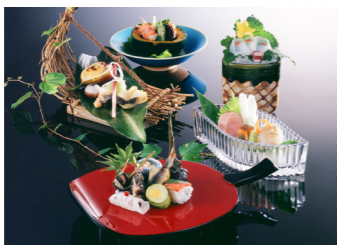
料理の一例(イメージ)