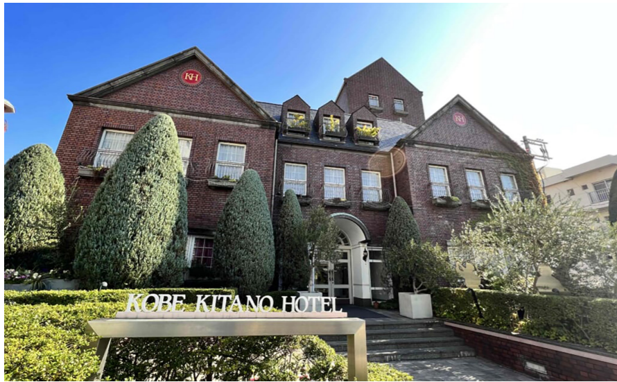
神戸北野ホテル外観