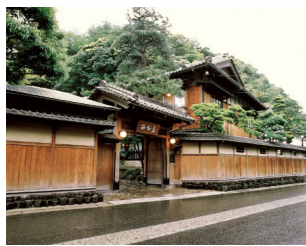
有形文化財に指定される西村屋本館

1300年前から温泉地として賑わい、志賀直哉や与謝野晶子などの文人墨客にも愛された山陰随一の温泉地・城崎温泉。その中ほどに西村屋本館があります。創業は江戸安政年間。160年の歴史を持つ純日本旅館もまた、世界最高基準のルレ・エ・シャトーに加盟する宿です。宿泊とともに楽しむのは「美しい季節をいただく」という心で提供される、西村屋の料理。但馬の自然が育んだ四季折々の食材を使い、その季節だけの厳選された旬の恵みでまとめられます。温泉地城崎の散策とともに上質な滞在をお楽しみください。