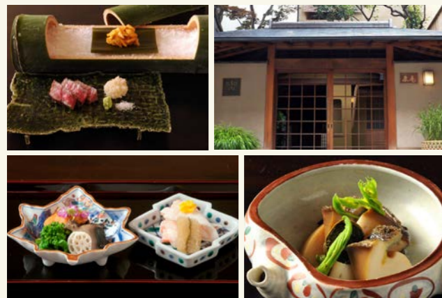
料理写真はイメージです