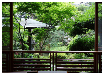
庭の緑も美しい季節です