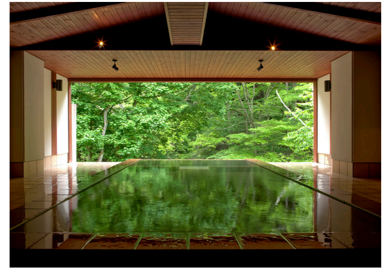
明神館 立ち湯「雪月花」(イメージ)