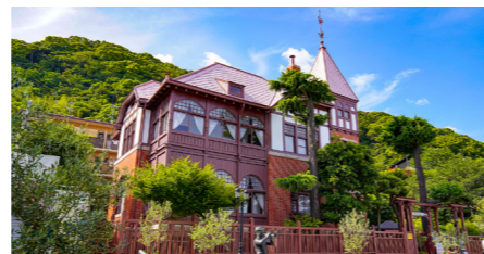
北野異人館街 風見鶏の館

「神戸北野ホテル」にほど近い、北野異人館街の散策にご案内します。1868年に開港後、外国人居留地とされ、今も20を越す洋館が立ち並ぶエリアで、神戸の中でもとくに異国情緒を感じられる場所です。周辺もおしゃれなお店やカフェなどが並びますので、「世界一の朝食」をお召し上がりになった後、散策をお楽しみください。