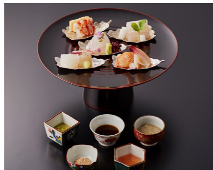
見た目も美しい料理(イメージ)