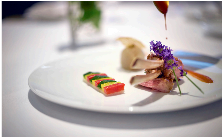
オトワレストラン料理(イメージ)