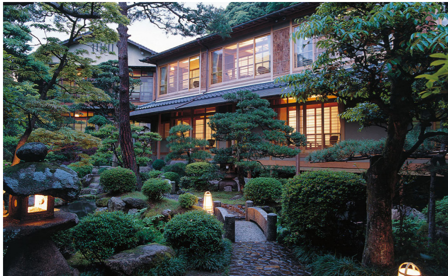
西村屋本館(イメージ)