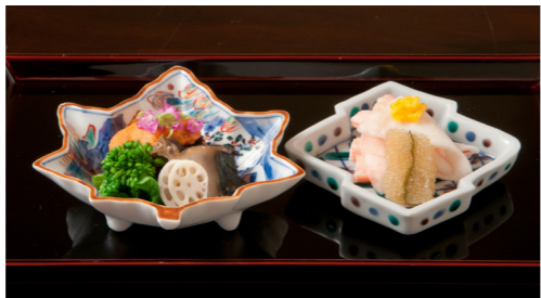
料理、宿ともに京の真髄を感じることができます(料理イメージ)

ています。「要庵西富家」の懐石は、茶道に縁ある、機会の機、季節の季、器の器という「キ・キ・キ」の心で食材と向き合い「要庵西富家らしさ」を大切に驚きやストーリー、粋、洒落が盛り込まれています。