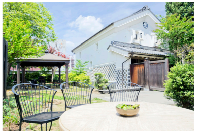
蔵を改装したヒカリヤ ニシ