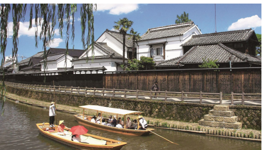
巴波川沿いに重厚な白壁の土蔵群が残る町並み(イメージ)

日光街道の宿場町として、また、江戸との舟運で栄えた問屋町として栄えた蔵の町・栃木。町を流れる巴波川(うずまがわ)の岸辺や町の中心部には、現在でも重厚な白壁の土蔵群などが残ります。