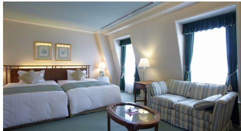
落ち着いた内装の客室(イメージ)

神戸北野ホテルは、その思いをコンセプトに生まれたオーベルジュ（宿泊施設付きレストラン）です。「食を楽しむ」お客様のために用意された客室数は僅か30室。御食国の淡路はじめ兵庫五国の厳選素材の味わいを際限なく引き出したフランス料理とともに、お客様一人ひとりにきめ細やかなおもてなしができるよう造られた小規模なホテルです。その食とホスピタリティのレベルの高さから、日本にわずか13軒の「ルレ・エ・シャトー」加盟ホテルに選ばれています。ホテルの代名詞である「世界一の朝食」をはじめ、予約限定のプレミアムアフタヌーンティーやレストラン「アッシュ」でのフレンチディナーと、存分に食をお楽しみいただける内容といたしました。