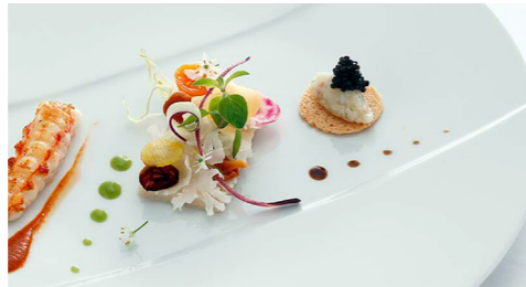
ホテルレストラン「アッシュ」のフレンチ(イメージ)