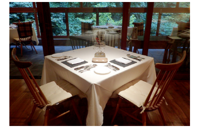
ナチュラルフレンチ菓(イメージ)

「泊まってみたい憧れの宿」で常に上位にランキングする「扉温泉 明神館」。純和風の屋号ながら、和モダンの中にフレンチレストランやラウンジ、サロンやスパなどヨーロッパ的な雰囲気も兼ね備え、それが見事に調和しています。二間に分かれたゆったりとした客室もさることながら、食や温泉、全てで宿泊者を魅了して止まない宿。特に温泉は露天風呂付き大浴場・立ち湯・寝湯の3つがあり、趣の異なる風情を1日楽しむことができます。