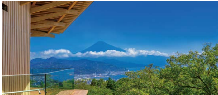
日本平夢テラスからの景色(イメージ)

清水寄港の際は、富士山とともに世界遺産に登録された景勝の地、三保松原へ。三保半島に延びる長い松原からは駿河湾と富士山が同時に眺められる絶景の地として古くから親しまれてきました。天女と地元の漁師との出会いを描いた羽衣伝説でも知られています。また2018年、日本平の新たなシンボルとして隈研吾事務所設計のもと建てられた日本平夢テラスも訪れます。