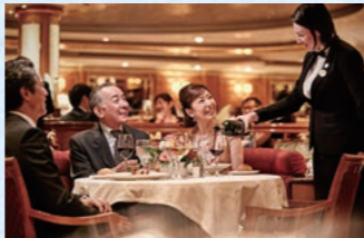
メイン・ダイニング(イメージ)