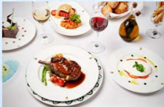
サバティエニのイタリアンをお楽しみください(イメージ)

気軽にお楽しみいただける5カ所のメイン・ダイニングの他、ピュッフェやピッツェリア、アイスクリームバー、そして幾つものスペシャリティ・レストランが船内にあり、充実した食事をお楽しみいただくことができます。スペシャリティ・レストランの中でも人気なのが、イタリア・スカーナの正統派トラットリアの雰囲気満載できる「サバティエニ」です。今回は、本来別途予約、追加料金が必要なこのレストランでのお食事をあらかじめツアーに組み込んでご案内します。