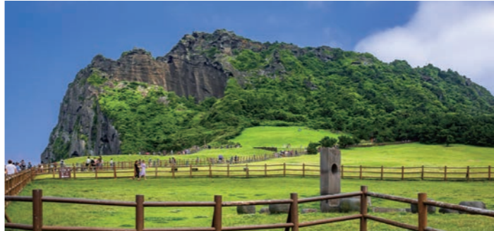
濟州島東側にそびえる、海底噴火によって生まれた城山日出峰

濟州島は火山活動によって形成された島で、ユネスコの世界遺産に登録されています。東シナ海に浮かび、比較的温暖なことからリゾートとして紹介されますが、中心部にそびえる韓国最高峰のハルル山をはじめ、数々の山が島を彩るなど自然の景勝に恵まれています。大きな噴火口が残る休火山、城山日出峰(ソサンシルチュルボン)などにご案内します。