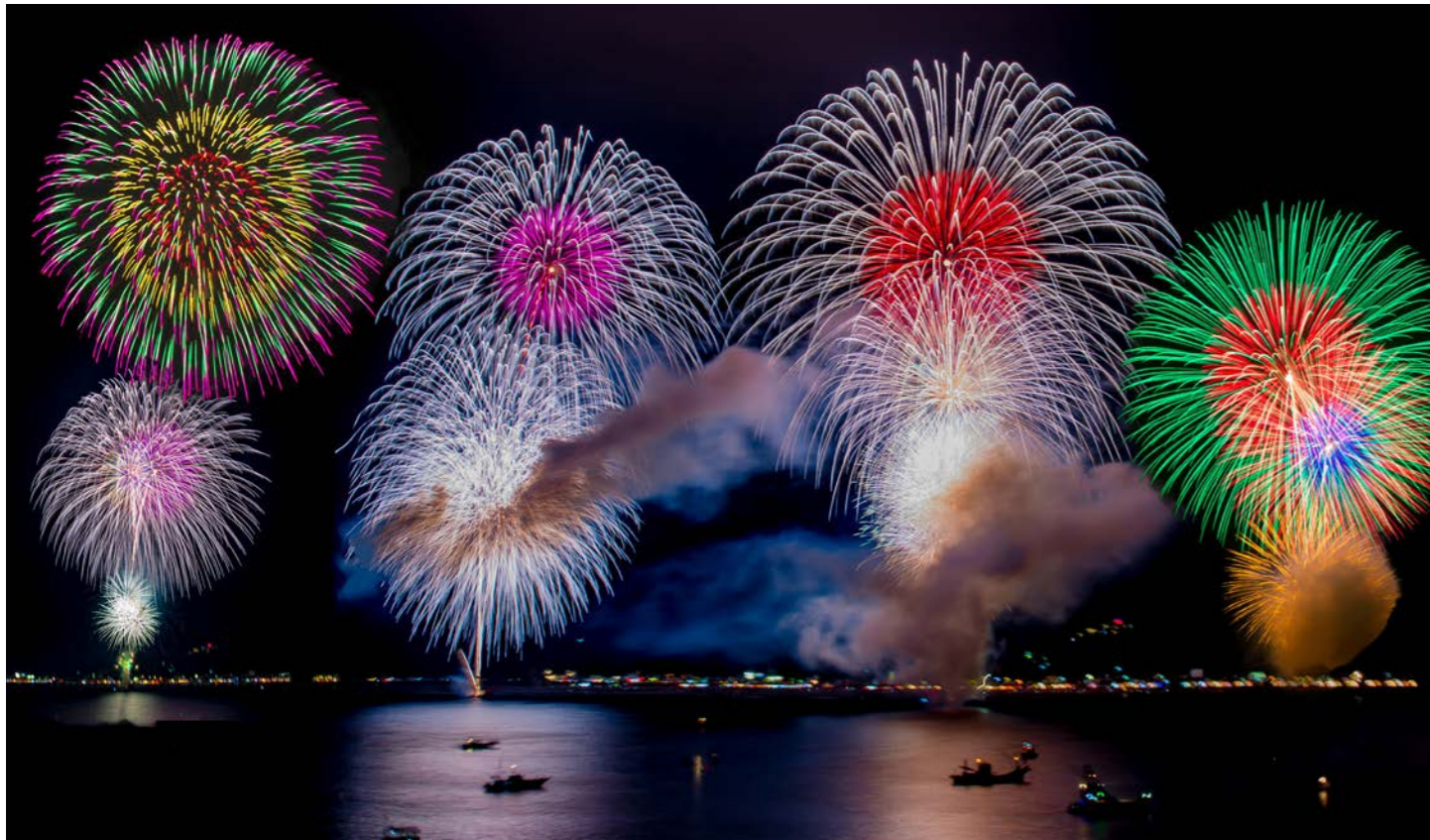
リピーターも多い熊野大花火。船上からゆっくりご覧いただくことができます（イメージ）