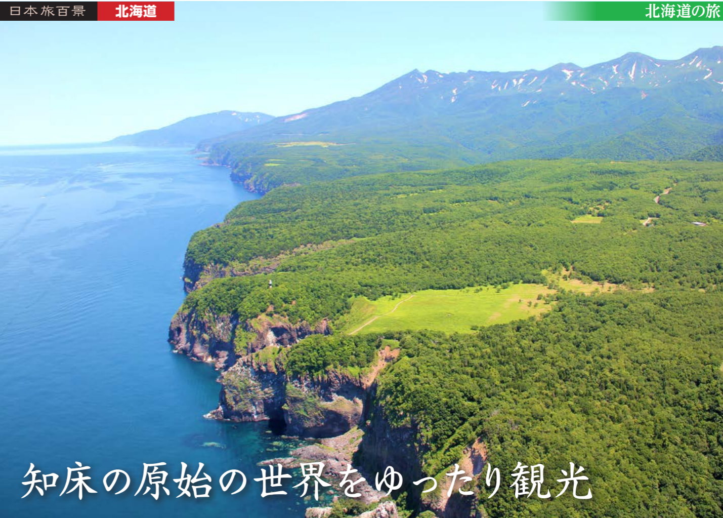
断崖絶壁の海岸線が続く知床半島(イメージ)