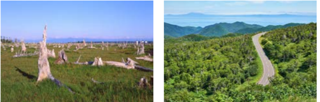
この世の果てを思わせる光景 トドワラ(イメージ) 知床横断道路を走りウトロから羅臼へ(イメージ)