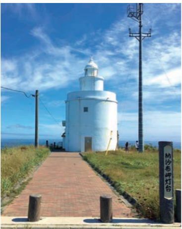
明治政府によって建てられた北海道最古の洋式灯台

納沙布岬からは、晴れた日には北方領土の歯舞群島が間に望め、一番近い場所にある貝殻島まではなんと3・7kmという近さ。すぐ近くにある北方領土資料館では、戦前の北方四島の生活に関する資料やパネルが展示され、その歴史や当時の島の暮らしぶりを今に伝えます。