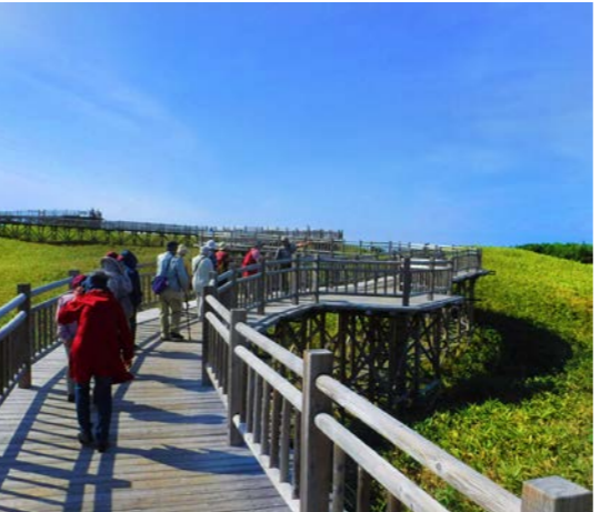
知床一湖まで続く高架木道(イメージ)

車では入ることのできない知床岬。世界遺産にも登録され、今もなお人々の開拓をまねがれている手つかずの自然と、火山活動やプレート運動によりできた珍しい地形が残されています。知床の拠点でもあるウトロに2泊し、世界遺産の絶景を様々な角度からご案内します。