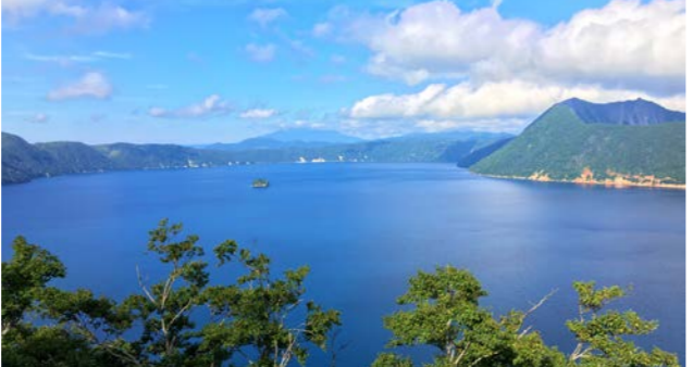
世界2位の透明度を誇る摩周湖(イメージ)