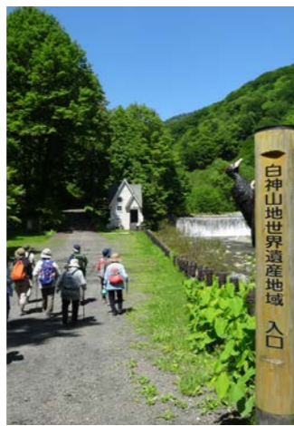
白神山地暗門地区ブナ林散策道(イメージ)

■最少催行人員: 10名様 ■食事: 朝食3回、昼食2回、夕食3回 ■添乗員: 東京駅ご出発時から東京駅ご到着時まで同行します。 ■ホテル: 白神山地/アオーネ白神十二湖(和室)、弘前/アートホテル弘前シティ(洋室) ■利用予定バス会社: 弘前バスまたは同乗クラス ■利用交通機関: 東北・秋田新幹線(普通車指定席)、リゾートしらかみ(普通車指定席)