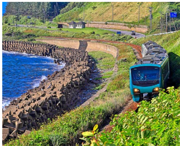
日本海岸を走るリゾートしらかみ(イメージ)

面した深浦から鱈ヶ沢(あじがさわ)への海岸線の道は、日本海を望む東北屈指の景勝ルートとして知られています。緑の美しい行合崎(ゆきあいざき)や、荒々しい巨岩が並ぶ千畳敷に立ち寄りながら、津軽地方を目指します。途中、鱈ヶ沢では、名物のヒラメ丼もご用意しました。日本海の味覚をお楽しみください。