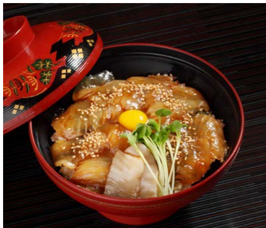
鱈ヶ沢では名物のヒラメの漬け丼を(イメージ)