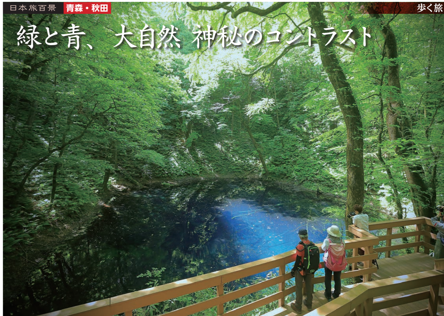
神秘的なコバルトブルーの湖面を温める十二湖青池(イメージ)

木々の息吹を感じる 世界遺産の森を訪ねて 青森県南西部から秋田県の北西部にかけて広がる白神山地。人の開発の影響をほとんど受けていない原生的なブナ天然林が13万ヘクタールもの世界最大級の規模で分布していることから、その価値を認められ、1993年にユネスコ世界自然遺産に登録されました。ツアーでは白神山地に2連泊し、この貴重な森を訪ねます。白神十二湖ハイキングでは、十二湖の中でも最も美しいコバルトブルーの湖面が見られるという青池にご案内します。また、弘前に宿泊して、白神山地の北の玄関口である、暗門地区からも美しいブナ林へアプローチ。2つの異なる地点から白神山地の自然に存分にふれていただきます。 白神山地では十二湖に最も近いホテルに連泊し青池をガイドと散策 広大な面積を誇る白神山地の中でも、最も人気の高い散策スポットが白神山地の麓に広がる十二湖地区です。33の湖沼から成りますが、小さな池はブナ林の森に隠れ、12の大きな池が見えることからその名が付けられました。 秋田からはリゾートしらかみに乗車し、十二湖へ。一度は乗ってみたいローカル線として人気の高い五能線の旅をお楽しみください。3日目は十二湖を離れ、日本海沿岸をバスで走り弘前へと向かいます。日本海に ました。ツアーでは、十二湖地区に最も近いホテル「アオーネ白神十二湖」に連泊し、ネイチャーガイドとともにゆっくり歩きながら、青池をはじめ白神の美しい自然をお楽しみいただきます(約2時間)。 アオーネ白神十二湖