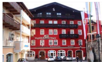
真っ赤な外壁に白馬とオペレッタの楽譜が描かれた可愛らしい外観

ヴォルフガング湖に面した1878年創業の歴史あるホテル「白馬亭」。オーストリアで活躍した作曲家ラルフ・ベナツキーのオペレッタ「白馬亭にて」は、このホテルが舞台となりました。