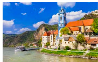
中世の街並みを見事に残すデュルンシュタイン

南ドイツ・シュヴァルツヴァルトに端を発し、ヨーロッパ10カ国以上に跨って黒海へ注ぐ全長2860kmの大河ドナウ。中でもメルク〜クレムス間のわずか36kmの「ヴァッハウ渓谷」は、ブドウ畑や河岸に建つ修道院や古城、そして中世からの町々が織り成す類まれな景観は世界文化遺産に登録されています。メルクからデュルンシュ