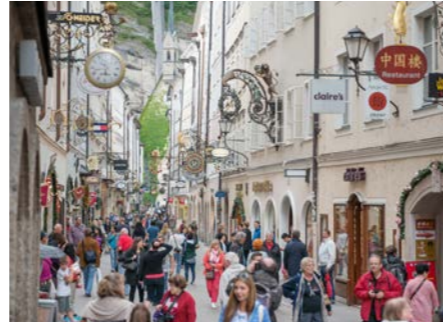
人々で賑わう目抜き通りゲトライデガッセ。一目で何のお店かが分かるように突き出した看板が連なります