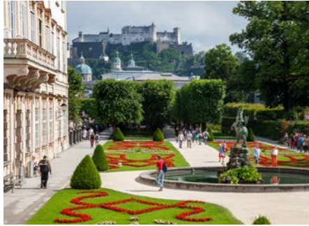
映画「サウンド・オブ・ミュージック」でドレミの歌が撮影されたミラベル庭園。