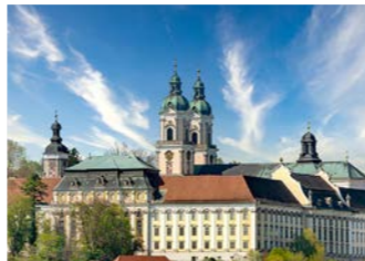
ザンクト・フローリアン修道院

※5/28発は、修道院の都合によりミニコンサートをお聞きいただくことができません。代替として、修道院の見学後、リンツ郊外アンスフェルデンにあるブルックナーの生家(記念館)へご案内します。予めご了承ください。