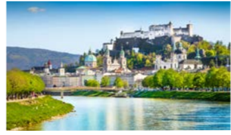
断崖絶壁の上に築かれたザルツブルク城を背景にした美しい街並み

17～18世紀の大司教が都市計画を進めた街ザルツブルク。その権威を表す絢爛豪華なバロック様式の建築や庭園が華やかな街並みを造っています。ヨーロッパ有数の美しさを誇るザルツブルク大聖堂ではモーツァルトが洗礼を受け、指揮者カラヤンの葬儀もここで行われました。お店が建ち並び旧市街のメイン通りグトライデ・ガッセの散策も楽しみ