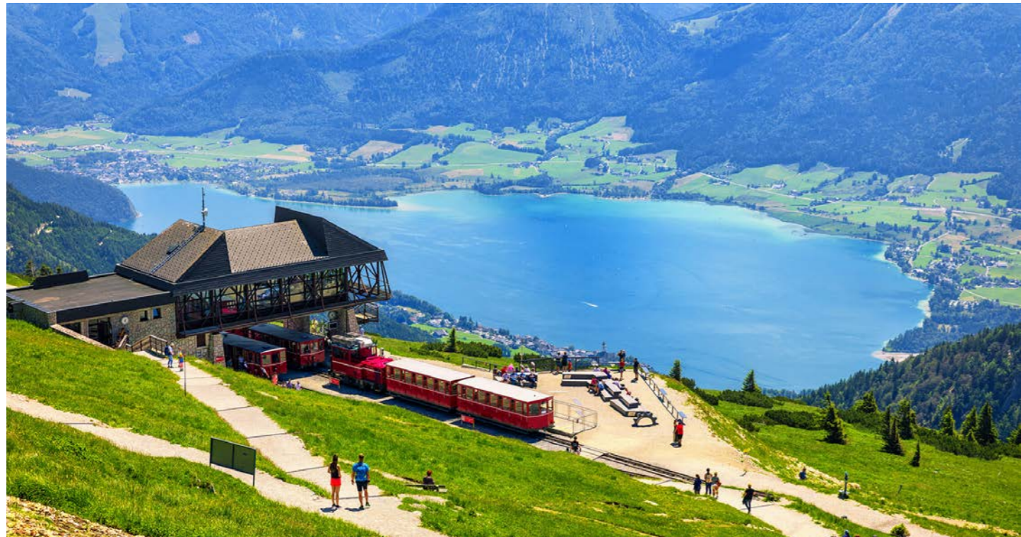
宿泊するザンクト・ヴォルフガングから登山鉄道に乗車して、シャフベルク山頂へ。天気が良ければ東アルプスの山々が連なる絶景を見渡すことができます（イメージ）