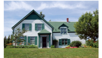
アンの家グリーン・ゲイブルズ

『赤毛のアン』の島として知られるプリンスエドワード島。アンが暮らした、緑の切り妻屋根の家「グリーン・ゲイブルズ」など物語の舞台となった場所へご案内します。この島に生まれ、永遠の眠りにつくことを選んだ、アン作者モンゴメリの生家や墓も訪ねます。各地への移動中に目にする、物語の背景に広がっていた島の穏やかな自然も大きな魅力です。また7月は花のシーズン。バスの車窓から、そして散策で花々が作り出す美しい風景をお楽しみいただけることでしょう。また9、10月は秋景色をお楽しみいただけます。