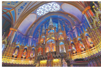
北米最大規模を誇るカトリック教会のノートルダム大聖堂