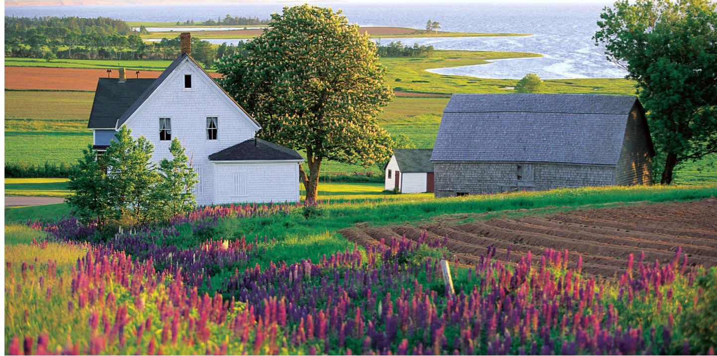
プリンスエドワード島には牧歌的な風景が広がります (イメージ)