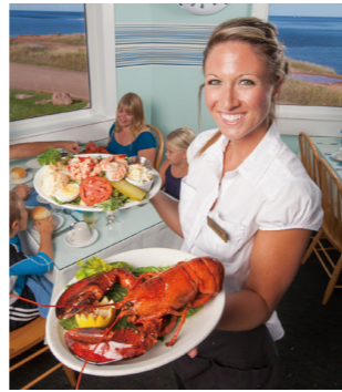
ロブスターをご用意しました(イメージ)

プリンスエドワード島は新鮮なロブスターやムール貝の名産地で、ツアーではロブスターをご用意しています。低温で育つプリンスエドワード島のロブスターは身が締まっていて、おいしいと評判です。