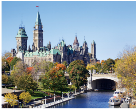
首都オタワ 国会議事堂とリドー運河