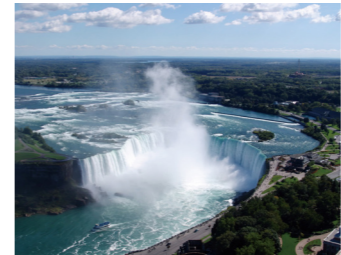
世界三大瀑布のひとつナイアガラの滝(イメージ)

はこのダイナミックな滝の滝壺を遊覧。瀑布の轟音や激しい水しぶきにスリルを味わいながら、滝壺付近の渦巻きまで近づきます。