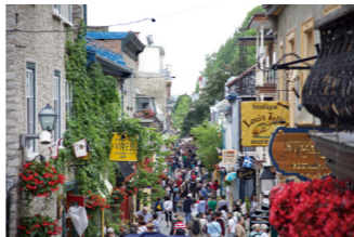
ロウアータウンはフランスの小さな田舎町のような雰囲気です

が楽しい町です。崖の上の城壁に囲まれたアッパータウンと、崖下のロウアータウンそれぞれのエリアをご案内します。