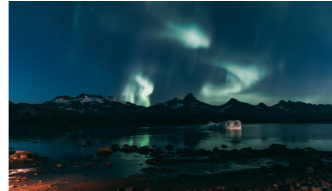
北極圏グリーンランドでオーロラシーズンが始まる9月にご案内します。スコアズビー湾は比較的晴天率が高く期待が高まります(イメージ)

シースピリットがアイスランドのレイキャビクを出港するのは、9月2日。北緯70度付近のオーロラベルト帯は、いつオーロラが発生してもおかしくはない時期に入ります。日没を迎えると、その舞台は整います。スコアズビー湾では、グリーンランド氷床から吹き下りてくる滑降風によって空が晴れる確率が高くなりますので期待が高まります。光源が近くにないことも好条件となり、これがオーロラの観賞率を高め(注:海上は内陸部に比べて雲が発生しやすいのも事実です)。