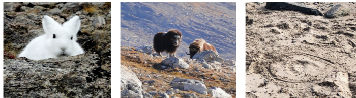
かわいらしいホッキョククワ(イメージ) 北東グリーンランドの野生動物ジャコウウシ(イメージ) シロクマの足跡発見!

今でも入域には許可を得た訪問者しか認められない貴重な国立公園。限られた期間のみ上陸でき、手つかずのツンドラの大地に、ジャコウウシやホッキョククワサギ、本当に運が良ければ、ホッキョクグマなど野生動物に遭遇するチャンスがあります(2022年訪問時はシロクマの足跡やジャコウウシを見ることができました)。※北東グリーンランド国立公園は特に自然環境が厳しいことから、航行、入域できない可能性も十分にございます。