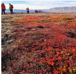
9月のツンドラは一面の草紅葉 ミニハイキングも楽しめます(添乗員撮影)(左) 荘厳で神秘的な朝焼け(右)(2022年添乗員撮影、イメージ)

世界最大・最長のフィヨルド「スコアズビー湾」に迫ります 北極圏内の北緯70度地点、グリーンランドの東海岸に現れるのが、東北地方とほぼ同じ面積で世界最大かつ最長のフィヨルドを有する「スコアズビー湾」です。1年のうち数カ月を除いて氷に閉ざされ、夏でもほんのわずかの旅行者しか訪れることのない、まさに秘境の地。場所によっては2000メートル近い玄武岩の壁がそびえる、フィヨルド地帯を奥へとクルージングしていきます。航行中は、運が良ければセイウチやアザラシ、イッカクなどの海洋生物を目にするチャンスもあります。