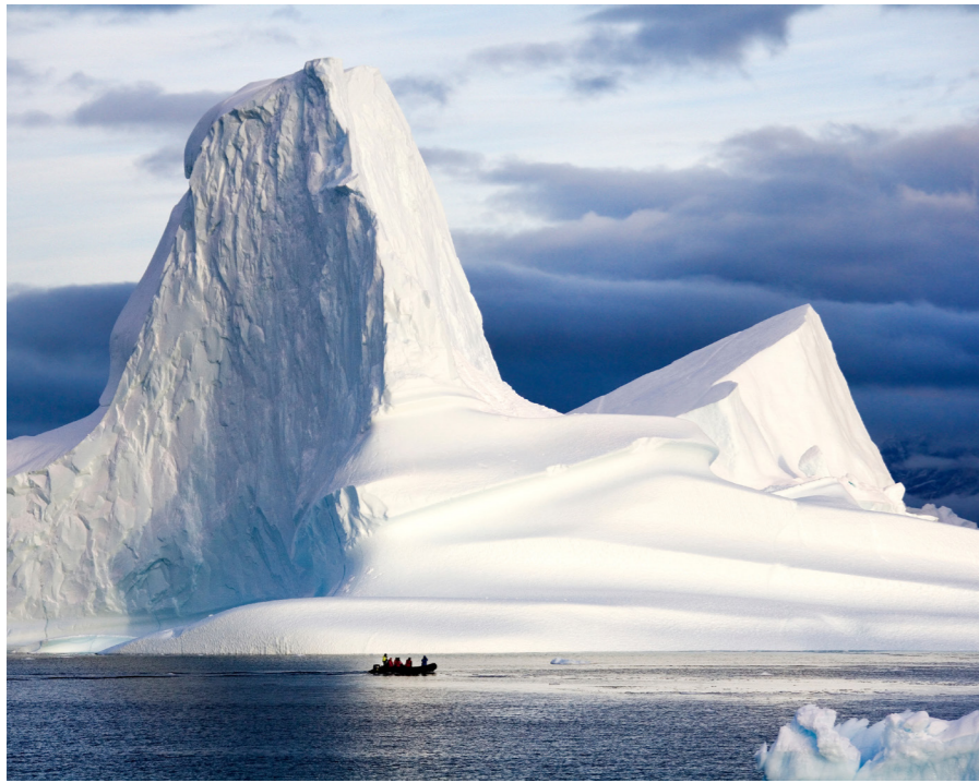
スコアズビー湾を航行中に巨大な氷山が現れるかもしれません。右は2022年の添乗時の写真。奥には2000メートル級の山々が(上)、船上からフィヨルドを眺めるひととき(下)(イメージ)