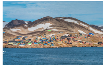
イヌイットが暮らすイトコトミー村を訪問 ※天候によります

グリーンランドの先住民といえば、日本人と同じモンゴロイドのイヌイットが知られています。彼らのほとんどがグリーンランド西岸と南岸に定住しており、東海岸にまで辿り着き定住できたグループはごく一部で、この地は世界で最も隔離された村とも呼ばれています。厳しい環境のなかでいかに命をつないでいたのか、その知恵を世界でも最も辺境な地に築かれた、イヌイットのイトコトミー村を訪ねて探ってみましょう。