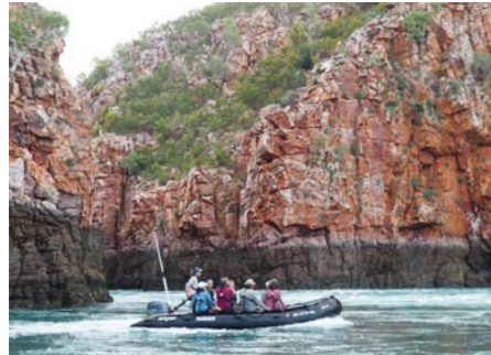
むき出しになった18億年前の地層がすぐそばに