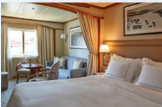
ビスタ・スイート客室イメージ