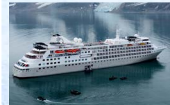
生まれ変わったシルバー・クラウド