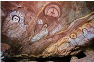
アボリジニの創世神話とされる「ドリームタイム」を表すともいわれる、ワンジナの古代岩絵

オーストラリアには先住民アボリジニが数万年前に残したといわれる、貴重な岩絵が各地に見られます。この旅ではワンジナの岩絵をご覧くださいませ。ワンジナは彼らの精霊を描いたといわれますが、□のない宇宙人を描いたと紹介されることもあり、興味が尽きません。