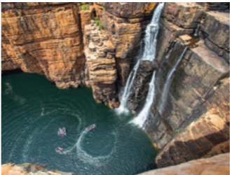
ツインフォールズ。ゾディアックボートで奥地へ進みその落差を体感します（イメージ）

数億年にも及ぶ浸食により形成された赤砂岩のキングジョージリバーを遡り、80メートルもの落差を誇るツインフォールズやキングジョージフォールズへは、ゾディアックボートにてアプローチします。さらにマングローブが生い茂るハンターリバーでは、ワニや水鳥など動物との遭遇も楽しみのひとつです。