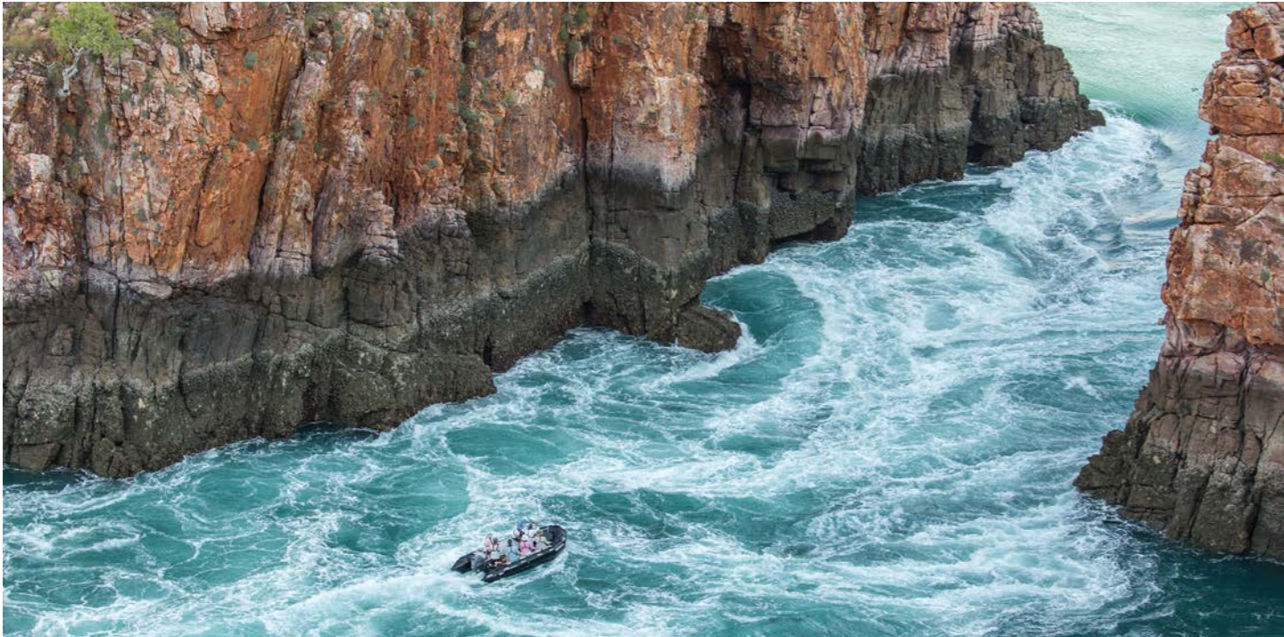
ここにしか現れない通称「水平の滝」へ。周囲には18億年前の地層がむき出しに。まさしく探検クルーズの醍醐味を味わえます（イメージ）