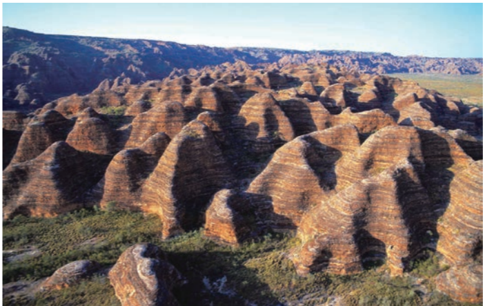
2000 万年以上の年月をかけて侵食された奇岩群。遊覧飛行で眼下に広がる景色をご覧くださいませ

バングルバングルは、ウルルと双壁を成す驚きの世界遺産。その奇観は、川の下流に運ばれた土砂が堆積し岩石となり、それが隆起し2000万年以上の年月をかけて浸食した姿です。微生物が繁殖したことによって変色した粘土層の黒色と、鉄分を含む硬い砂岩層が酸化して生じたオレンジ色が交互に重なり、「ハチの巣」とも呼ばれます。遊覧飛行で眼下に広がる奇岩群バングルバングルをご覧くださいませ。