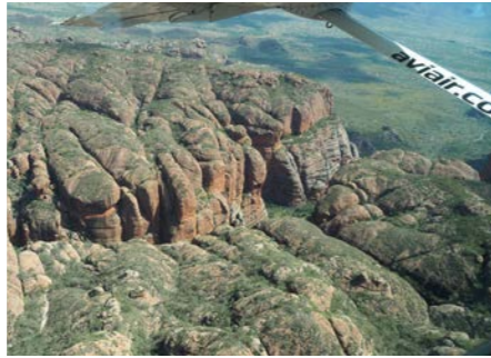
世界遺産バンブルバングルの遊覧飛行を楽しみました