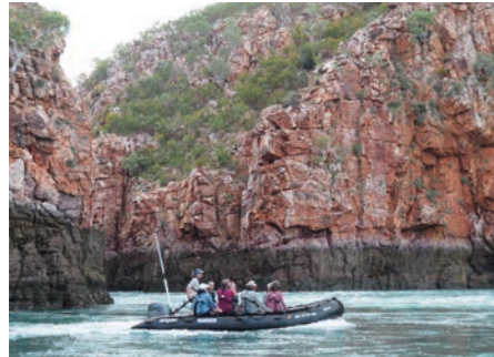
むき出しになった18億年前の地層がすぐそばに