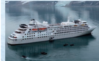
シルバー・クラウド号