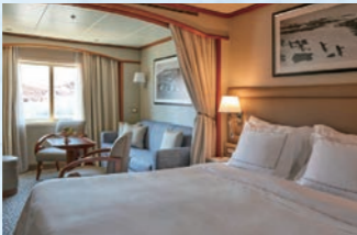
ビスタ・スイート客室イメージ