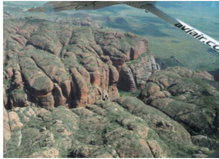
世界遺産バンブルバングルの遊覧飛行を楽しみました