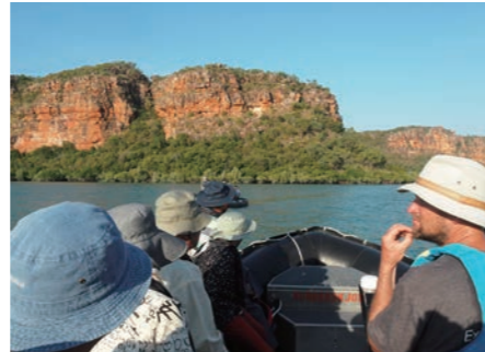
ゾディアックボートにてハンターリパークルーズへ