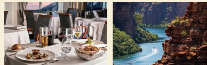
(左) お食事はもちろん、ドリンクやチップも含まれたオールインクルーシブです (右) 数百年の時間が流れた圧巻のキングジョージ渓谷をゾディアックでゆく (イメージ)