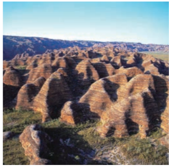
2000 年以上の年月をかけて侵食された奇岩群。遊覧飛行で眼下に広がる景色をご覧くださいませ

バングルバングルは、ウルルと双壁を成す驚きの世界遺産。その奇観は、川の下流に運ばれた土砂が堆積し岩石となり、それが隆起し2000万年以上の年月をかけて浸食した姿です。微生物が繁殖したことによって変色した粘土層の黒色と、鉄分を含む硬い砂岩層が酸化して生じたオレンジ色が交互に重なり、「ハチの巣」とも呼ばれます。遊覧飛行で眼下に広がる奇岩群バングルバングルをご覧くださいませ。