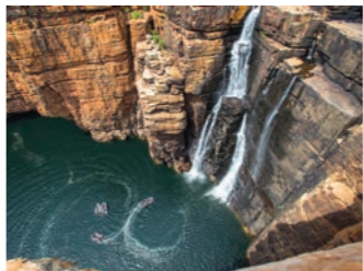
庄巻のツインフォールズ。ゾディアックボートで奥地へ進み、その落差を体感します(イメージ)

数億年にも及ぶ浸食により形成された赤砂岩のキングジョージリバーを遡り、80メートルもの落差を誇るツインフォールズやキングジョージフォールズへは、ゾディアックボートにてアプローチします。さらにマングローブが生い茂るハンターリバーでは、ワニや水鳥など動物との遭遇も楽しみのひとつです。