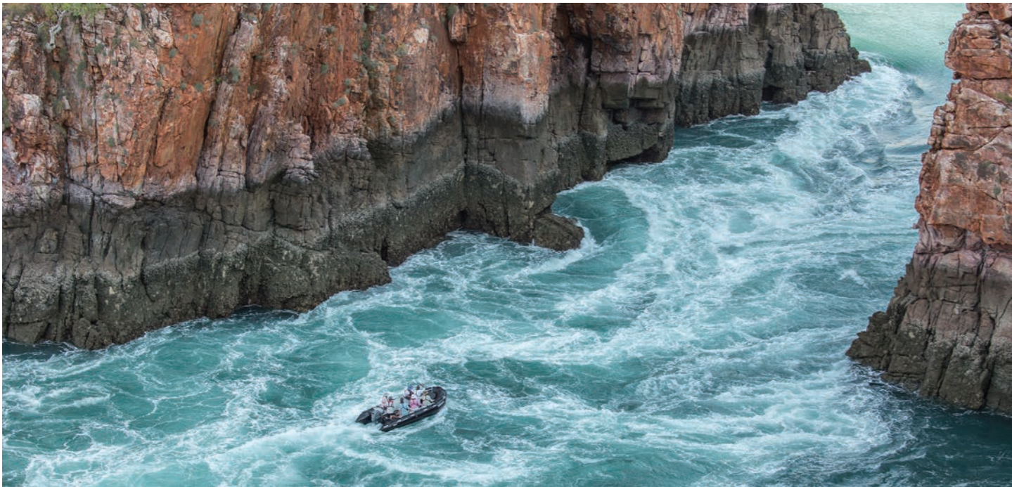
ここにしか現れない通称「水平の滝」へ。周囲には18億年前の地層がむき出しに。まさしく探検クルーズの醍醐味を味わえます(イメージ)