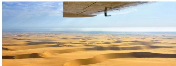
美しいナミブ砂漠は時間帯や光線の角度によって色彩を変えていきます(イメージ)

ナミビアを代表する見どころ、ナミブ砂漠は約8000万年前に生まれた世界最古、そして世界一美しいとも紹介される砂漠です。附着した鉄分が酸化することによって赤みを帯びているのが特徴です。光線によって刻々と色と形を変えていく様子や、遊覧飛行に出発し上空から角度も変えて、世界遺産の砂漠を存分にご覧いただけます。