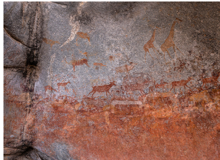
高さ10メートルの巨大なヴァイラバ神の顔が刻まれています。マトポ国立公園にて。