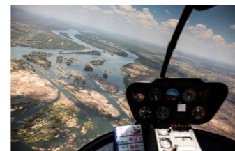
ビクトリア大瀑布のヘリコプター遊覧(イメージ)