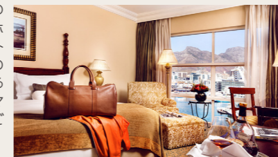
ザ・テーブル・ベイ(客室イメージ)

ウォーターフロントのショッピングモールへホテル館内からダイレクトにアクセスでき、世界中のセレブリティにも愛されるホテルです。テーブルマウンテン側のお部屋をご用意しました。