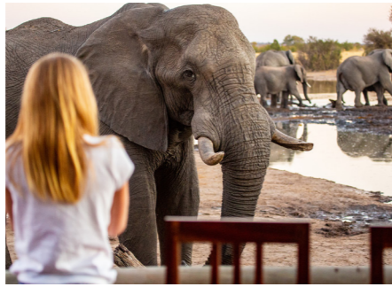
ワング国立公園の下車観光では動物サファリをお楽しみいただけます。