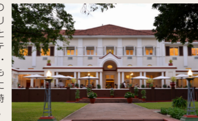
ザ・ビクトリア・フォールズ・ホテル

1904年にイギリス人によって建てられた歴史のある建物で、ジンバブエで最も歴史のあるホテルのひとつです。まるでイギリスの邸宅のような堂々とした外観と豪華なインテリアが美しく、ビクトリア・フォールズにいながらもイギリスの5つ星ホテルにいるかのような優雅な時をお過ごしいただけます。