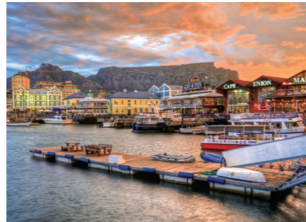
夕暮れどきのウォーターフロント地区。港の背後にはケープタウンのランドマーク、テーブルマウンテンがそびえます。