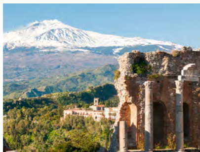
タオルミナの円形闘技場から望むエトナ山の風景は圧巻です(イメージ)

地中海の真ん中に位置し、東にギリシャ、西にアラブ世界が広がり、紀元前から19世紀に至るまでシチリア島はまさに「文明の十字路」であり続けました。ギリシャ、ローマをはじめ、イスラム、ノルマン、スペインなど数多くの民族や列強の支配を受けてきたことで、本土顔負けのギリシャ遺跡からバロック様式の街並みまで、多様な歴史と文化を映し出す建築や遺跡がシチリア島には残されています。風光明媚な景観の中にそうした歴史の街々を訪ねると、「シチリア島旅情」ともいべき感情が自然と湧き出てきます。今回はタオルミナに2連泊、シラクーサに2連泊、パレルモに3連泊と、連泊を中心として、各時代の建築物を見学するのに加え、南東部の街ノート伝統の花祭り「インフィオラータ」の見学も織り混ぜ、様々な素顔を持つシチリア島を旅情豊かに巡る旅へご案内します。