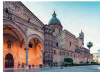
夕刻のパレルモ大聖堂(カテドラーレ)。宿泊ホテルから大聖堂までは徒歩で5分ほど

ロック建築群、カテドラーレ(大聖堂)など、パレルモやシチリアの時代背景によって変化を遂げていった建築群をご案内します。自由行動の時間もご用意しておりますので、地元の食材がずらりと並ぶ市場などに立ち寄るのもおすすめの過ごし方です。