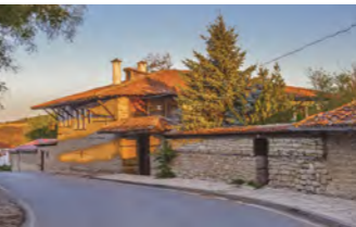
オスマン帝国の面影残るアルバナシ村