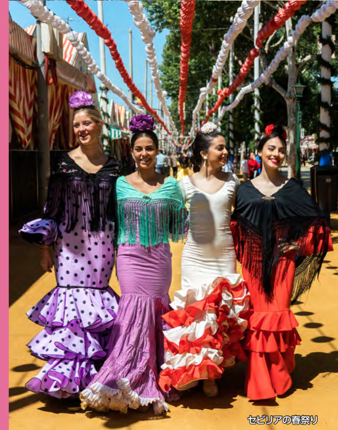
セビリアの春祭り