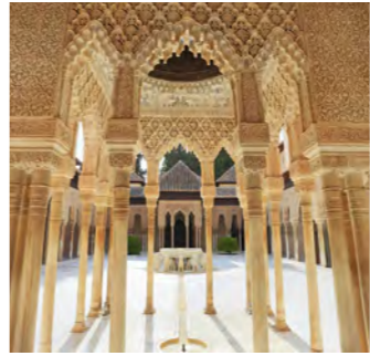
イスラム建築の粋、アルハンブラ宮殿のライオンの中庭

イベリア半島を支配したイスラム教徒たちは、各地に壮麗な宮殿やモスクを築き、その中には後にレコンキスタで国土を奪還したキリスト教徒たちも破壊をためらうほどの、見事な芸術的建築もありました。その代表格がグラナダのアルハンブラ宮殿です。内装の精緻なレリーフや優美な彫刻など、洗練された美しさは圧倒的で、イスラム建築の最高峰と称えられるのもうなずけます。