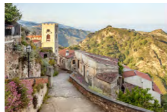
映画「ゴッドファーザー」のロケ地としても知られるサヴォカ村