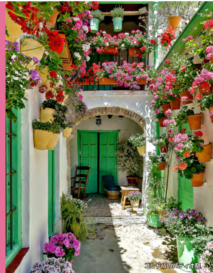
ゴールドバのバチオ祭