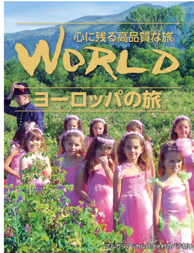
ブルガリア・カルロヴォ村のバラ祭り