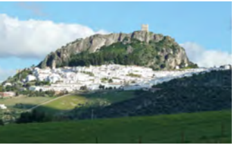
アラブの古城の下に白い家々が密集するサアラの村