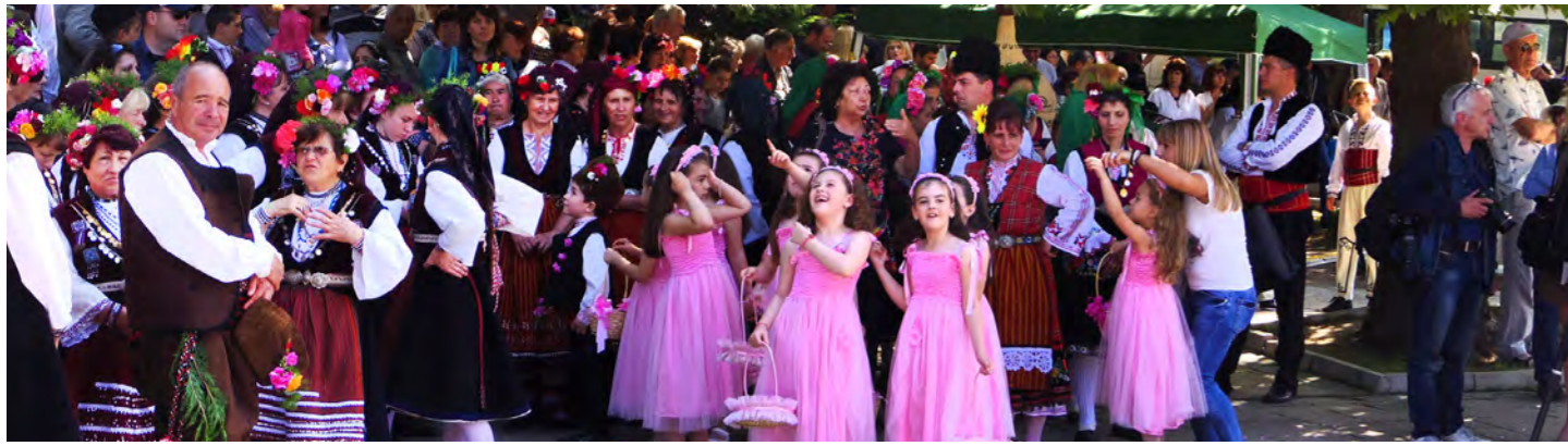
心温まるカルロヴォ村で開催されるバラ祭り(イメージ)