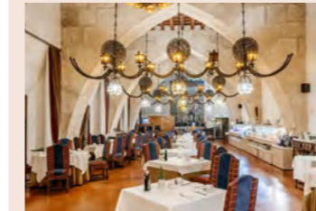
ハエンのパラドールのレストラン

ツアーではパラドールでのお食事もお楽しみします。15世紀の修道院を改装したグラナダのパラドール「サンフランシスコ」はアラブとキリスト教両文化が融合し、独特の雰囲気を作り出しています。レストランの雰囲気と共に料理も評判の良い贅沢なひとときをお過ごしください。また、ハエンの町を見下ろす高台にあるパラドールでの昼食もご用意しました。