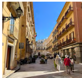
シチリア島の西端に位置しアフリカの風も感じられるトラーパーニは美しいバロック建築の旧市街を持ちます