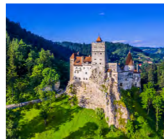
ドラキュラのモデルとなった城「ブラン城」

カルパチア山脈に囲まれたトランシルバニア地方には、ドイツ人が入植していたこともあり、その町並みは他の東欧の町々とは大きく異なります。ブラショフを拠点に中世の趣がそのままに残るドラキュラのモデルとなったヴラド・ツェペシュの聖地シギシオアラや、世界遺産のプレジューメールの要塞教会などを訪ねます。