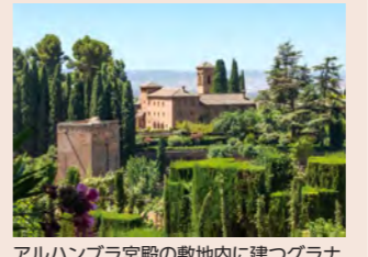
アルハンブラ宮殿の敷地内に建つグラナダのパラドール「サンフランシスコ」