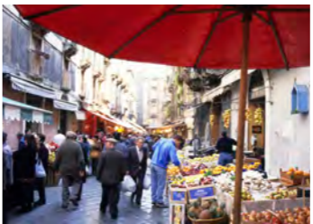
パレルモの市場の様子(イメージ)