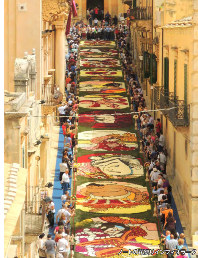
ノートの花祭りインフィオラータ