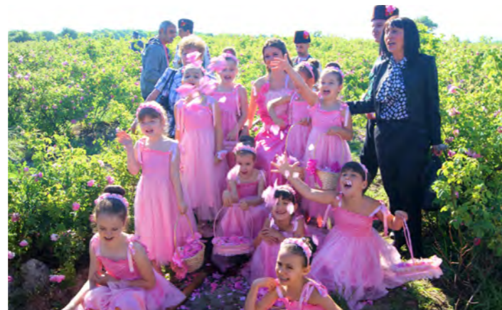
村人総出の「地元のお祭り」です(イメージ)

ブルガリアの1年の暦の中で最も賑わうと言っても過言ではない「バラ祭り」。世界中から観光客が集いますが、地元の方にとっても待ちに待ったイベントで、花摘みを終えた人々が民族衣装に身を包み、踊りや歌を繰り広げるほか、その年に選ばれた「バラの女王」が登場するなど、バラの香りと地元の方々の喜びに満ち溢れた笑顔が訪問者を歓迎してくれます。最も有名なバラ祭りはカザンラクにて開催されるものですが、こちらはブルガリアでも最大級のもので、多くの人々で賑わいます。しかし、当社では「祭りはただ見るだけでなく地元の人々と触れ合っ