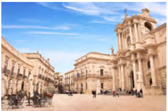
美しいバロック様式のドゥオモ広場