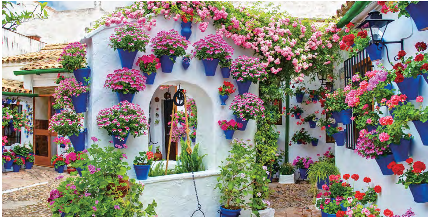
路地をぶらぶら歩きながら地元の人々の生活に触れるコルドバのパティオ祭り (5/7 発) (イメージ)