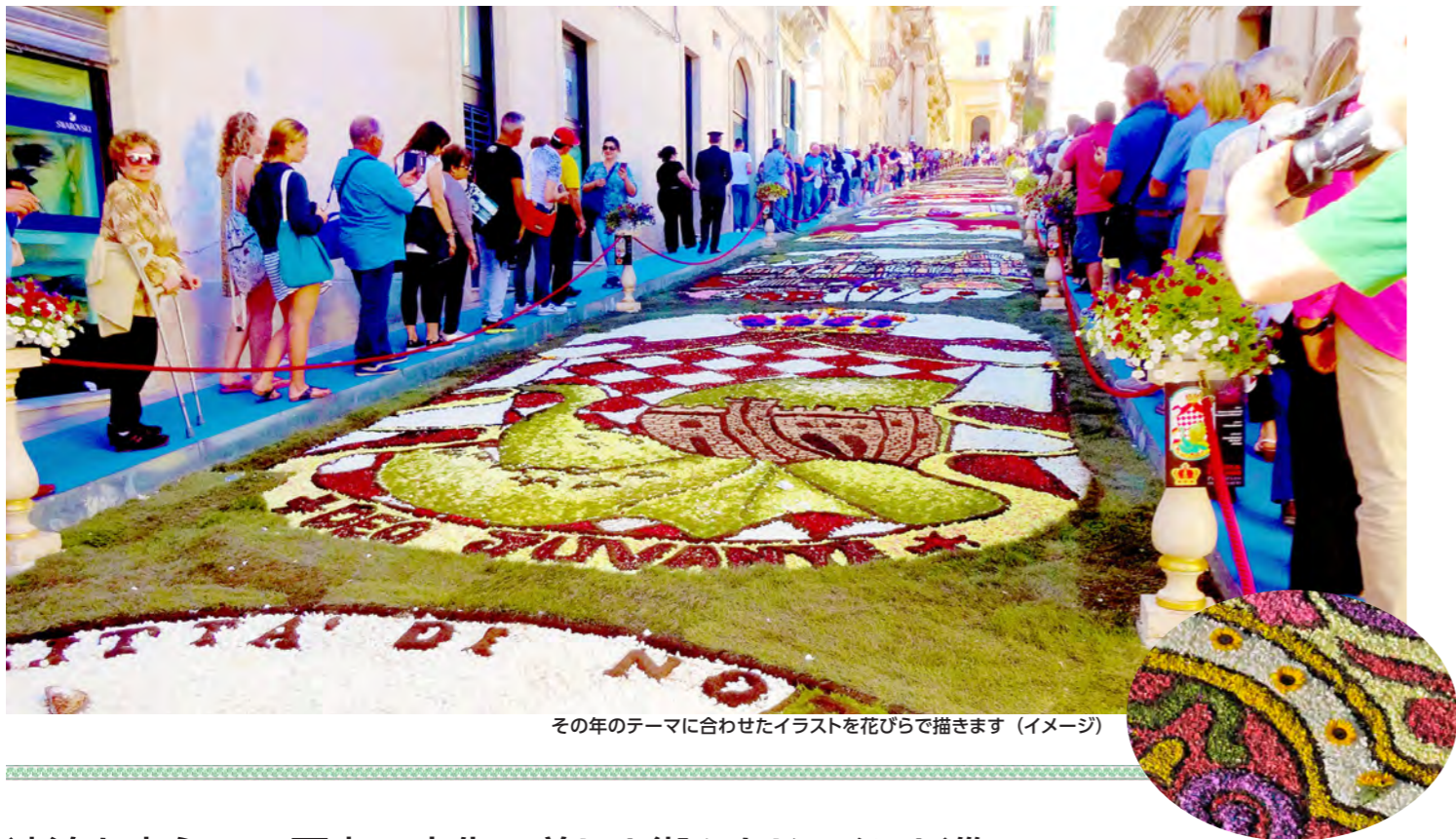
その年のテーマに合わせたイラストを花びらで描きます (イメージ)