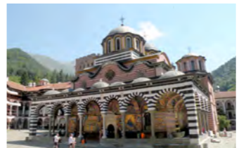
ブルガリア屈指の聖地 リラの僧院

リラ山脈に佇むリラの僧院は、500年間に及んだオスマン帝国の支配下においても伝統と文化が守り抜かれた場所です。僧院の外壁にも美しいフレスコ画が残っておりますので、ぜひご覧ください。