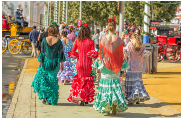
地元の人々の色鮮やかな衣装と賑わいを楽しむセビリアの春祭り(4/10発)(イメージ)

春の訪れを祝う祭り「フェリア・デアプリル・デ・セビリア」。祭りの日、女性達はカラフルなフラメンコの衣装で、男性達はつば広の帽子にジャケットで正装します。会場にはカセタという大きなテントが1000棟以上も並び、人々が賑わいます。多くのカセタは団体ごとの私的なものですが、一般観光客にも開放している公共のカセタもありますので、地元のお祭り気分をお楽しみください。