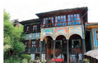
美術館都市 コプリフシュティツァ

「ヨーロッパの美しい村30選」にも選ばれたこの村は、ブルガリアで初の美術館都市を宣言した場所としても知られます。19世紀の豪商の家が保存されており、どこか懐かしい村の雰囲気は旅人を魅了しています。