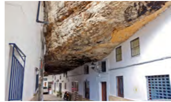
セテニール・デ・ラス・ポデガス 巨岩をそのまま壁や屋根にしてしまった驚きの建築

られた洞窟住居で有名なセテニール・デ・ラス・ポデガス、「スペインの最も美しい村」の一つで、丘の上に建つアラブの古城を頂点に、白い街並みが麓に向かって広がる絶景の村サアラなどを訪ねます。