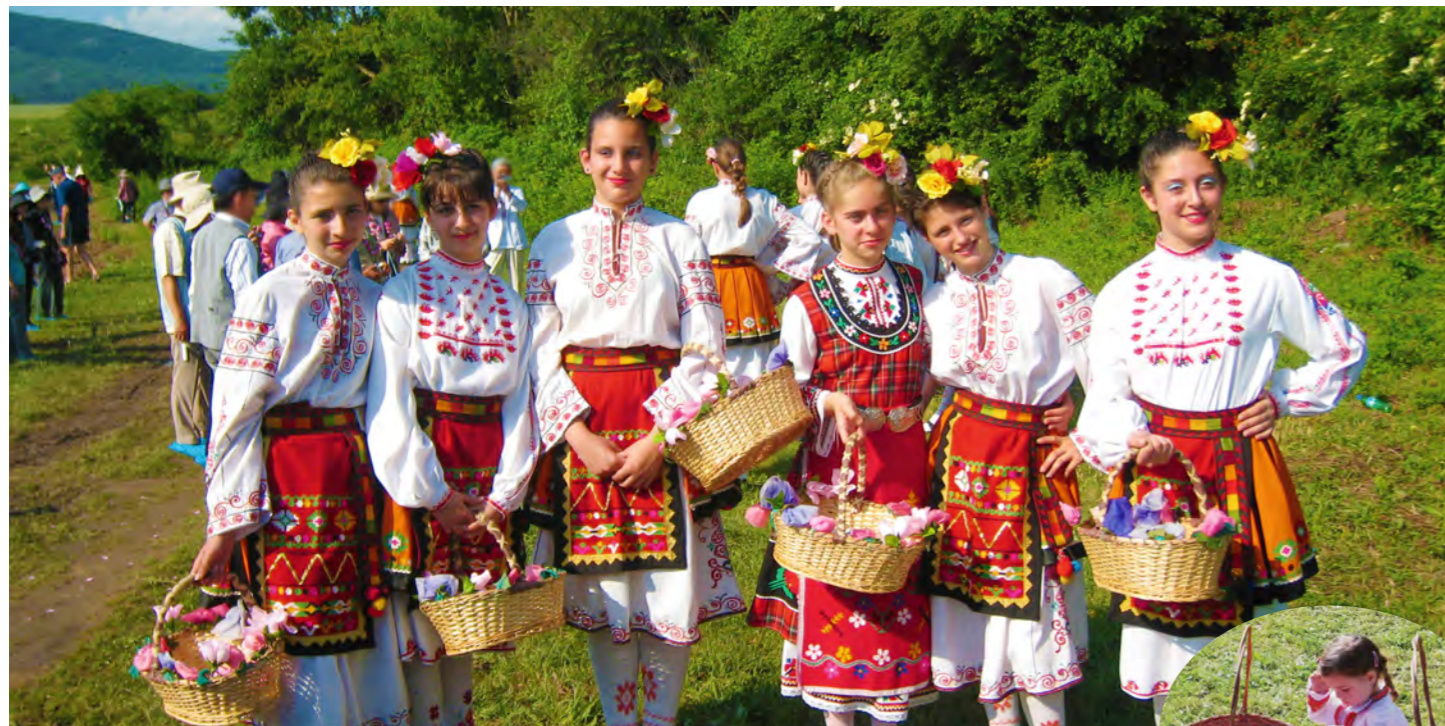
民族衣装を纏った少女たちを記念撮影（添乗員撮影・イメージ）、見よう見まねで摘まれたバラの籠を持つ少女（添乗員撮影・右イメージ）