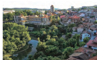
かつてのブルガリアの首都ペリコ・タルノボに2泊

す。また、ペリコ・タルノボ滞在中には、近郊のオスマン帝国時代の家並みが数多く残るアルバナシ村を訪ねます。かつての豪族が暮らした旧家の一部が公開されており、イコンと壁画で埋め尽くされたキリスト教会などの見どころも多い村です。