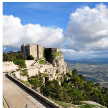
標高751メートルの断崖絶壁から下界を遥かに見下ろす空中都市エリチェ

シチリアを周遊するコースでも、なかなか訪れる機会の少ない2つの街をご紹介します。ひとつはトラーパーニ。その位置的に、どこか北アフリカの風情を感じられる街で、レストランを覗くと伝統料理のクスクスやタジンを提供しているお店も。もうひとつは天空の街エリチェ。ロープウェイにてアクセスすると、眼下にはシチリアの大地とティレニア海を見渡せます。