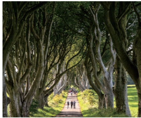
不思議な光景のバナの並木道ダークヘッジスは、昨年好評でした