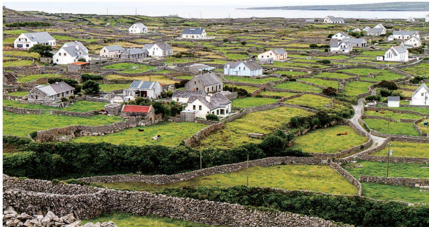
アラン諸島の集落 石垣は強風から作物を守るために築かれました