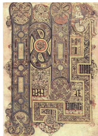
約300年もの間、図書館に保管されてきた『ケルズの書』

ダブリンでは2連泊して町の散策へ。アイルランド最古の大学トリニティカレッジにご案内します。図書館には400年以上にわたって収集された希少な書物の数々が集まり、中でも9世紀に作られた4福音書の写本『ケルズの書』は「世界で一番美しい本」とも呼ばれる至宝です。また、ダブリン近郊の古代遺跡ニューグレンジヤ「アイルランド人の心のふるさと」とも言われるタラの丘にもご案内します。