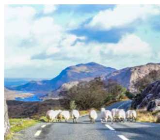
ケリー周遊路 庄巻の景色が次々と現れます(イメージ)

キラニーに連泊し、ケリー周遊路へご案内します。アイルランド南西部、大西洋に突き出たアイベラ半島を約170km巡る人気のドライブルートで、山道のカーブを曲がるたびに現れる、美しい海と海岸線、沖に浮かぶ島々の光景、そして雄大な山々の合間に初期キリスト教の遺跡や絵になる素朴な村や中世の町並みが点在しています。