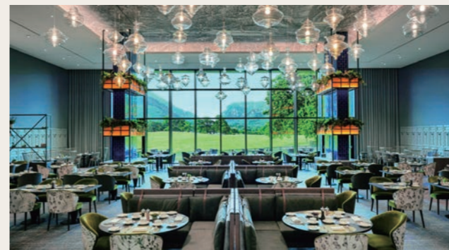
眺めが素晴らしいレストラン

ダンロー渓谷は、氷河により削られた谷でマクギリーカディ山脈とパープル山の間に広がります。緑豊かな大地と所々に点在する氷河湖の光景が印象的な所です。そんな雄大な自然の真っ只中に建つホテル「ザ・ダンロー」での連泊をお楽しみください。