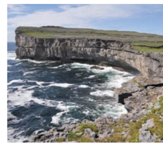
アラン諸島、イニシュモア島のドン・エングス。絶壁の上に古代遺跡が残ります

アイルランドの魅力となっているのが、ケルト人の文化です。その文化が今も残る、アラン諸島イニシュモア島を訪ね古代の史跡やかつての素朴な農耕風景をご覧いただけます。その最大の名所、大西洋に面するドン・エングスは、古代ケルト人が宗教儀式を行った古代遺跡。海拔87メートルの断崖絶壁に位置し、景色も迫力満点です。