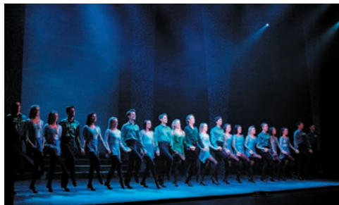
華麗なステップで踊る庄巻のリバーダンス鑑賞へご案内します

ヨーロッパ各地に暮らしていたケルト人たちが、最終的に定住したのが現在のアイルランド。まさにケルト末裔の地を訪ねる、古代ヨーロッパ文明の残照にふれる旅といえるでしょう。このたびは魅力溢れる首都ダブリン、森と水の風景が広がるキラニー、アラン諸島への拠点となるゴールウェイ、そして北アイルランド最大の町ベルファストそれぞれに連泊し、周遊の旅にもかかわらず、少しでもゆとりを持たせた内容で南北アイルランドをご紹介します。さらに、島の西部に残る手つかずの自然景観や美しい緑の丘陵地帯、さらにケルト人の古代史跡も残るアラン諸島のイニシュモア島も訪問。どこか懐かしさを感じさせる国アイルランド。古代から連綿と続く伝統文化、素朴で温かい人々、そして、荒々しくも美しい大自然をお楽しみください。