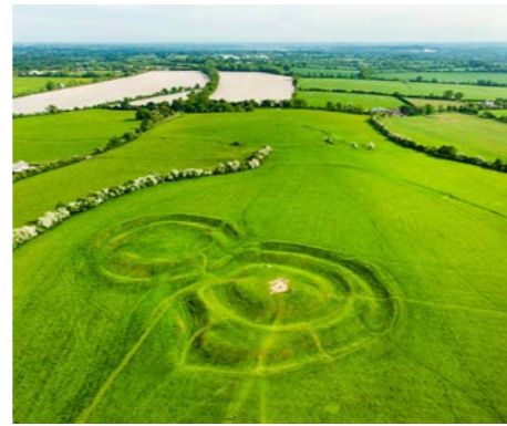
ケルト王国発祥の地「タラの丘」にも立ち寄ります