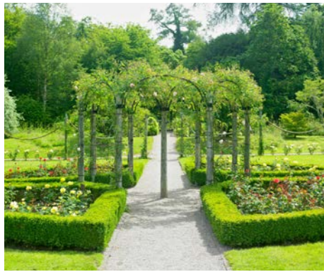
18世紀の美しい邸宅と庭園のフローレンスコートへご案内します