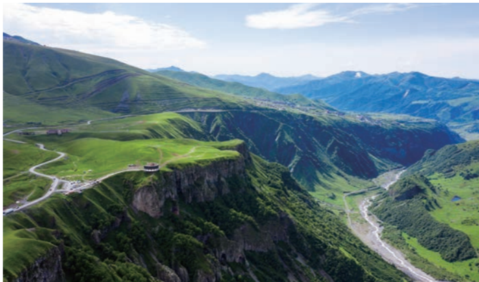
現在は景勝道路として人気のジョージア軍用道路をドライブ

18世紀頃、帝政ロシアによって建設されたジョージア軍用道路。固い名前に反して、今ではコーカサス山脈の観光に欠かせない景勝ルートです。5,000メートル級の山々を望み、その美しさは文豪プーシキンらを魅了しました。カズベキへ向かう途中には十字架峠があり、ここで初めてシルクロードがキリスト教と出会いました。四輪駆動車で分乗し、カズベキ山を背景にグルジア正教のツミングサメバ教会が建つ、まさにコーカサスを代表する風景へと足を延ばします。