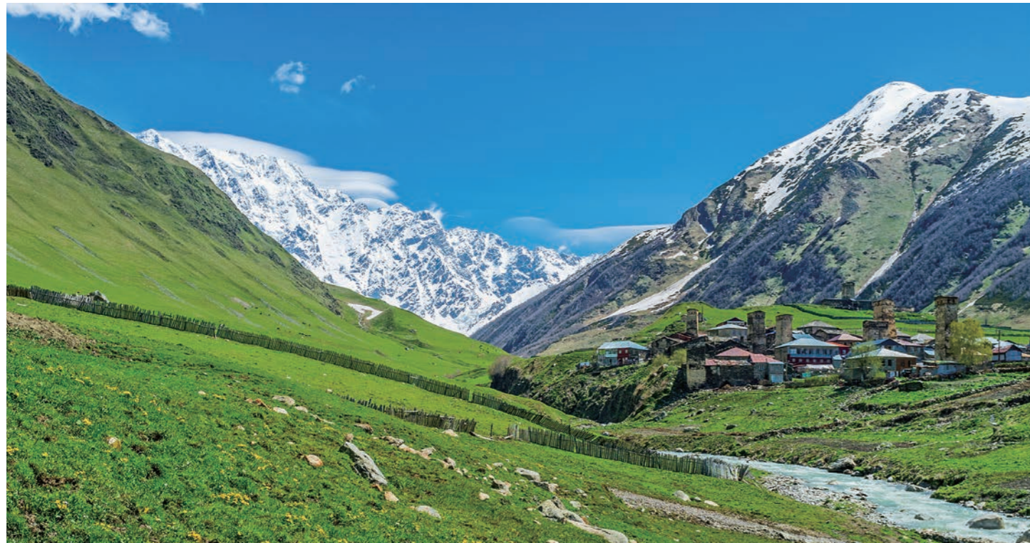
メスティアの奥地、まさに秘境という名にふさわしい世界遺産ウシグリ村