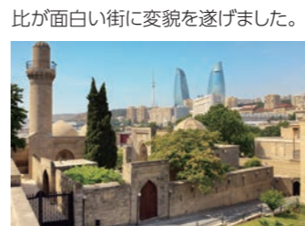
新旧入り混じるバクーの街並み

アジアとヨーロッパを結びシルクロードの中継都市でもあったバクー。城壁内の旧市街では、「乙女の望楼」をはじめとする世界遺産の建築をご覧いただけます。対して新市街はカスピ海油田など豊富な天然資源に恵まれた背景から、中東のような高層ビルが林立。新旧の対