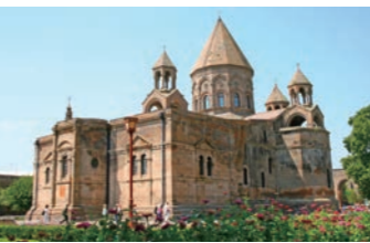
エチミアジンの大聖堂