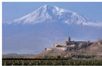
ホルヴィラップ修道院とアララト山

人々はこちらでその典礼を守り続けています。また、南に行くと、トルコ国境に位置する、ノアの方舟伝説で知られるアララト山が望めます。