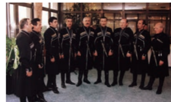
世界無形文化遺産ポリフォニー (イメージ)

ツアー中、世界無形文化遺産に登録されているジョージアの伝統音楽「ポリフォニー」をお聴きいただけます。紀元前1世紀頃から伝承されてきた独自の多声音楽が力強く響きます。