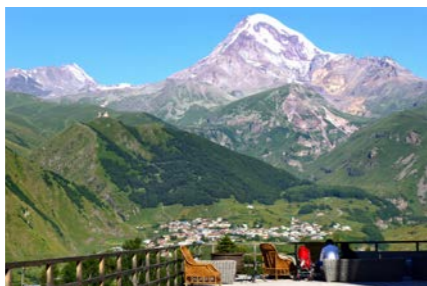
ホテルの敷地内から望むカズベキ山。世界でも屈指の絶景ホテルに宿泊します

ツアー最後の宿泊はステパンツミンダ(旧名カズベキ)にある絶景ホテル「ルームズ・ホテル・カズベキ」にて、カズベキ山を正面に臨むお部屋をご用意しました。お天気に恵まれば部屋やテラスから間近に秀峰カズベキをご覧いただけます。