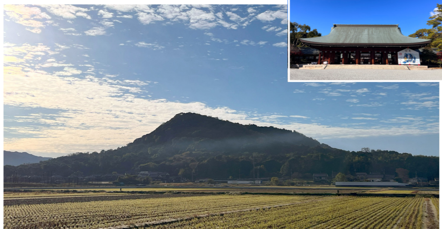
畝傍山/ (右上) 橿原神宮の後ろに畝傍山があります(イメージ)