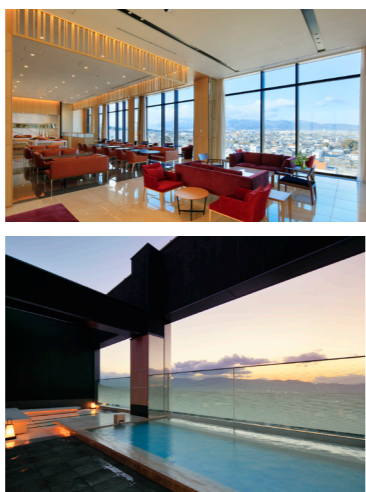
(上)9階にあるロビーから橿原の町が一望できます (下)最上階にある露天風呂(上下イメージ)

宿泊は近鉄「大和八木駅」から徒歩3分の便利な「カンデオホテルズ奈良橿原」です。歩く旅ということで、日中の疲れを癒していただけるよう、大浴場があるホテルを選びました。大浴場からは大和三山を望むことができます。露天風呂もあり、内風呂やサウナもご用意しています。朝食はホテルこだわりの種類豊富な和洋ビュッフェをお楽しみください。