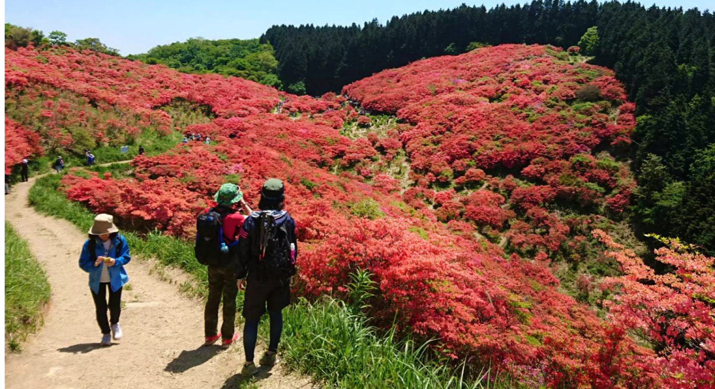
一面に真っ赤なツツジが広がっています(イメージ)