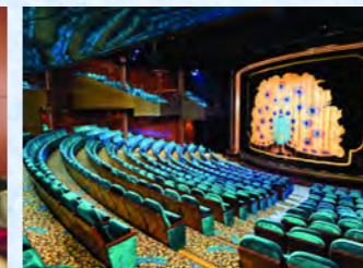
迫力のショーが行われるシアター