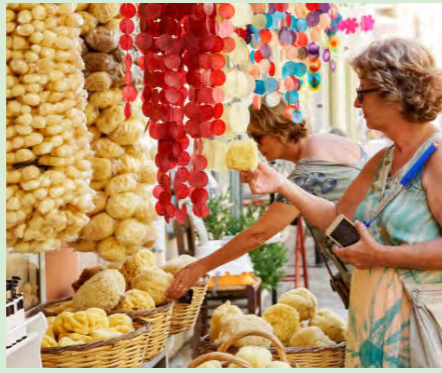
旧市街全体が世界遺産のケルキラ島では、ギリシャらしいお土産物が並んでいます

地中海にはフェニキアや古代ギリシャの昔から続く港町がいくつもあります。飛行機のない時代、港は世界への玄関口。遠い異国から旅人や商人、様々な荷をどっさり積んだ船が着くと、港町はどっと活気づき、そこには賑やかな市が立ちました。新鮮な魚や野菜はもちろん、スパイスやドライフルーツが並ぶ市を歩く楽しさは、今も昔も同じです。寄港地では港町を散策し、その土地ならではの土産を探したり、名物を味見したり。港町ならではのひとときです。