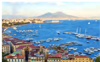
ナポリ湾とその奥に聳えるヴェスヴィオ山(イメージ)