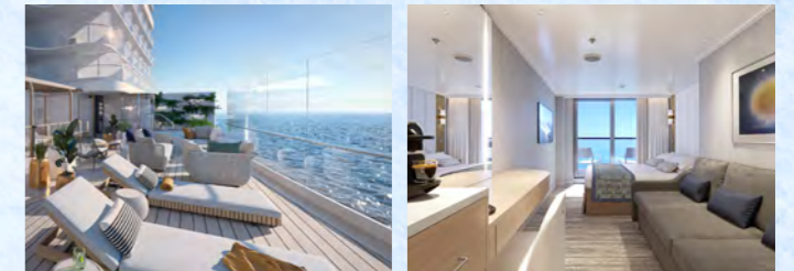
最新設備とプリンセス伝統の上質なサービスをご体験ください(イメージ)