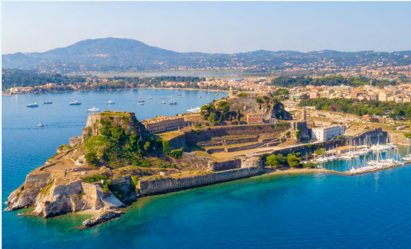
ケルキラ島 (英名コルフ島)

アドリア海の出口付近に位置するケルキラ島(コルフ島)。その地理的要因から、ベネチアやイギリス、ハプスブルグなど様々な影響を受けてきました。世界遺産の旧市街の散策と日本の浮世絵コレクションで有名なアジア美術館にご案内します(3コース共通)