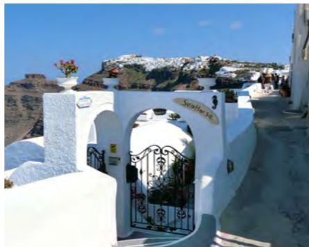
サントリーニ島では、フィラの町の散策へご案内します (イメージ)

古きよきギリシャの風景、粉ひき風車と真っ白な壁の家が広がるミコノス島。白い家並みと迷路のような路地が続き、旅情を誘います。パルポルティアニ教会と6つの風車はこの島を代表する景観です。ミコノスタウンのギリシャらしい風情を味わいながらの散策をお楽しみください。また、サントリーニ島はアトランティス伝説で知られる美しい島。白い壁に青い円形の屋根が特徴的な家が立ち並び、絵に描いたような島です。島の中心フィラの散策などをお楽しみください。