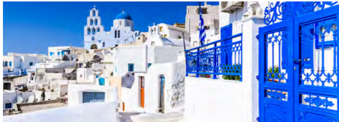
まさに絵になる風景サントリーニ島(イメージ)