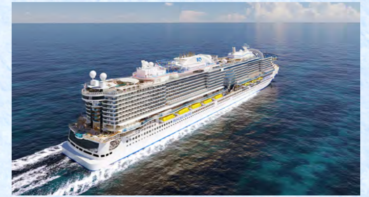
サン・プリンセス(イメージ)

SHIP DATA ■ 総トン数: 175,500トン ■ 全長: 345メートル ■ 乗客定員: 4,300人 ■ 建造年: 2024年