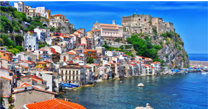
イタリアの美しい村シッラ(イメージ)

プレミアムシップに分類されるプリンセスクルーズ社の最新鋭船「サン・プリンセス」で、初夏の地中海を横断。このたびのクルーズでは、通常のツアーでは足を延ばしにくいギリシャのケルキラ島への寄港やコトルフィヨルドの最奥部に位置するモンテネグロのコトルへの船でのアプローチ、世界三大美港の一つナポリへの入港シーンなど、海から訪ねるからこそこの寄港地や景観をお楽しみいただけます。シチリア島のメッシーナではメッシーナ海峡をフェリーで渡り、「イタリアの美しい村」に登録されている漁村シッラの観光など、観光内容も充実しております。また、終日クルーズの際には、最新鋭客船の様々な船内施設を利用したクルーズライフもお楽しみいただけます。各観光地が賑やかになる5月下旬のご案内です。