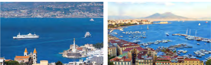
メッシーナ海峡をフェリーで渡りイタリア半島側へ