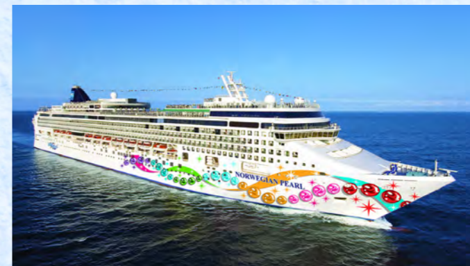
ノルウェーجان・パール