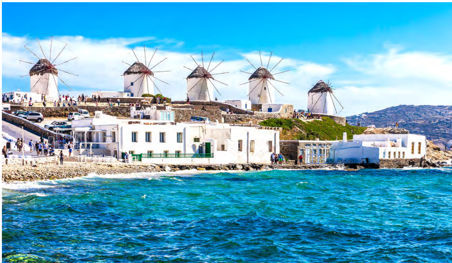
ミコノス島 初夏の光に照らされるミコノスにはどこに行っても絵になる風景が (イメージ)