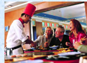
ドレスコードなく気軽に楽しいひと時を