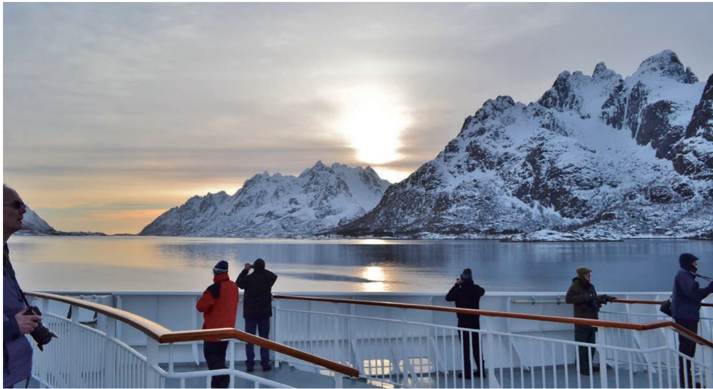
沿岸急行船からの眺め(イメージ)